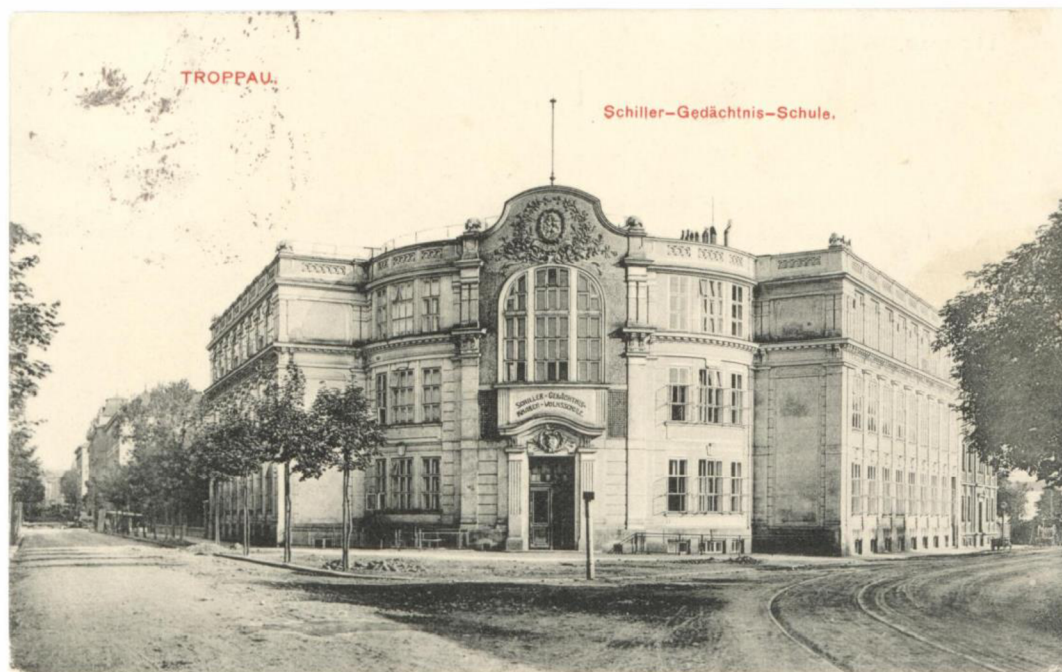
Obrázek č. 4: Pohlednice Troppau. Schiller-Gedächtnis-Schule (1911) 340