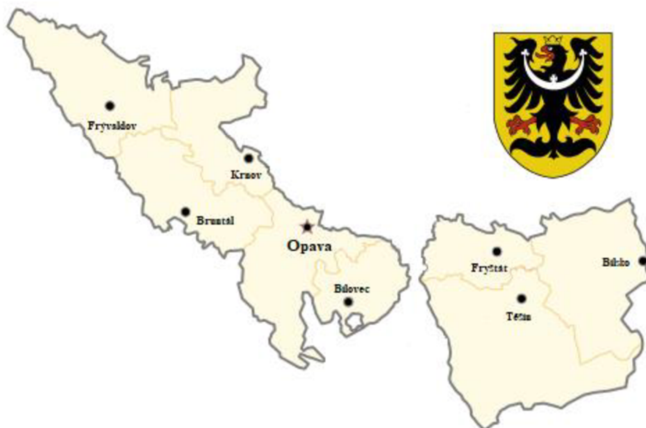
Mapa č. 2: Soudní okresy politického okresu Opava mezi lety 1868-1896