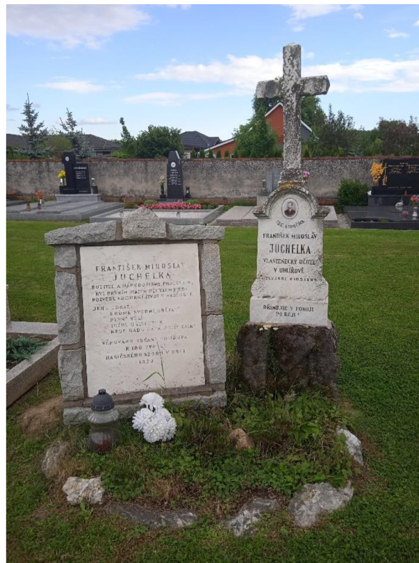
Obrázek č. 6: Hrob Františka Miroslava Juchelky v Uhlířově 342