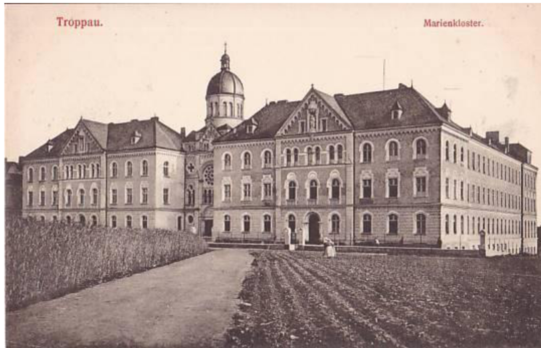
Obrázek č. 2: Pohlednice Troppau. Marienkloster (cca 1938) 338