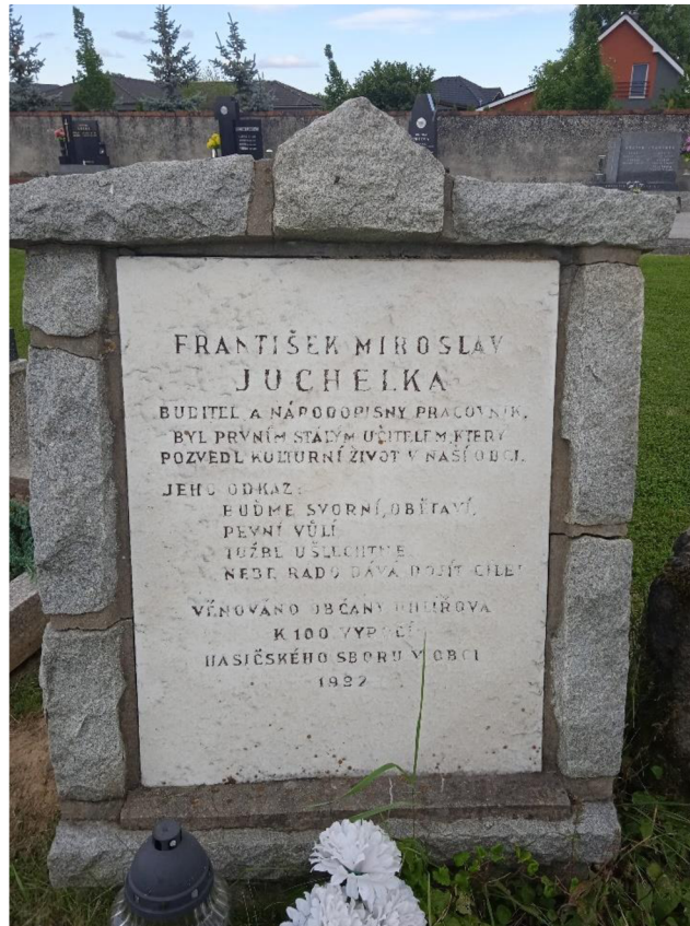
Obrázek č. 8: Detail pamětní desky 344