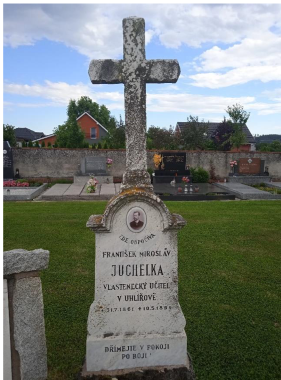
Obrázek č. 7: Detail hrobu 343