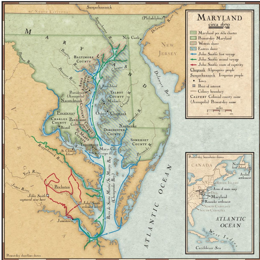
Obrázek č. 3: Průzkumné cesty Johna Smithe (education.nationalgeographic.com)