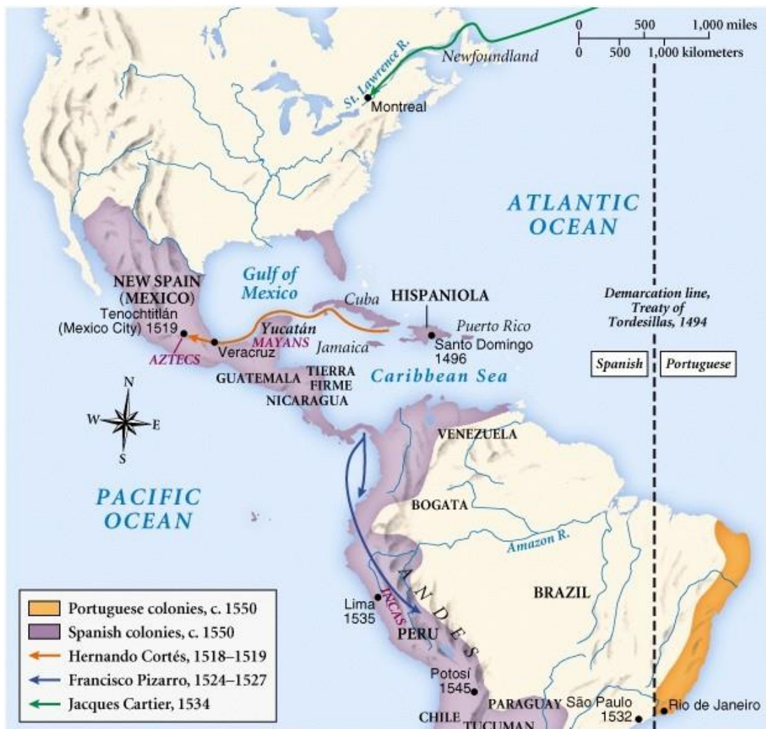
Obrázek č. 2: Tordesillaská smlouva, španělská a portugalská kolonizace (domin.dom.edu)