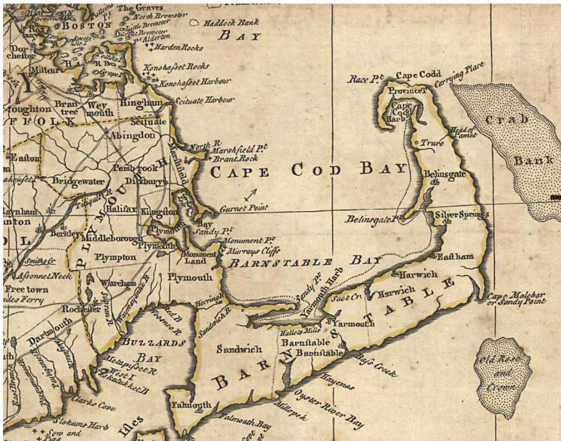
Obrázek č. 5: Zátoka Cape Cod – Plymouth kolonie (1776) ( www.histarch.illinois.edu )