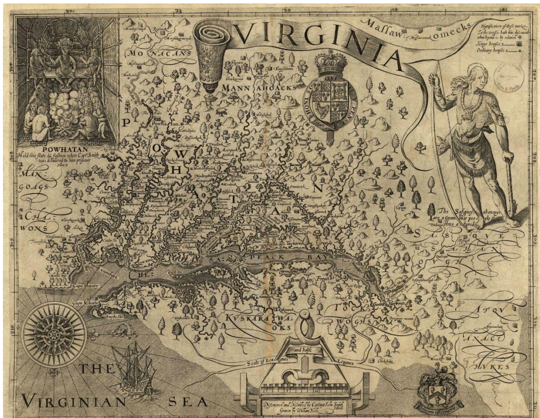
Obrázek č. 4: Mapa Virginie od Johna Smithe z roku 1612