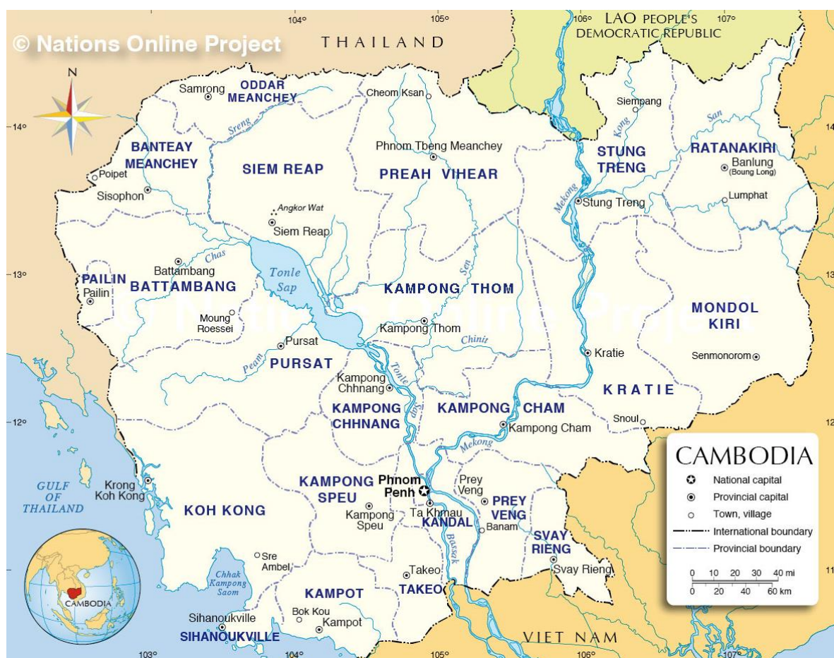
Obrázek č. 2: Mapa Kambodži (Nations Online 2017)

Kambodža, jihoasijský stát nacházející se mezi Vietnamem, Thajskem a Laosem, se s následky své pozoruhodné historie potýká i v současnosti. Genocida, která se v zemi odehrála během 70. let 20. století za režimu Rudých Khmérů, i v současnosti nepřímo ovlivňuje rozvoj země. Během konfliktu byl zničen vzdělávací systém a veškeré sociální služby. Země, která tímto konfliktem zůstala poznamenaná, čelila ohromným ztrátám na lidských životech. Nedostatečná vzdělanost a informovanost ohledně pozemních min a různých nemocí vedla k vysokému počtu lidí s postižením (Morris 2016). Přestože oficiální statistické údaje o lidech s postižením nejsou v Kambodži k dispozici, odhaduje se, že je zde jedna z nejvyšších koncentrací lidí s postižením v rozvojovém světě (Thomas 2005: 5). Podle odhadů tvoří lidé s postižením až 5 % celkové kambodžské populace, což je přibližně 650 000 lidí (Carter 2009: 15). Mediánový věk handicapovaných lidí je 45,8 let. Z celkového počtu handicapované populace však až 20 % tvoří děti s postižením (National Institute of Statistics 2013: 95).