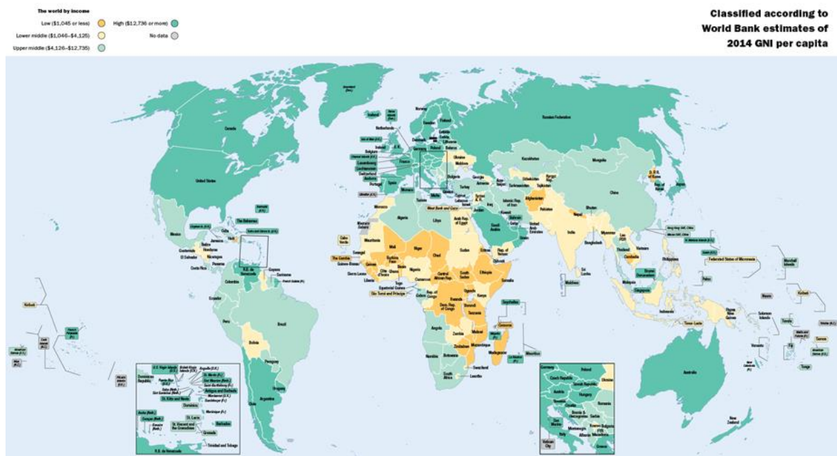
Obrázek č. 1: Klasifikace zemí podle Světové banky (World Bank 2016)

Mezinárodní měnový fond nabízí druhou možnost klasifikování států, která spočívá v rozdělování zemí do dvou skupin na základě třech pomocných kritérií. První skupinou jsou vyspělé ekonomiky a druhou skupinu tvoří vynořující se a rozvojové ekonomiky (Syróvátka – Harmáček 2014: 47–48). V roce 2015 do skupiny vyspělých ekonomik patřilo 37 zemí, a do skupiny vynořujících se a rozvojových ekonomik 152 zemí. Do této klasifikace ovšem nejsou zahrnuti všechny státy světa (International Monetary Fund 2015: 145).