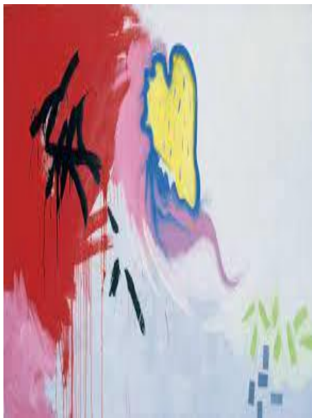
Obr. č. 3: Banalities , 1987 Milan Knížák (Knížák)

„Neosporri“ je dalším umělcovým obdobím, datující jeho tvorbu od roku 1989. V tomto období, kdy pobýval na základě uděleného soukromého stipendia v Německu, vytvořil množství děl, které odstartovaly novou etapu jeho tvorby. Podkladem pro vytvoření abstraktního obrazu byla vysoká asambláž, kterou tvořily různé předměty. Tato vrstva byla poté natřena bílou barvou, a nakonec byly nalepené předměty přemalovány ostatními barvami. Název „Neosporri“ dal této formě svého uměleckého vyjádření sám Milan Knížák, jelikož tato jeho díla se velmi podobala výtvorům švýcarského umělce rumunského původu Daniela Spoerriho.