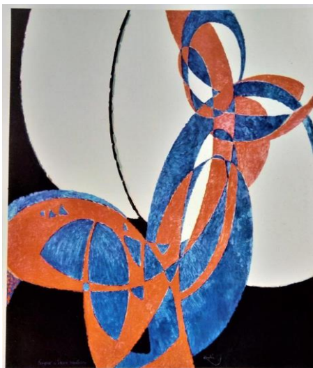
Obr. č. 9: Dvoubarevná fuga, 1912 František Kupka (Kupka)

Šamšula a Hirschová (2015) zařadili ve své publikaci kromě jiných i obraz s názvem „Dvoubarevná fuga“, který vznikl v roce 1912 jako olej na plátně. Toto dílo je vyústěním