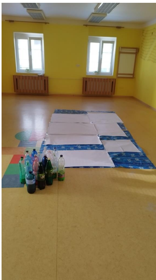
Obr. č. 11: Připravené prostředí -> gestická malba (dripping)

Tři děti mi nebyly schopny odpovědět na to, co v díle vidí, pouze konstatovaly, že to byla „dobrá zábava“. Na položenou otázku, jak na ně působila hudba a zda poznaly některé nástroje, mi odpověděly, že hudba byla rychlá a veselá. Z hudebních nástrojů většina dětí poznala housle a „píšťaly“ a skladba jim připomínala ptačí zpěv. Ostatní děti odpověděly, že hudba se jim líbila „hezky“ a další hudební nástroje si už vymýšlely podle své fantazie. Samotnou akci bych vyhodnotila jako úspěšnou, ovšem stinnou stránkou této formy umění je následný úklid. Úklid samotný mi zabral více, jak hodinu času a při dalším opakování experimentování s barvou bych volila jako místo realizace exteriér (zahrada mateřské školy).