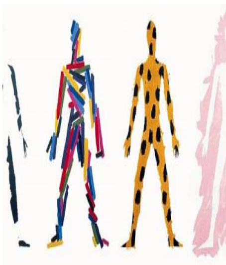
Obr. č. 2: Šaty malované na tělo, 1985 Milan Knížák (Knížák)

Dalším obdobím jsou „Banality“. Tato díla vznikala ke konci osmdesátých let, autor v nich využíval všechny prostředky abstraktního malířství dvacátého století, které se snažil cíleně zjednodušovat. Toto prováděl většinou pomocí změny měřítka (zvětšením). Jednalo se většinou o rozměrná díla velikosti 175 x 300 cm, ale výjimkou nebyl ani obraz široký deset metrů. Obrazy vznikaly tak, že autor spojoval způsoby malby z různých časových období a tvořil z nich jeden nový celek. Nad zrodem nového obrazu často dlouho přemýšlel, ale jeho samotná realizace byla velmi rychlá. Své obrazy vnímá jako dekorativní a tam, kde použil fluoreskujících barev působí, až agresivně. V pozdějších dílech jsou uplatněny i figurativní prvky a prvky asambláže. 3