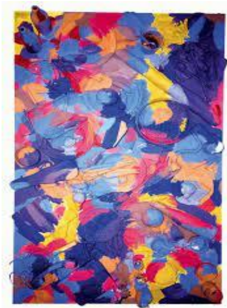
Obr. č. 4: Neosporrei, 1989 Milan Knížák

„Neosporri“ je dalším umělcovým obdobím, datující jeho tvorbu od roku 1989. V tomto období, kdy pobýval na základě uděleného soukromého stipendia v Německu, vytvořil množství děl, které odstartovaly novou etapu jeho tvorby. Podkladem pro vytvoření abstraktního obrazu byla vysoká asambláž, kterou tvořily různé předměty. Tato vrstva byla poté natřena bílou barvou, a nakonec byly nalepené předměty přemalovány ostatními barvami. Název „Neosporri“ dal této formě svého uměleckého vyjádření sám Milan Knížák, jelikož tato jeho díla se velmi podobala výtvorům švýcarského umělce rumunského původu Daniela Spoerriho.