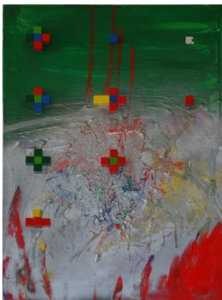
Obr. č. 5: Tachogeo, 1992 Milan Knížák (Knížák)

Posledním zmíněným obdobím Milana Knížáka je „Tachogeo“. V této době vytvořil autor sérii obrazů, které obsahovaly prvky gestické malby v kombinaci s geometrickými prvky. Geometrické prvky byly zastoupeny jednotlivými dřevěnými díly ze stavebnice určené nejmenším dětem. Jednalo se o základní trojrozměrné geometrické útvary základních barev, které umělec vlepoval do barevné plochy a tvořil z nich jednoduché ornamenty. Jindy použil namísto geometrických tvarů šachové figurky, které ale nebyly rozestavěné na šachovnici, ale byly umístěné po celé ploše abstraktního díla.