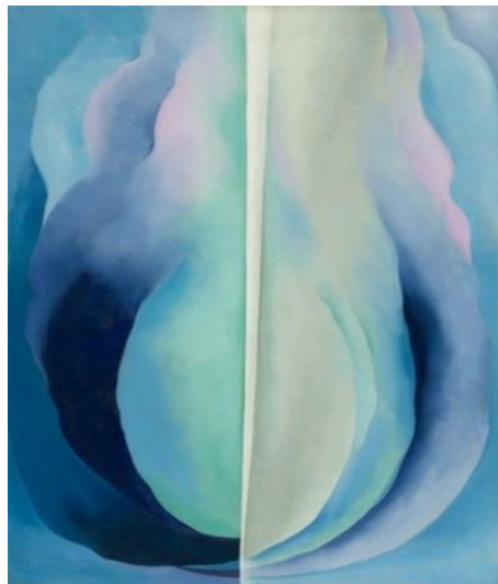
Obr. č. 6: Abstraction Blue, 1927 Georgia O' Keeffe (O'Keeffe)

Na obraze „Abstraction Blue“ převažuje modrá barva, která byla oblíbenou barvou této malířky. Dílo je tvořeno čistě modrými tahy různých odstínů umístěnými vedle sebe. Vyjadřuje svobodu, kterou autorka cítila a vyznávala.