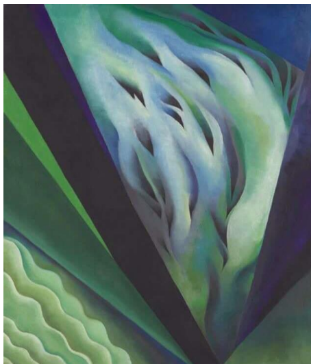
Obr. č. 8: Blue and Green Music , 1919-1921 Georgia O'Keeffe (O'Keeffe)

Olejomalba „Music Pink and Blue II“ byla vytvořena v raném tvůrčím období malířky, kdy se seznamovala a zkoumala abstrakci. Toto dílo bylo dokončeno v období, kdy Georgia O'Keeffe začínala svůj kariérní život umělce v New Yorku. Tento obraz byl rovněž s několika dalšími vystaven v prestižní newyorské Galerii 291 a tím se stala známou a uznávanou malířkou abstraktního expresionistického hnutí.