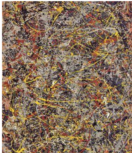
Obr. č. 1: No.5 Jackson Pollock, 1948 (Pollock)

„Potřebuji cítit, že jsem součástí malby, a skutečně se do ní pohroužit“ – Jackson Pollock (Bláha & Slavík, 1997, s. 14).