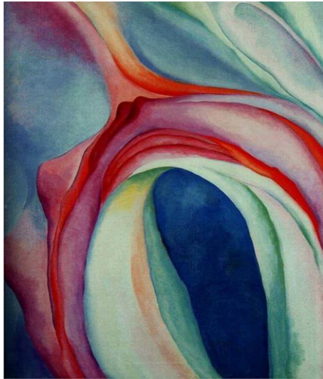
Obr. č. 7: Music Pink and Blue II , 1918 Georgia O'Keeffe (O'Keeffe)

Olejomalba „Music Pink and Blue II“ byla vytvořena v raném tvůrčím období malířky, kdy se seznamovala a zkoumala abstrakci. Toto dílo bylo dokončeno v období, kdy Georgia O'Keeffe začínala svůj kariérní život umělce v New Yorku. Tento obraz byl rovněž s několika dalšími vystaven v prestižní newyorské Galerii 291 a tím se stala známou a uznávanou malířkou abstraktního expresionistického hnutí.