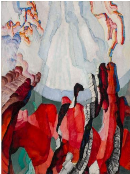
Obr. č. 10: Tvoření (Stvoření), 1911-1920 František Kupka (Kupka)