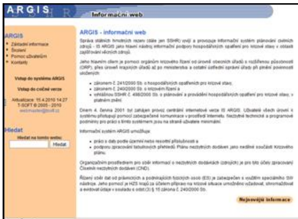
Obr. č. 1: stránka programu ARGIS