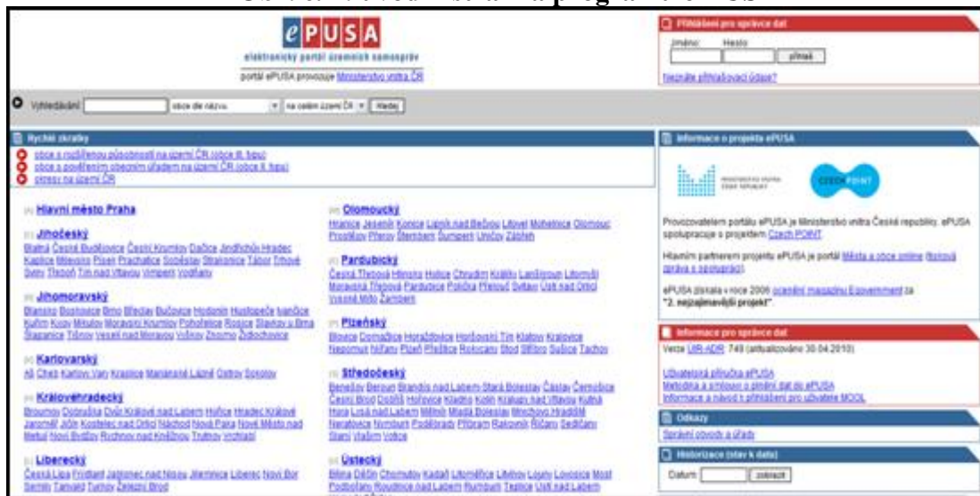
Obr. č. 2: úvodní stránka programu e-PUSA

Úvodní stránka portálu zobrazuje rozvržení podle krajů ČR spolu s odkazy (zkratkami) přímo na větší města daného kraje. Popisky: vyhledávání nahoře, rychlé zkratky těsně pod, zkratka kraje vlevo, správní obvody a úřady, sekce odkazy. V každém momentě navigace je v horní části stránky formulář pro vyhledávání obce, subjektu či zřizované organizace podle názvu, nebo osoby podle jména na území celé ČR nebo na aktuálně zvoleném území. K dispozici jsou taktéž tzv. rychlé zkratky, které umožňují přeskakovat jednotlivé úrovně vypisování a umožňují např. výpis všech okresů na území ČR bez potřeby výběru kraje.