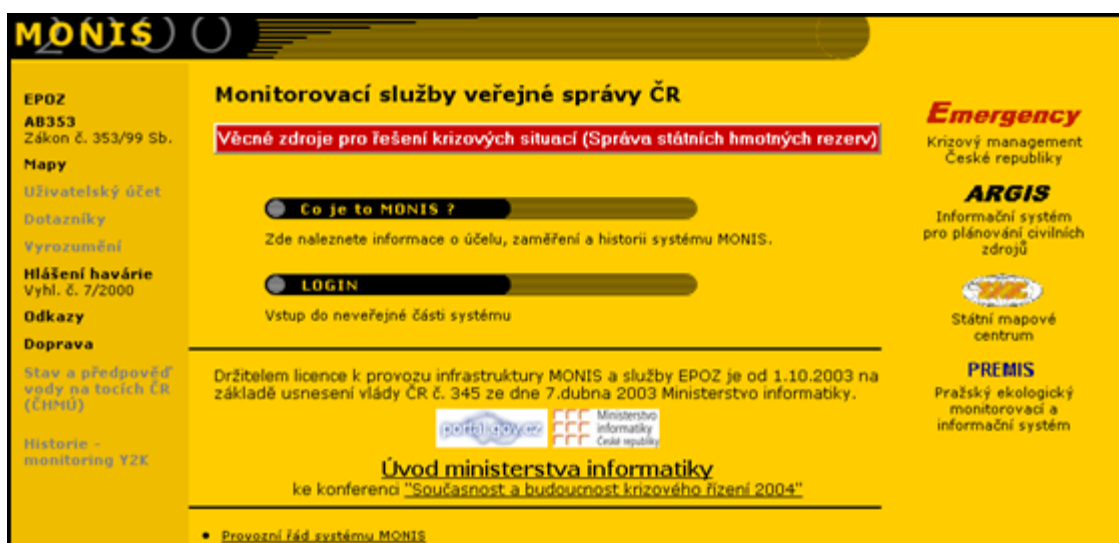
Obr. č. 3: úvodní stránka programu MONIS