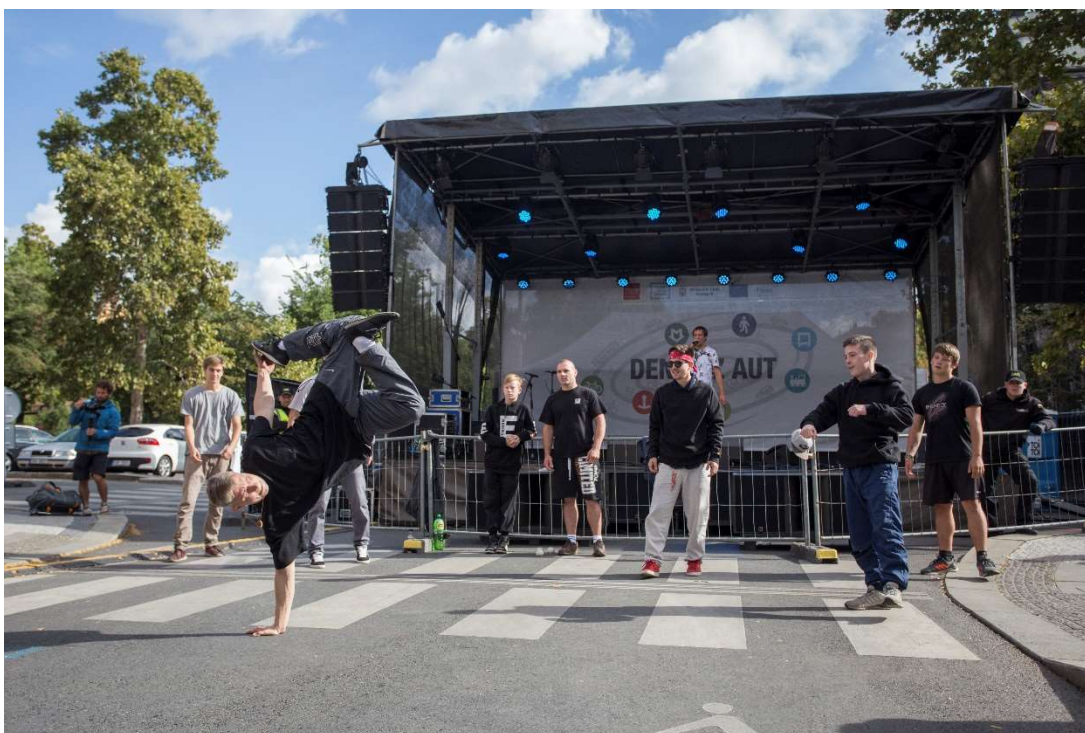
Obrázek 1 - Hlavní pódium akce "Den bez aut"

Dílčí akce české odnože této celoevropské iniciativy – Den bez aut je pak tradičně pořádána 22. září a má za cíl poukázat na přijatelnější způsoby dopravy a podpořit omezování městského automobilismu. V Česku se tento den slaví od roku 1991 89 , přičemž od roku 2002 se stal součástí Evropského týdne mobility. V Česku je podle webových stránek Evropské komise do akce zapojeno několik stovek měst, mezi něž patří například Praha, Hradec Králové či Jihlava. 90