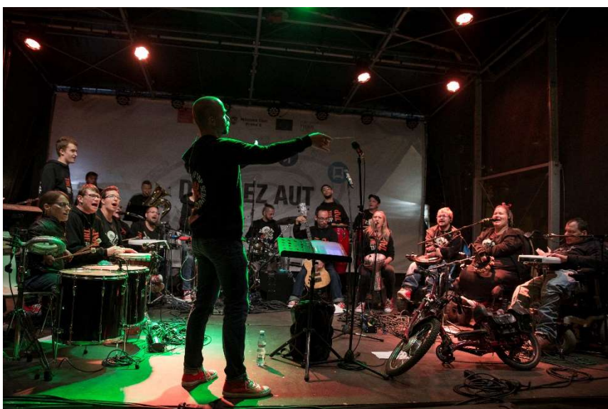
Obrázek 10 - vystoupení kapely The Tap Tap

Pro potřeby analýzy bohužel není k dispozici konkrétní smlouva mezi pořadatelem a umělcem z posuzované akce, ale příkladem ilustrujícím problematiku může být rozbor vystoupení „hřebu večera“, kapely The Tap Tap (obr. 10). Jedná se o kapelu studentů a absolventů školy Jedličkova ústavu, která je na hudební scéně ČR ojedinělým hudebním seskupením a během 16 let své existence mnohokrát úspěšně reprezentovala ČR i v zahraničí. Na akci Den bez aut 2018 měla kapela The Tap Tap na závěr večera přibližně hodinu dlouhé vystoupení.