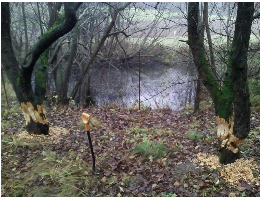
Fotografie 12: Značná neprostupnost území v době vegetace (foto František Bureš, 10/2013)