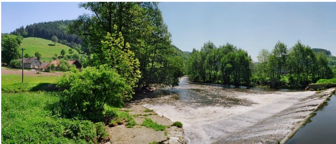
Fotografie 2: Pohled na zájmové území