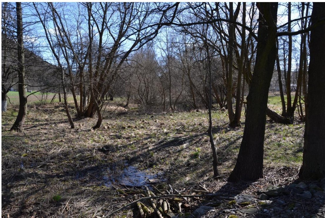
Fotografie 8: Neprůtočná tůňka v mokřadní části (foto František Bureš, 3/2017)