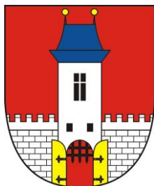
Obrázek č. 1: Znak města Hořice