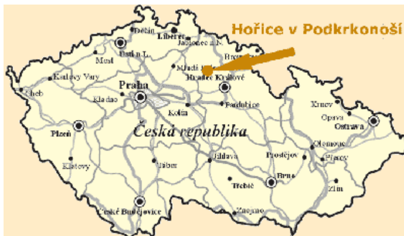
Obrázek č.2 : Mapa