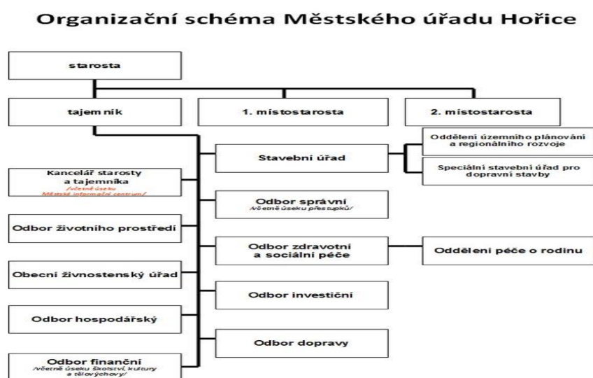
Obrázek č.7 Organizační schéma Městského úřadu Hořice, zdroj:

Do textu přikládám obrázek organizačního schématu Městského úřadu, abychom měli představu, jaké odbory se zde nacházejí.