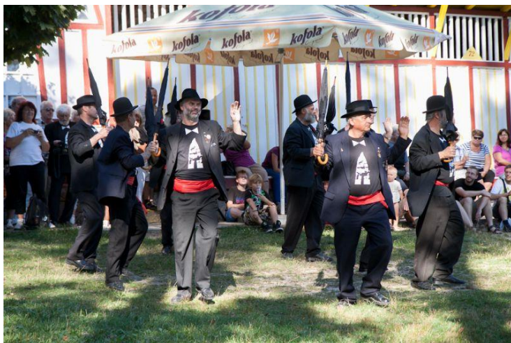
Obrázek č.4 ARTrosa

V roce 2006 se zrodil nápad vytvořit obdobu mažoretkové skupiny z postarších pánů, kteří si dali název ART rosa. Zřejmě nikdo z nich nečekal, že takzvaní mužoreti by mohli vystupovat na stovce nejrůznějších míst, jak v České Republice, tak i v zahraničí. Původně tento nápad byl vymyšlen jen pro příležitost odhalení sochy na výstavě v Hořicích. Nikdo z mužoretů však nečekal, jak se jejich nápad ujme. Název není myšlen jako nemoc, ačkoli pár členů artrózou trpí, byl myšlen jako slovní spojení umění a růže.