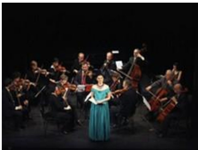
Obrázek č.3 Hořický komorní orchestr