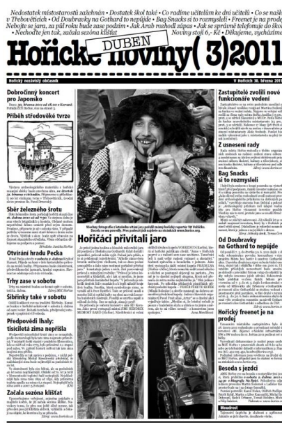
Obrázek č.8 Hořické noviny

„Noviny si teda sám nekupuju, ale občas si je přečtu u babičky. No občas si říkám, že ještě pořád vycházej, když stojej jen 6 korun, ale lidi je asi pořád kupujou a dokud je podle mě kupovat budou, tak budou i vycházet.“ (M 25)