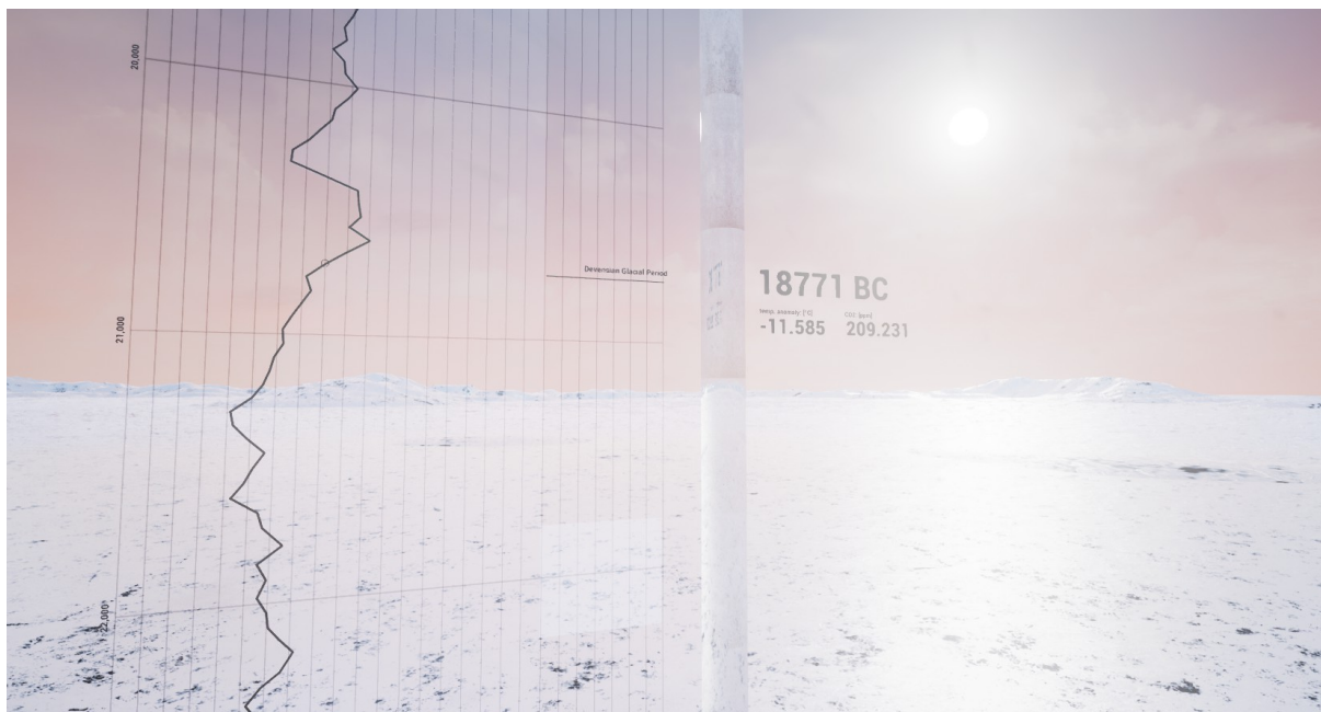
Screenshot „Ice Core Project“