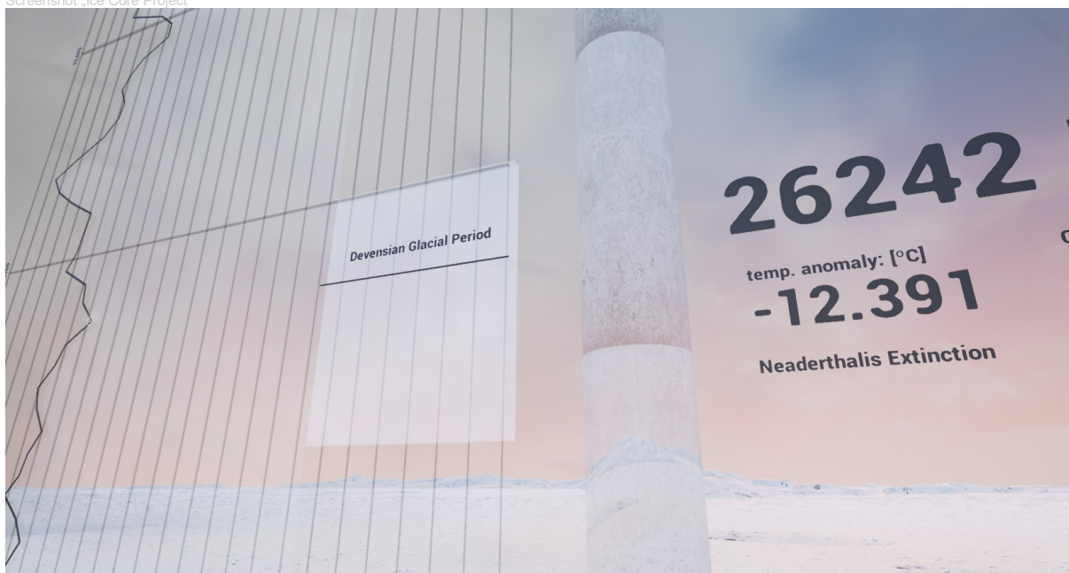
Screenshot „Ice Core Project“

Download will available at the day of presentation here: