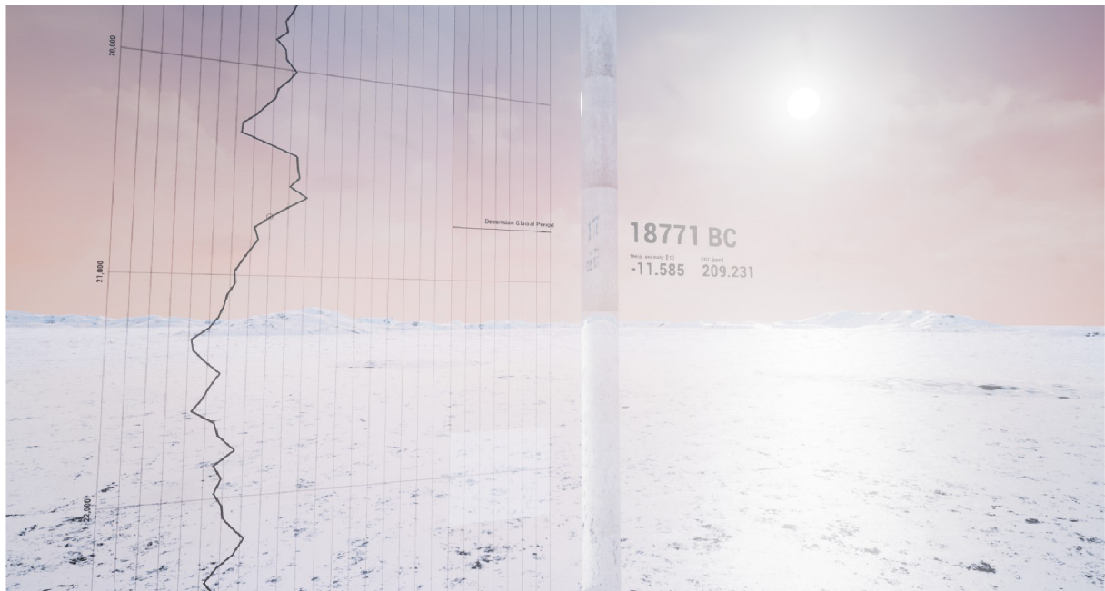
Screenshot „Ice Core Project“