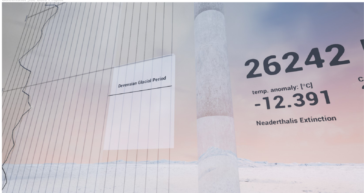
Screenshot „Ice Core Project“

Download will available at the day of presentation here: