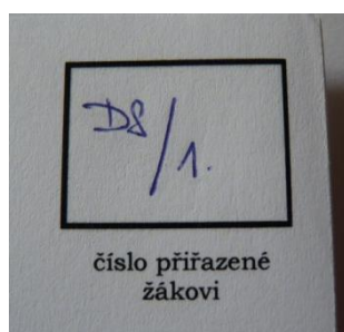
Obrázek 1 – Identifikační kód dotazníku

Pro správné spárování dotazníků a zachování anonymity účastníků výzkumu byly použity místo jmen identifikační kódy. Každému žákovi byl přiřazen identifikační kód ve formě písmena a dvou čísel (např. D8/1. – škola D, osmá třída a první žák ve školním výkazu).