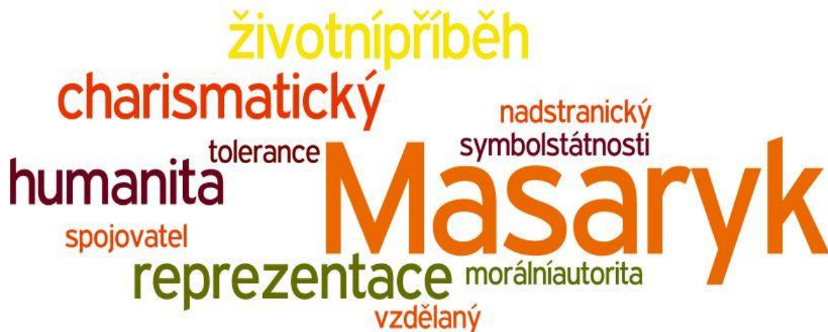
Obrázek 2: Shoda nad představou prezidenta v rámci pojmů

Pozn.: Obrázek zobrazuje pojmy okolo představy prezidenta, vůči nimž panuje všeobecná shoda mezi komunikačními partnery. Čím je text daného pojmu výraznější, tím byl pojem významnější pro jednotlivé komunikační partnery. Rozložení a podoba barev má čistě náhodný charakter. N = 11.