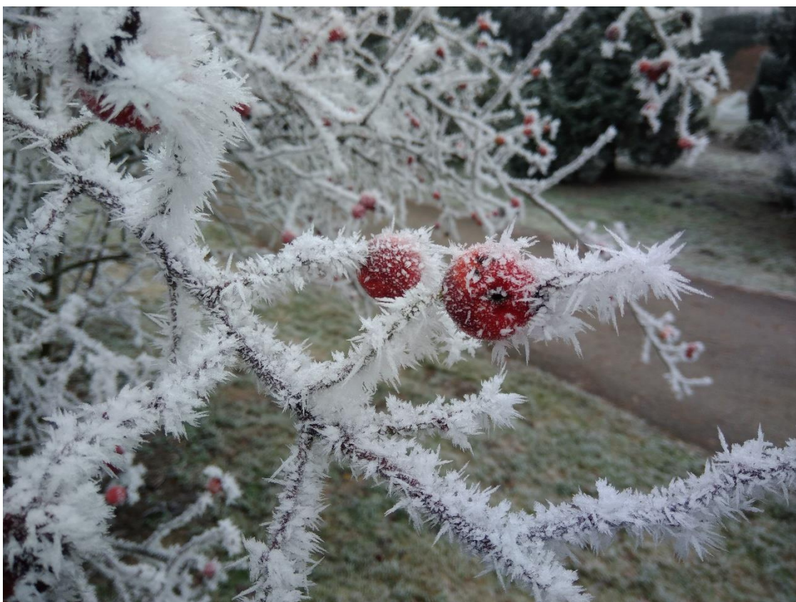
Obr. 15. Plod růže galské ( Rosa Gallica ) v zimě (Dvořáková, leden 2020)