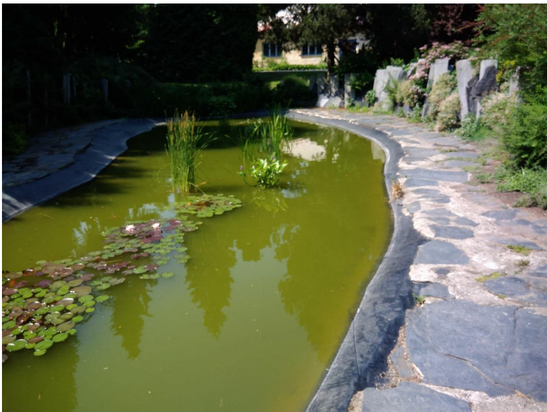
Obr. 4. Jezírko v Brněnské zahradě (Dvořáková, duben 2018)