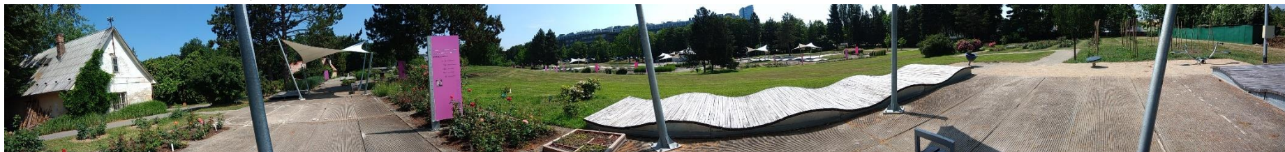
Obr. 7. Panoramatický snímek rozária zleva/ze severu doprava/na jih (Dvořáková, duben 2018)