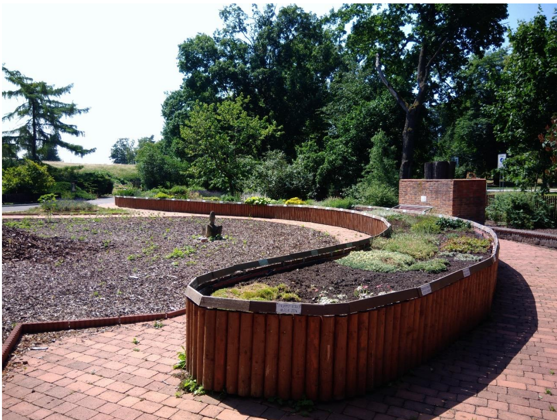
Obr. 6. Vyvýšený záhon v Zahradě smyslů (Dvořáková, duben 2018)