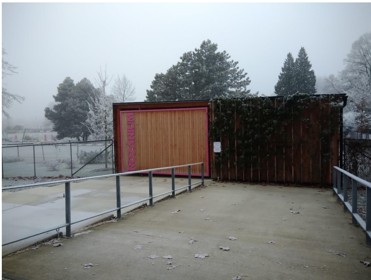
Obr. 2. Zavřený vstup do rozária z ulice 17. listopadu (Dvořáková, leden 2020)