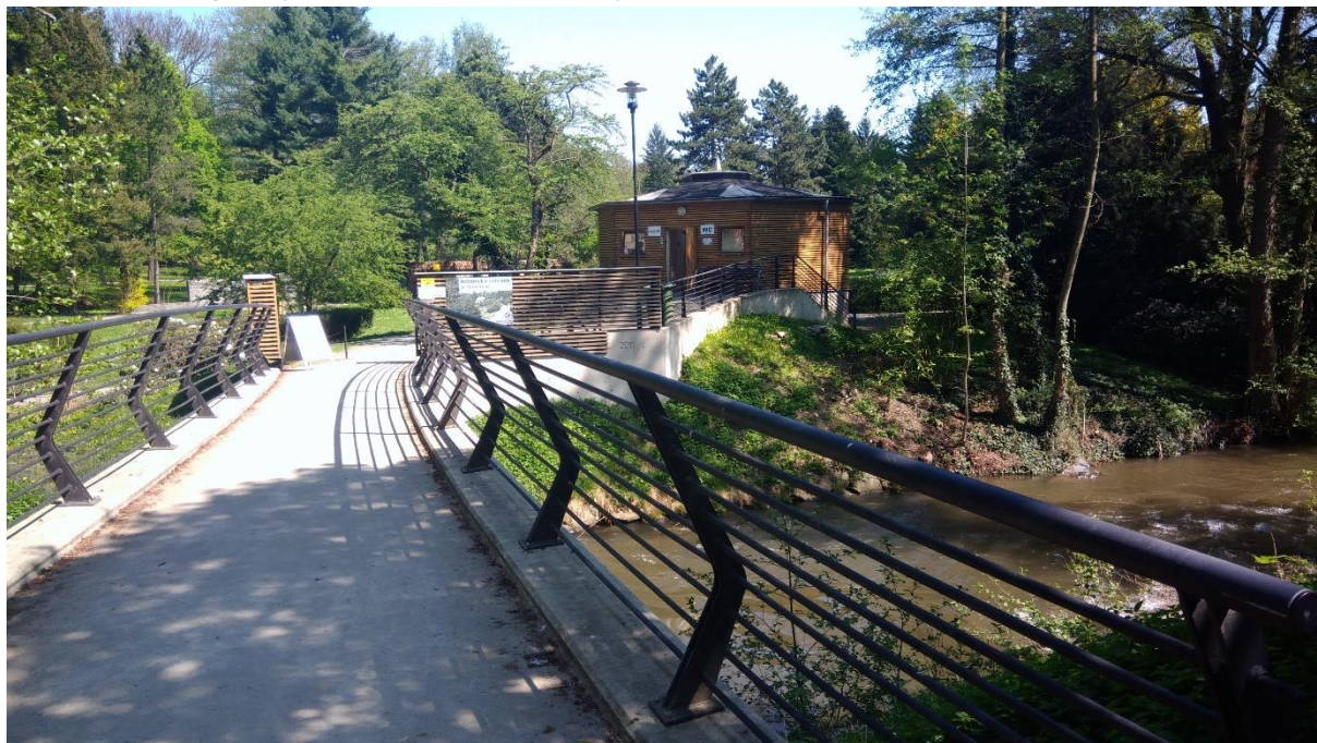
Obr. 1. Vstupní budova při příchodu z Bezručových sadů