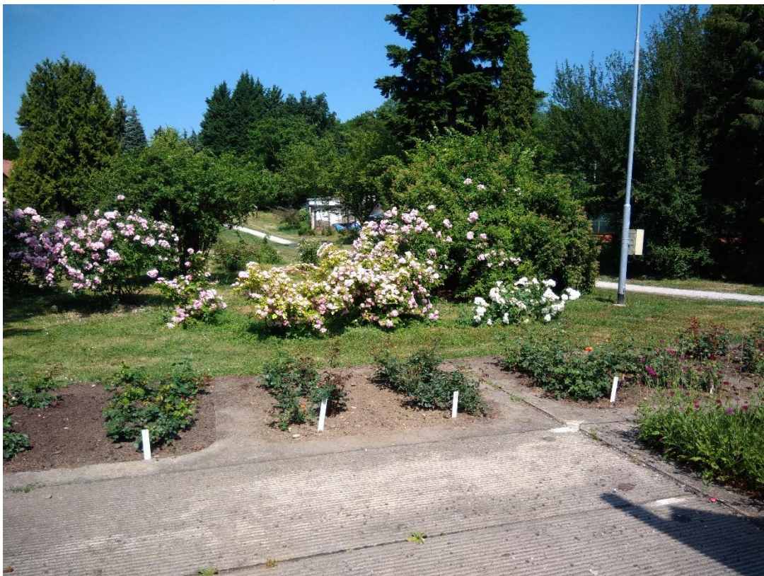
Obr. 3. Rozkvetlé rozárium (Dvořáková, duben 2018)