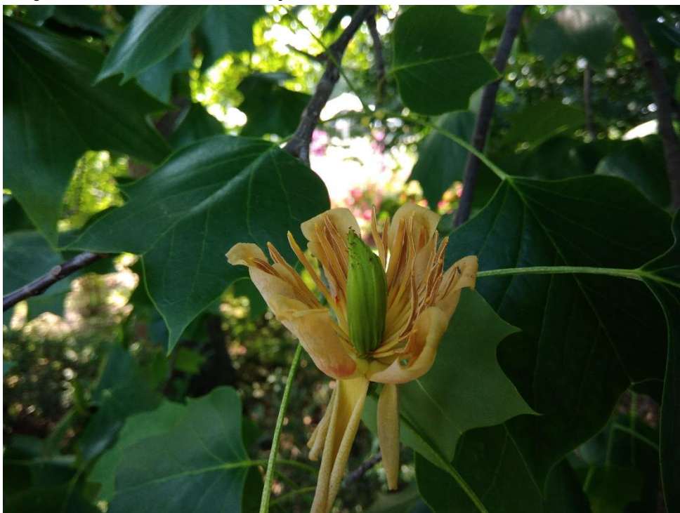
Obr. 10. Květ liliovníku tulipánokvětého ( Liriodendron tulipifera ) v Gruzínské zahradě (Dvořáková, duben 2018)