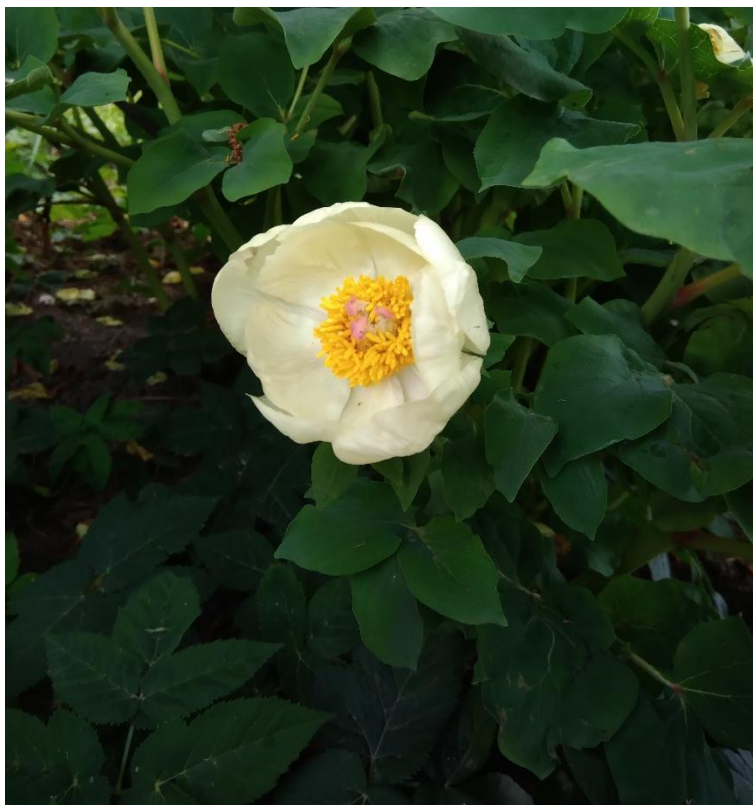
Obr. 11. Květ pivoňky mlokosewičovy ( Peonia mlokosewitschii ) v Gruzínské zahradě (Dvořáková, duben 2018)