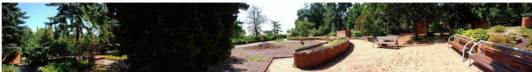
Obr. 8. Panoramatický snímek Zahrady smyslů zleva/ze severu doprava/na západ (Dvořáková, duben 2018)