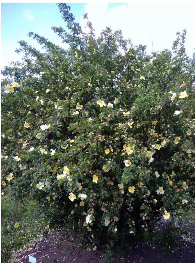
Obr. 13. Keřová růže Hugova ( Rosa hugonis ) v květu (Dvořáková, duben 2018)