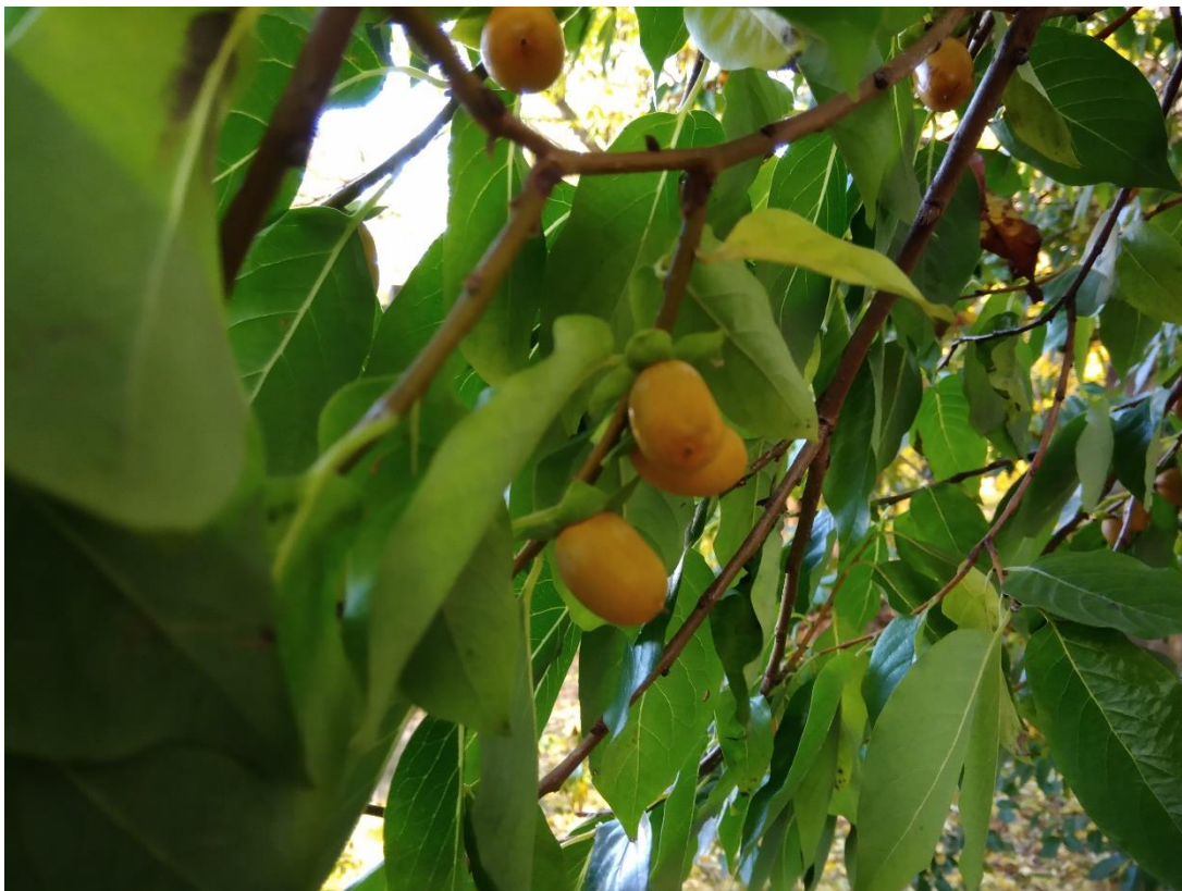
Obr. 14. Plody tomelu obecného ( Diospyros lotus ) (Dvořáková, říjen 2019)