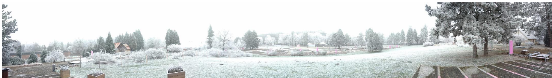
Obr. 9. Panoramatický snímek rozária zleva/ze severu doprava/na jih (Dvořáková, leden 2020)