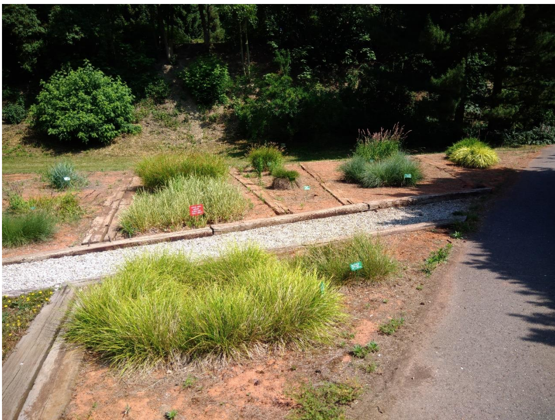
Obr. 5. Záhony v expozici travin (Dvořáková, duben 2018)