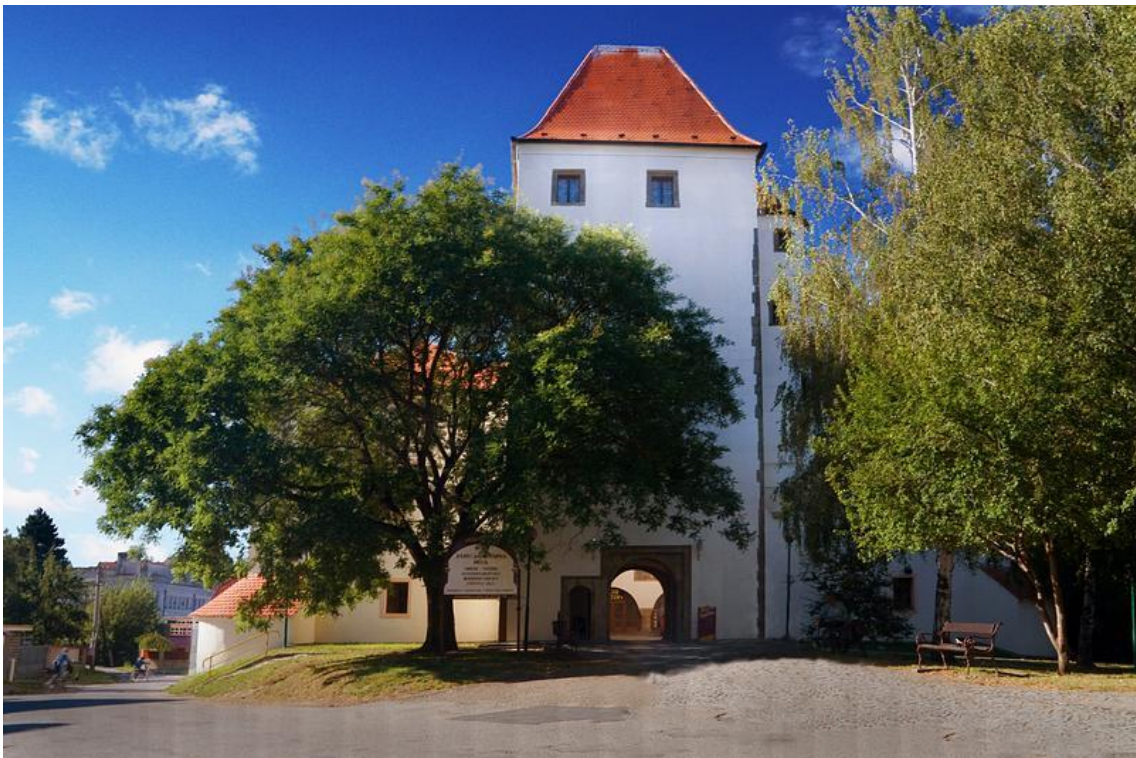
Aktuální podoba tvrže v Hluku. ( http://www.vychodni-morava.cz/sluzba/8979 )