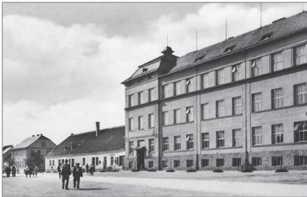
Nová škola v roce 1930 těsně před otevřením. (BŘEČKA, Jan a Jiří MITÁČEK. Hluk: dějiny města . s. 298)