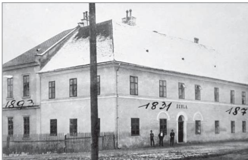
Stará škola s vyznačenými roky stavby jednotlivých částí. (BŘEČKA, Jan a Jiří MITÁČEK. Hluk: dějiny města . s. 249)