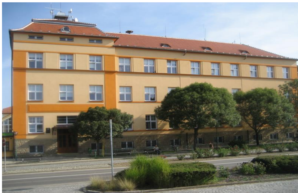
Nová škola před rekonstrukcí náměstí. ( http://www.zshluk.cz/ )