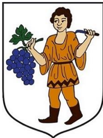
Současný znak města Hluk. ( http://www.mestohluk.cz/ )