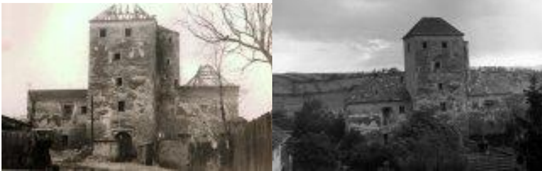
Tvrz ve 20. století před rekonstrukcí. ( http://kronikahluk.cz/index.php?id=hlucka-tvrz-a-jeji-djiny )