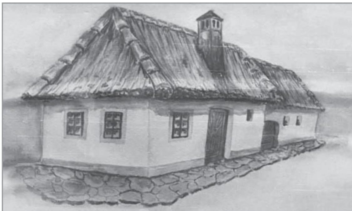
Obráz domku č. p. 48 z roku 1781.