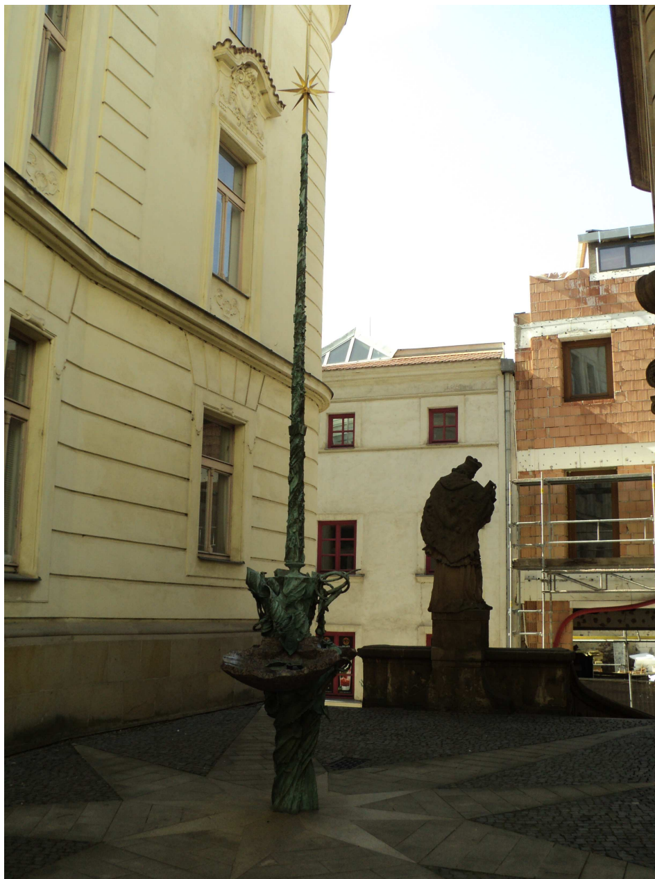
Obrázek 2 Pramen živé vody svatého Jana Sarkandera od sochaře Otmara Olivy.