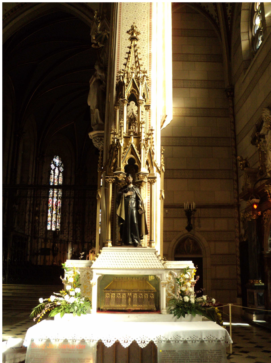
Obrázek 5 Boční oltář svatého Jana Sarkandera s ostatky v lodi katedrály svatého Václava v Olomouci.