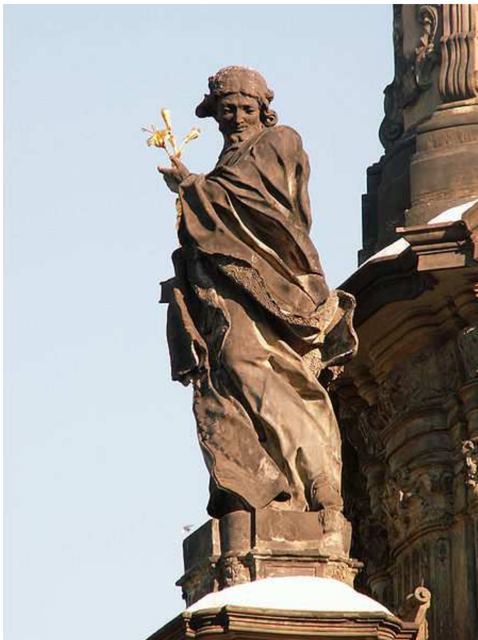
Obrázek 6 Socha sv. Jana Sarkandera na Sloupu Nejsvětější Trojice v Olomouci.