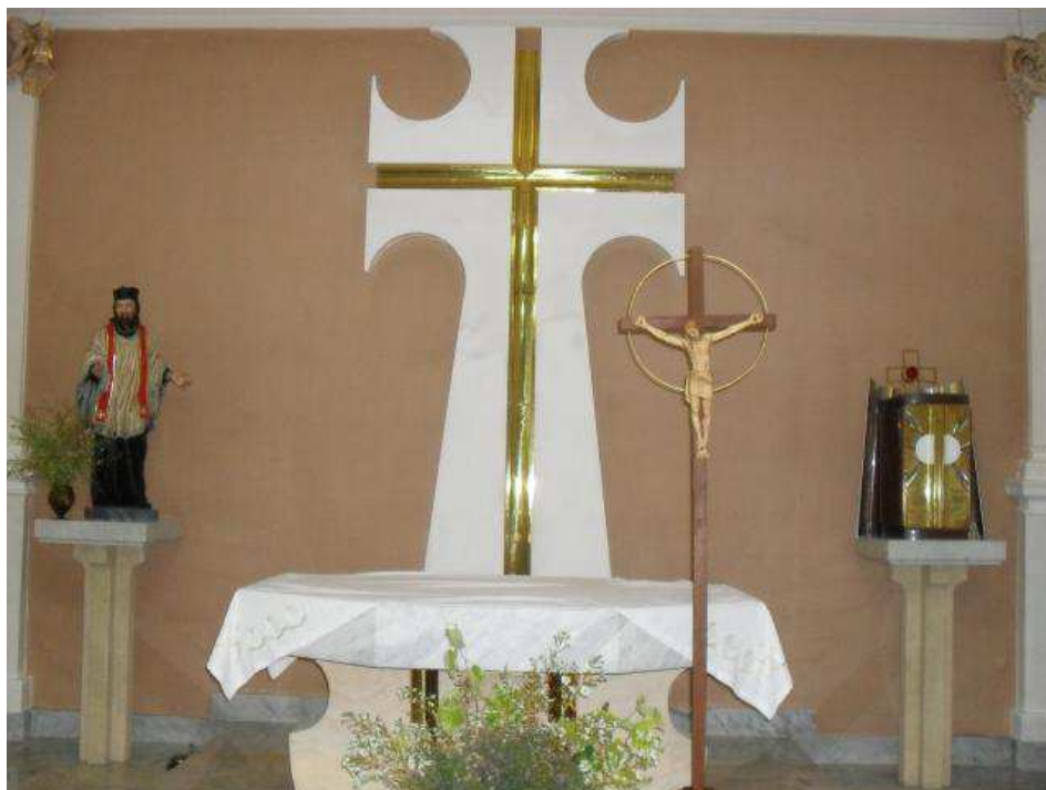
Obrázek 9 Kaple sv. Jana Sarkandera v budově Arcibiskupského kněžského semináře v Olomouci.