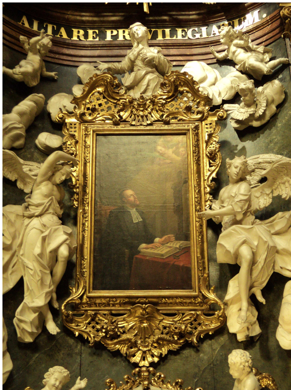
Obrázek 4 Oltářní obraz s vyobrazením svatého Jana Sarkandra na bočním oltáři v kostele sv. Michala v Olomouci.