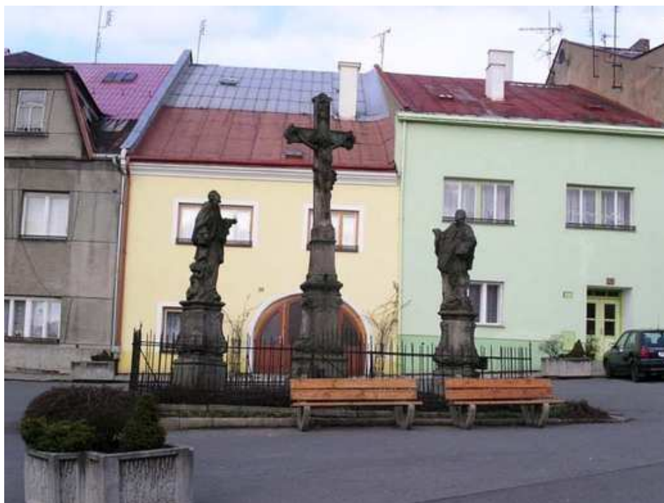
Obrázek 8 Sochy svatých Jana Nepomuckého a Jana Sarkandera (vpravo) s ukřižovaným Kristem uprostřed na Bočkově náměstí v Potštátě.