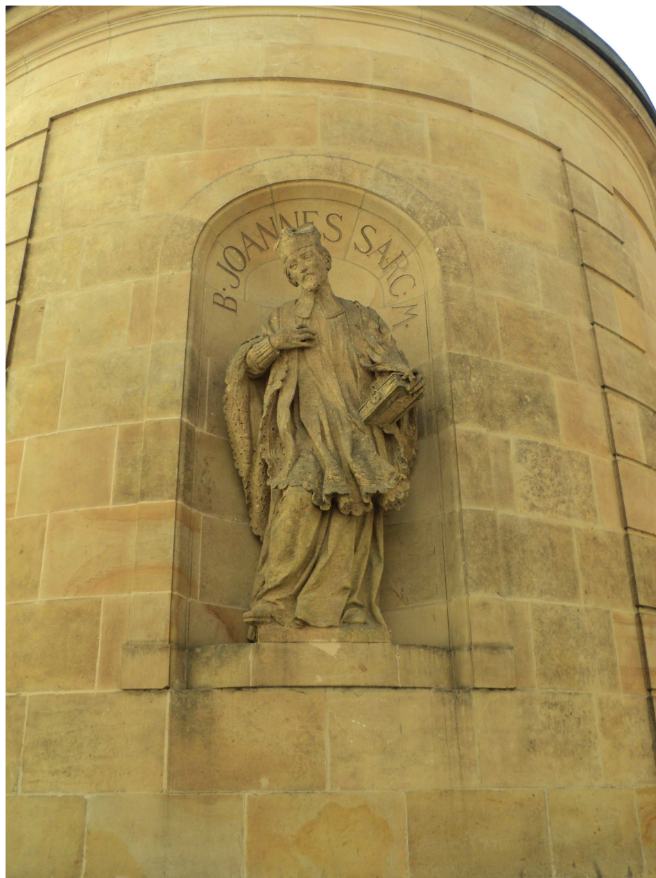
Obrázek 3 Socha svatého Jana Sarkandera na presbyteriální straně kaple. Pohled z Universitní ulice.