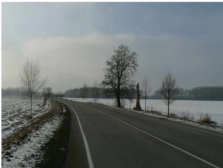
Obrázek 7 Socha svatého Jana Sarkandera v místě, kde byl Sarkander zajat, u obce Troubky.