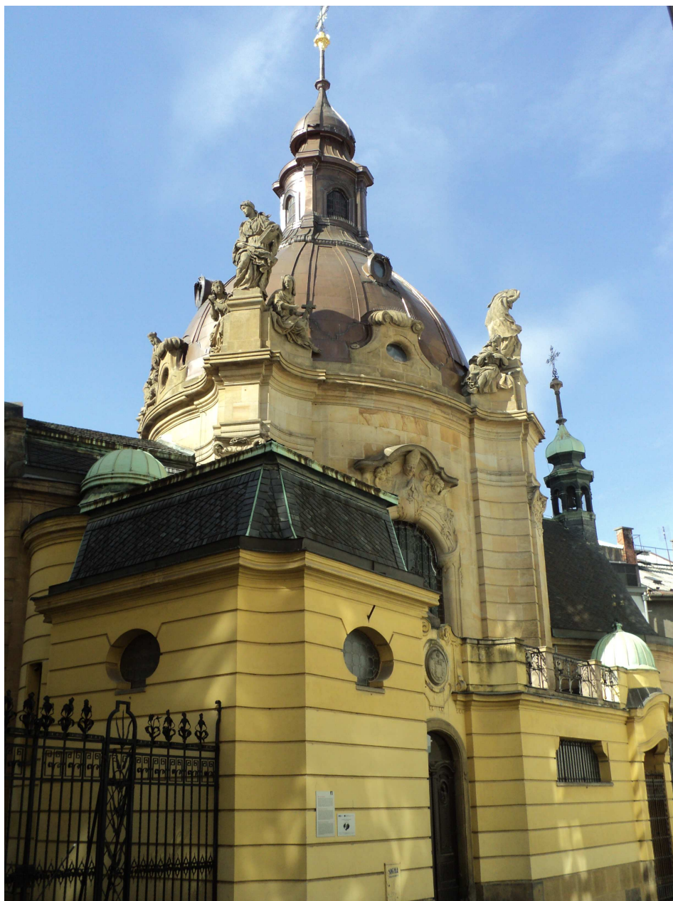
Obrázek 1 Kaple svatého Jana Sarkandra v Olomouci, zvaná „Sarkandrovka“.