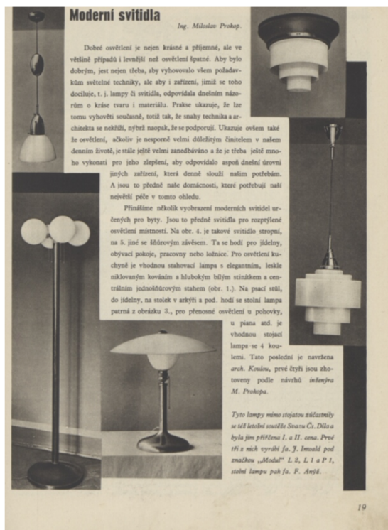
5. Ukázka prezentace nových svítidel, Eva.