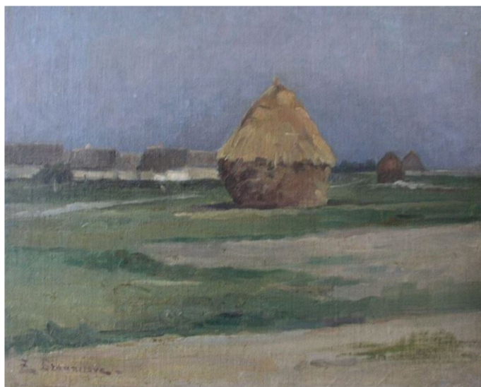
14. Zdenka Braunerová, Kupy sena za humny , po 1900.