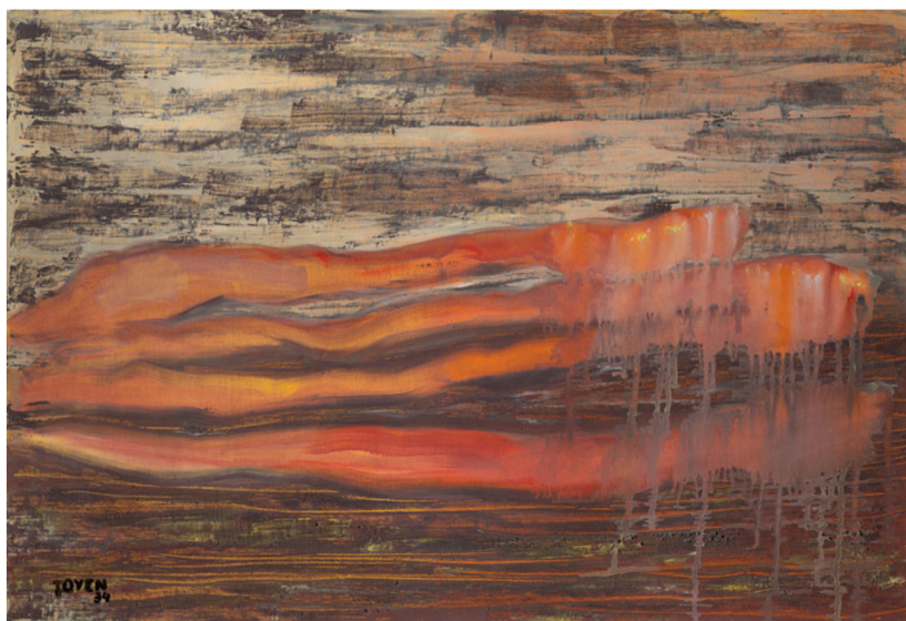
12. Toyen, Stisk ruky , 1934.