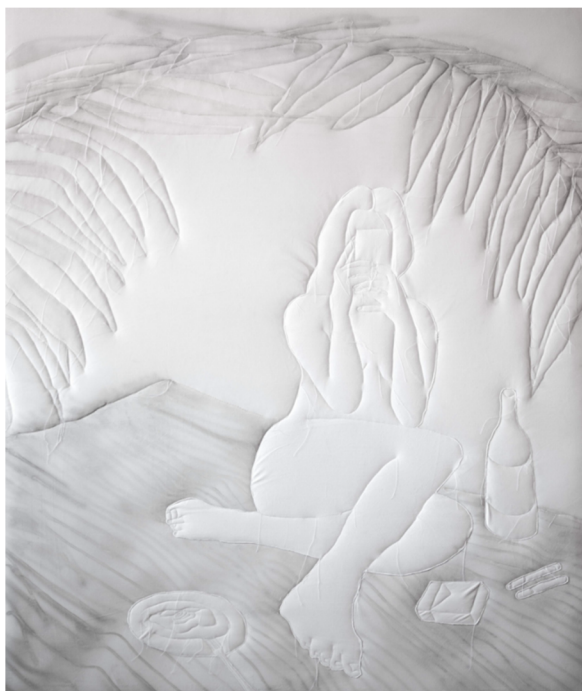
24. Lucie Rosická, Picnic in parco Valentino – Girls diner , 2023.