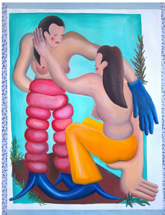
27. Antonie Zichová, Bez názvu , 2023.