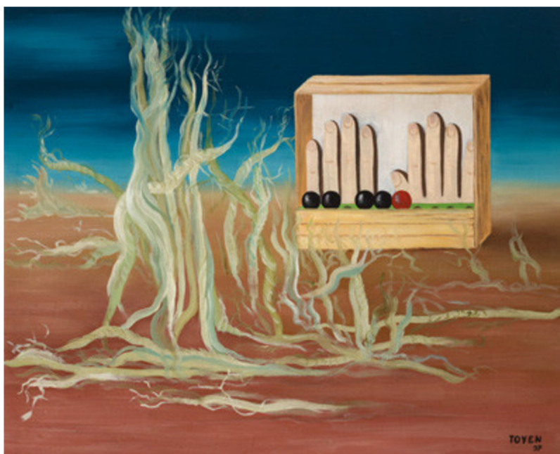
13. Toyen, Ospalé území , 1937.