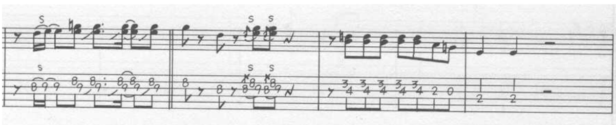
Obrázek 1: Str. 126 (předehra)

Skladba Boys je charakteristická svým energickým zvukem. Začíná jednoduchým, ale chytlavým kytarovým riffem, který tvoří základní melodický a rytmický prvek. Je také obohacena o předeheru a krátké kytarové sólo, které má typickou strukturu rock'n'rollové hudby. V posledních třech taktech dochází ke gradaci, což dodává skladbě na intenzitě. Předehra je rovněž charakteristická pro hudební styl, ze kterého skladba čerpá.