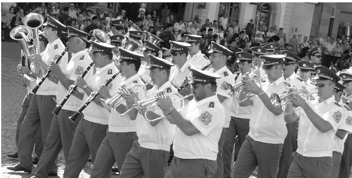
Posádková hudba Olomouc v roce 2005

zdroj: http://cs.wikipedia.org/wiki/Vojensk%C3%A1_hudba_Olomouc (staženo 25. 2. 2012)