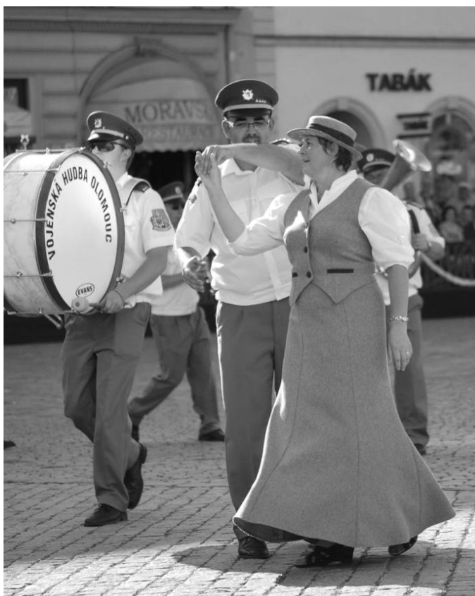
Vojenská hudba Olomouc při showprogramu v rámci „Oslav maršála Radeckého“ na Horním náměstí v Olomouci dne 3. 9. 2011