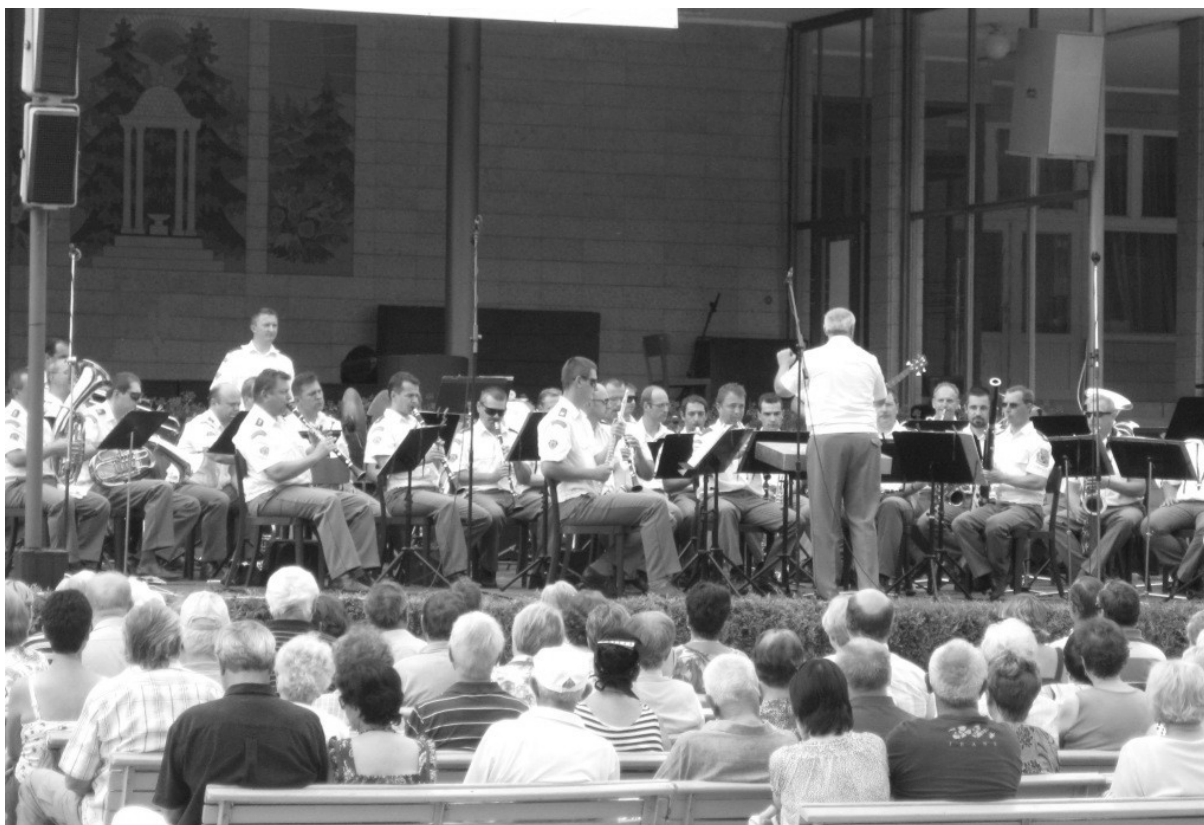
Promenádní koncert na kolonádě v Luhačovicích 9. 6. 2010