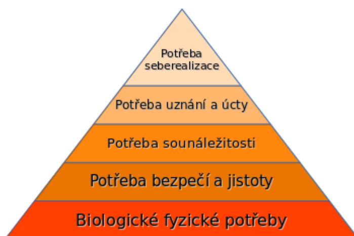
Obrázek č. 1 Maslowova pyramida potřeb

Maslowova pyramida tvoří pět pater, přičemž předpokladem pro uspokojení potřeb vyšších, je uspokojení těch na nižším stupni.