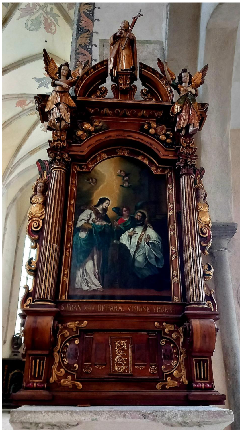
Obr. 3 Oltář svatého Františka Xaverského z roku 1642, jenž se původně nacházel v řádovém kostele svaté Máří Magdalény, nyní umístěn v kostele svatého Jana Křtitele.