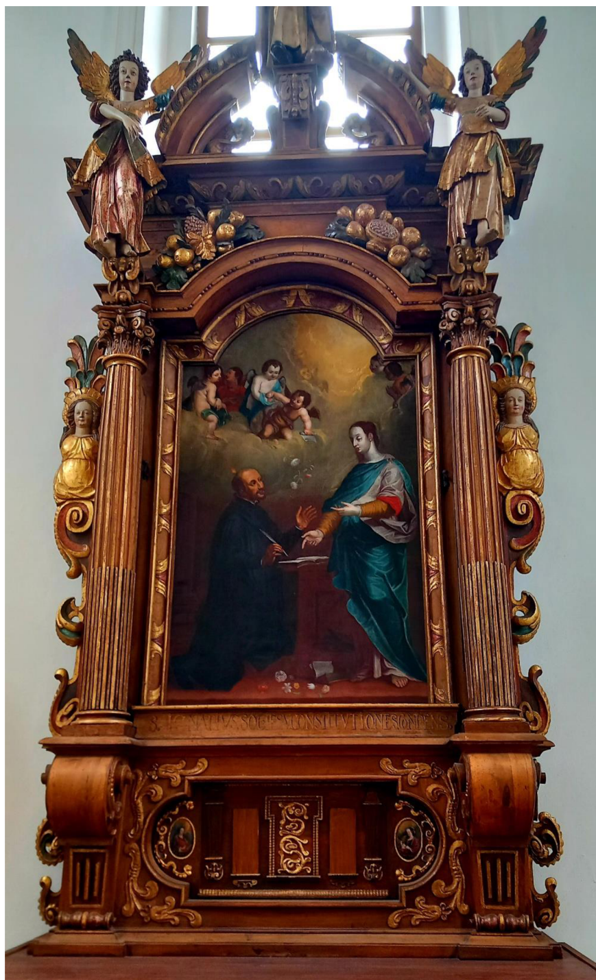
Obr. 1 Oltář svatého Ignáce z Loyoly z roku 1625, který byl původně umístěn v řádovém kostele svatě Máří Magdalény, nyní umístěn v bývalém minoritském klášteře a kostele svatého Jana Křtitele.