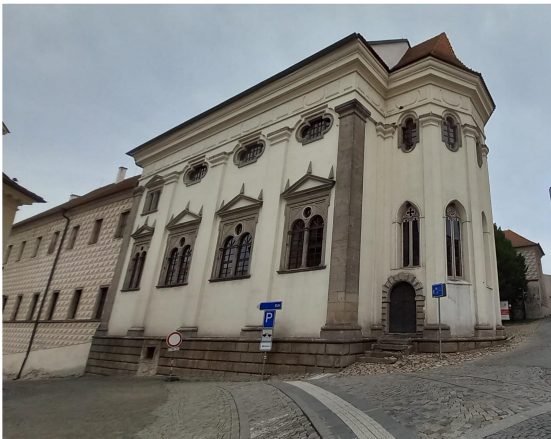
Obr. 10 Bývalý jezuitský kostel svaté Máří Magdalény.