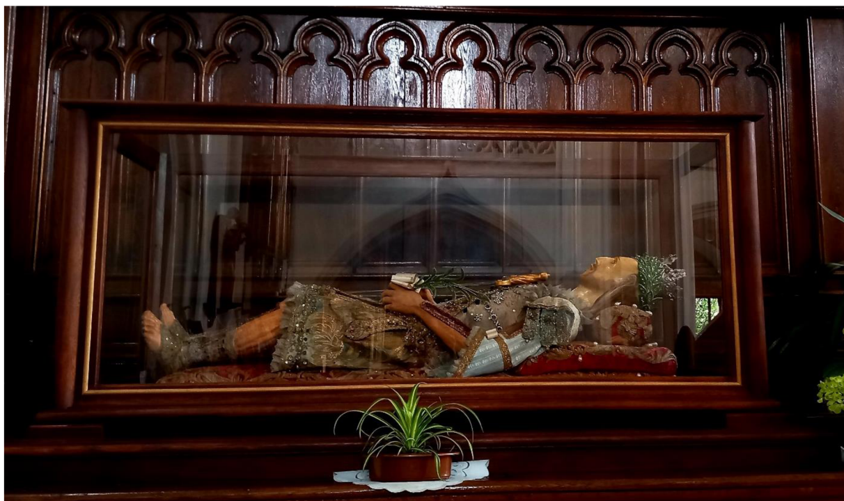
Obr. 5 Barokní relikviář s ostatky svatého Hippolyta z přelomu 17. a 18. století, který je nyní uložen v proboštském chrámu Nanebevzetí Panny Marie.