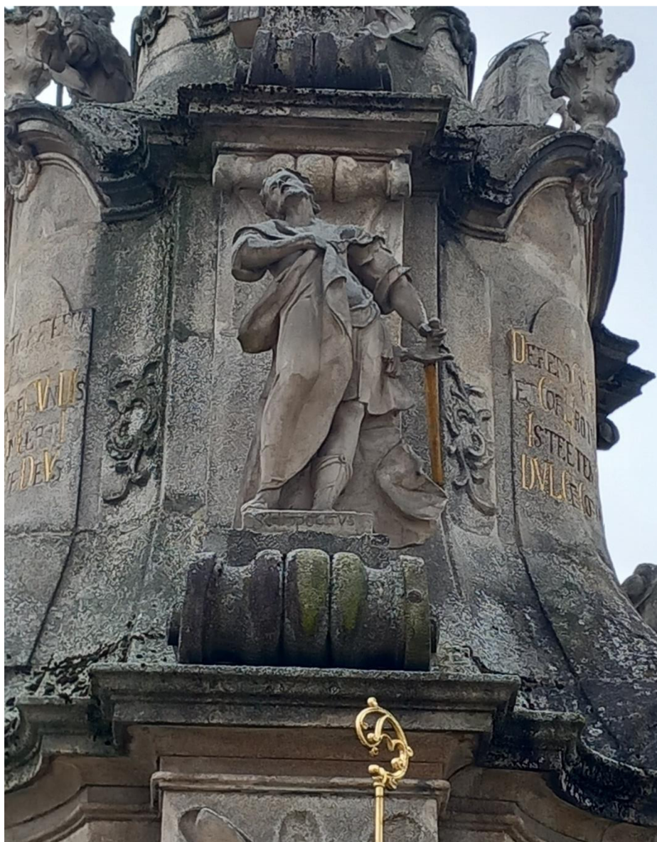
Obr. 8 Socha svatého Hippolyta na sloupu Nejsvětější Trojice vybudovaného v letech 1761 až 1766, který se nachází na náměstí Míru v Jindřichově Hradci.