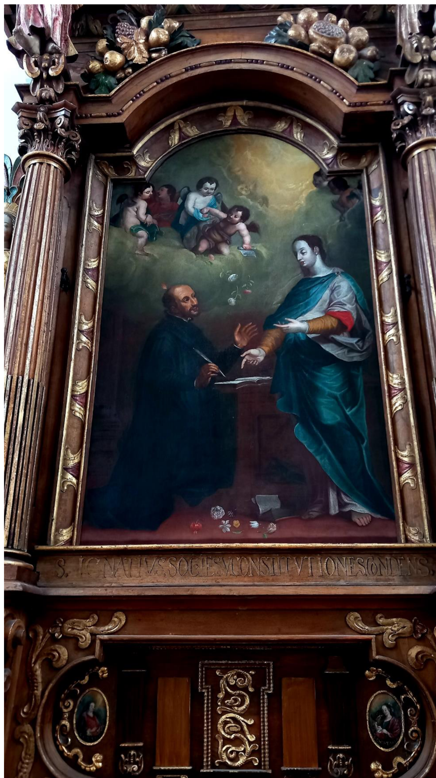
Obr. 2 Detail oltářního obrazu svatého Ignáce z Loyoly.