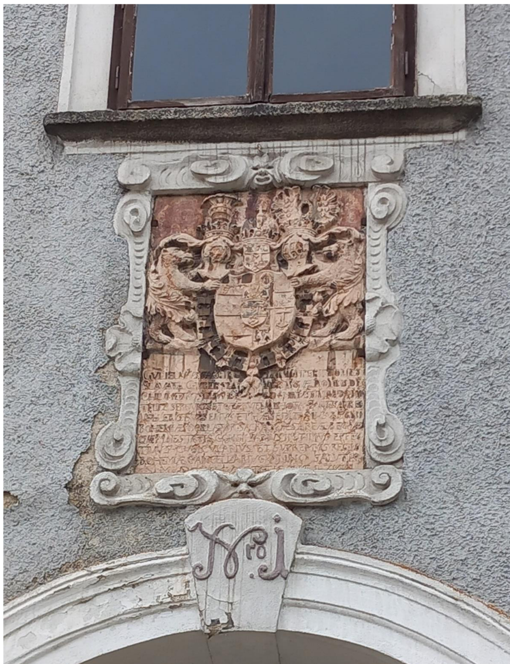
Obr. 9 Slavatovský erb na fasádě zámku v Jindřichově Hradci.