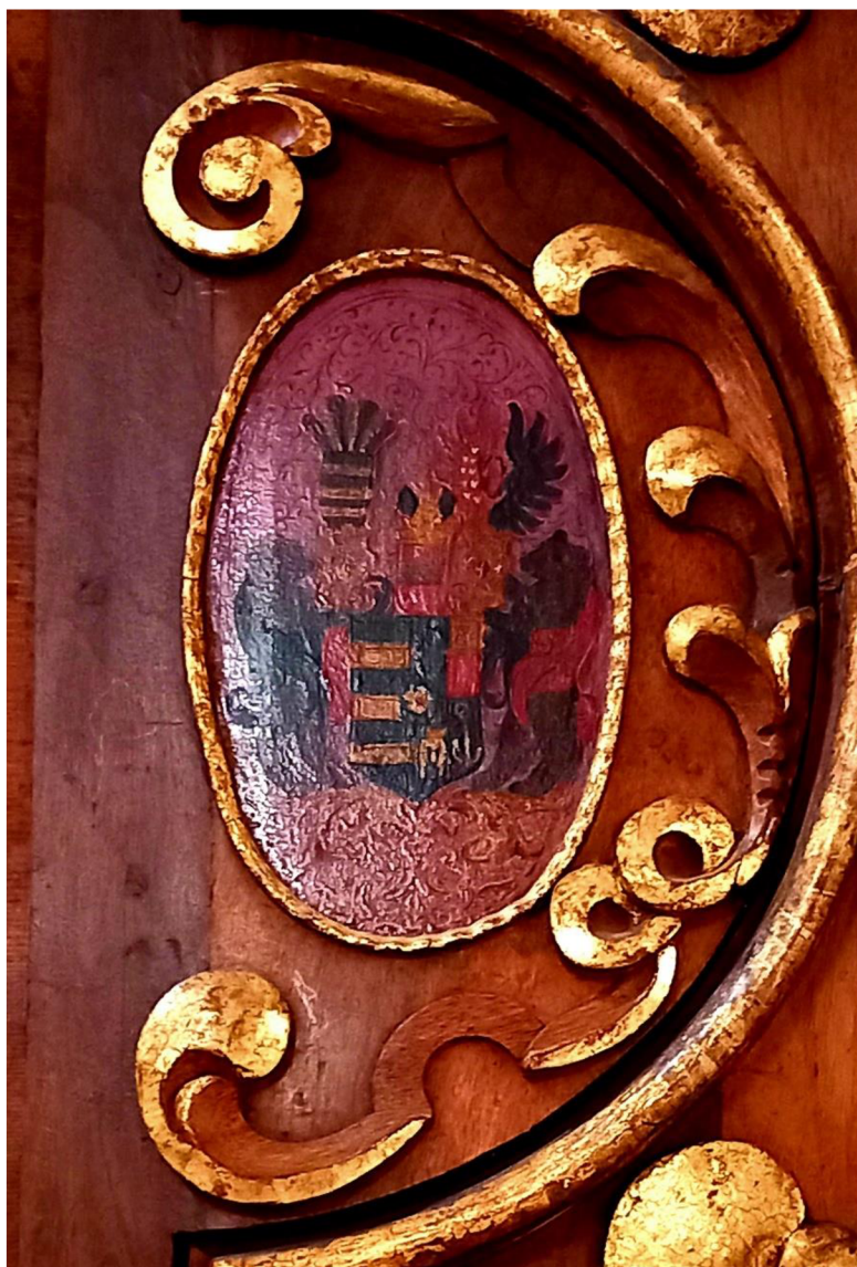
Obr. 4 Detail z oltáře svatého Františka Xaverského s erbem Viléma Slavaty.