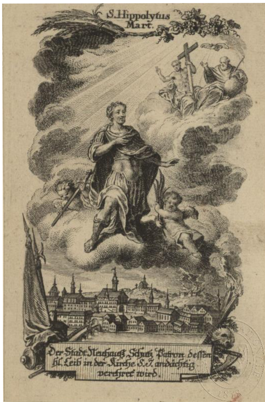
Obr. 6 Grafika od Jana Antonina Mansfelda pocházející z první poloviny 18. století, grafika zobrazuje svatého Hippolyta, patrona Jindřichova Hradce.