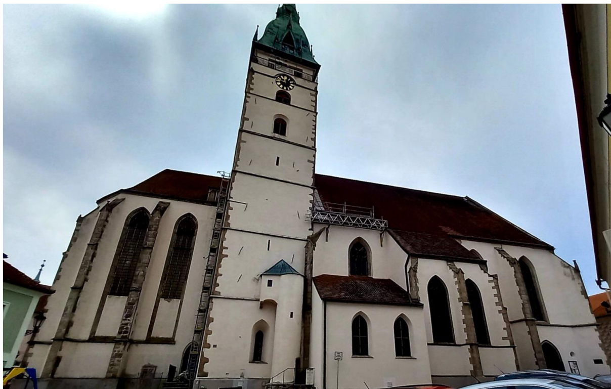
Obr. 11 Proboštský kostel Nanebevzetí Panny Marie.