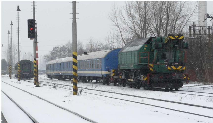
Obrázek 4 Nehodový železniční vlak – železniční jeřáb.

Nehodová pohotovost je služba, která je koordinována Českými drahami. Jedná se o tým složený ze speciálně vyškolených zaměstnanců, jejichž hlavním posláním je poskytovat pomoc a podporu zaměstnancům a dalším orgánům, které zabezpečují bezpečnost na železnici v případě nehody nebo mimořádných událostí na železnici. Nehodová pohotovost pracuje v úzké spolupráci se zaměstnanci HZS SŽ při řešení mimořádných událostí, které jsou svým charakterem a rozsahem obtížně zdolatelné. Nehodová pohotovost je využívána v širokém spektru událostí na železnici, avšak v rámci zásahové činnosti HZS SŽ se hovoří o událostech typu vykolejení železničních vozů nebo srážka železničních vozidel.