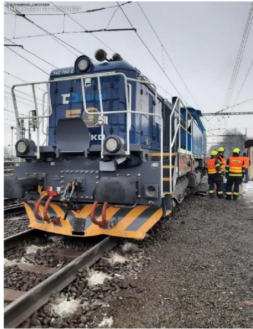
Obrázek 2 Vykolejení Zábřeh na Moravě.

Za vykolejení jízdnicích soupravy se též považuje, projetí nefunkčního či poškozeného výhybkového zařízení dráhy, které způsobí, že se kolo železničního vozu vychýlí ze své původní osy pouze částečně. Takle situace částečného vychýlení osy způsobí, že pokud železniční souprava dále pokračovala v jízdě, mohlo by dojít k úplnému vychýlení mimo osu koleje.