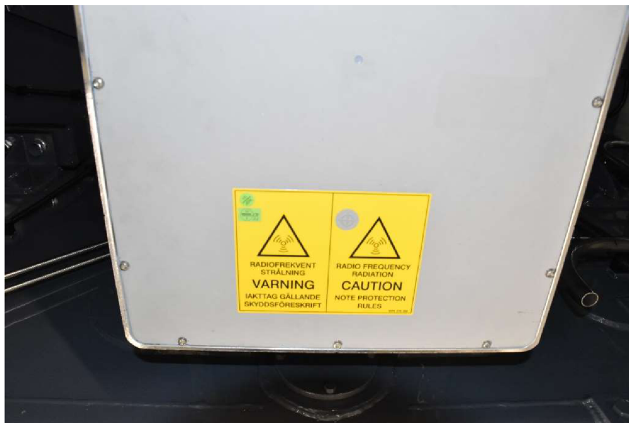
Obrázek 3 Výstražné značení ETCS.