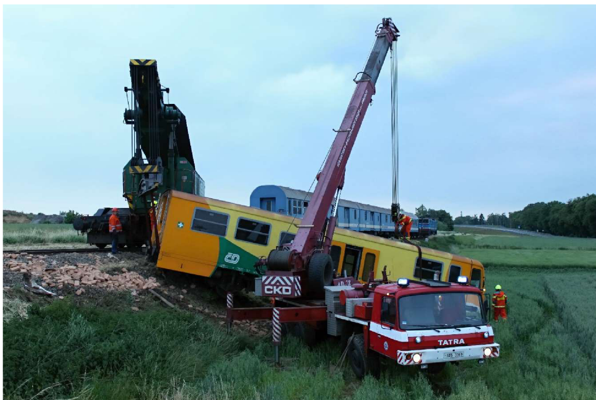
Obrázek 8 Použití automobilového jeřábu ve spolupráci s železničním jeřábem. Foto HZS Správy železnic Přerov

Nehodová pohotovost SŽ je subjekt, který působí pod Správou železnic a jejím základním úkolem je provádět vyprošťovací práce, které zahrnují události spojené s vykolejením železničních vozidel, nebo MU typu dopravní nehody srážka vlaků apod... Nehodová pohotovost je povolávána VZ HZS SŽ v případech, kdy SaP JPO jsou nedostatečné a vzhledem k následkům nehody a dalším podmínkám v místě události je zřejmé, že situaci na místě MU nelze zvládnout běžnými prostředky. Nejčastěji se jedná o vykolejení železniční soupravy takového rozsahu, kdy vzhledem k poškození vozidla a místním geografickým podmínkám v místě MU, nelze provést nakolejení pomocí nakolejovací soupravy, kterou disponuje HZS SŽ. V ojedinělých případech, kdy dojde ke vzniku srážky vlaků jsou následky často velmi rozsáhlé, a i přes dostatečný počet SaP je nehodová pohotovost povolávána na výpomoc tak, aby likvidační práce byly co možná nejrychlejší.