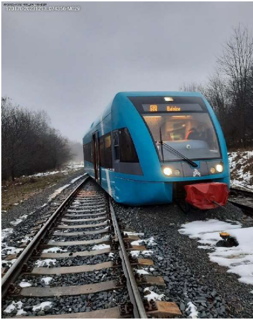
Obrázek 1 Vykolejení Broumov-Bylnice.

Vykolejení jízdnicích souprav lze definovat jako, vychýlení náprav železničního vozu mimo osu kolejí, a následně jízdě železničního vozu po základové ploše dráhy viz obr.č.2. Za základovou plochu dráhy se považuje zpevněná část, která je tvořena pražci, podkladovým materiálem, upevňovacími prvky.