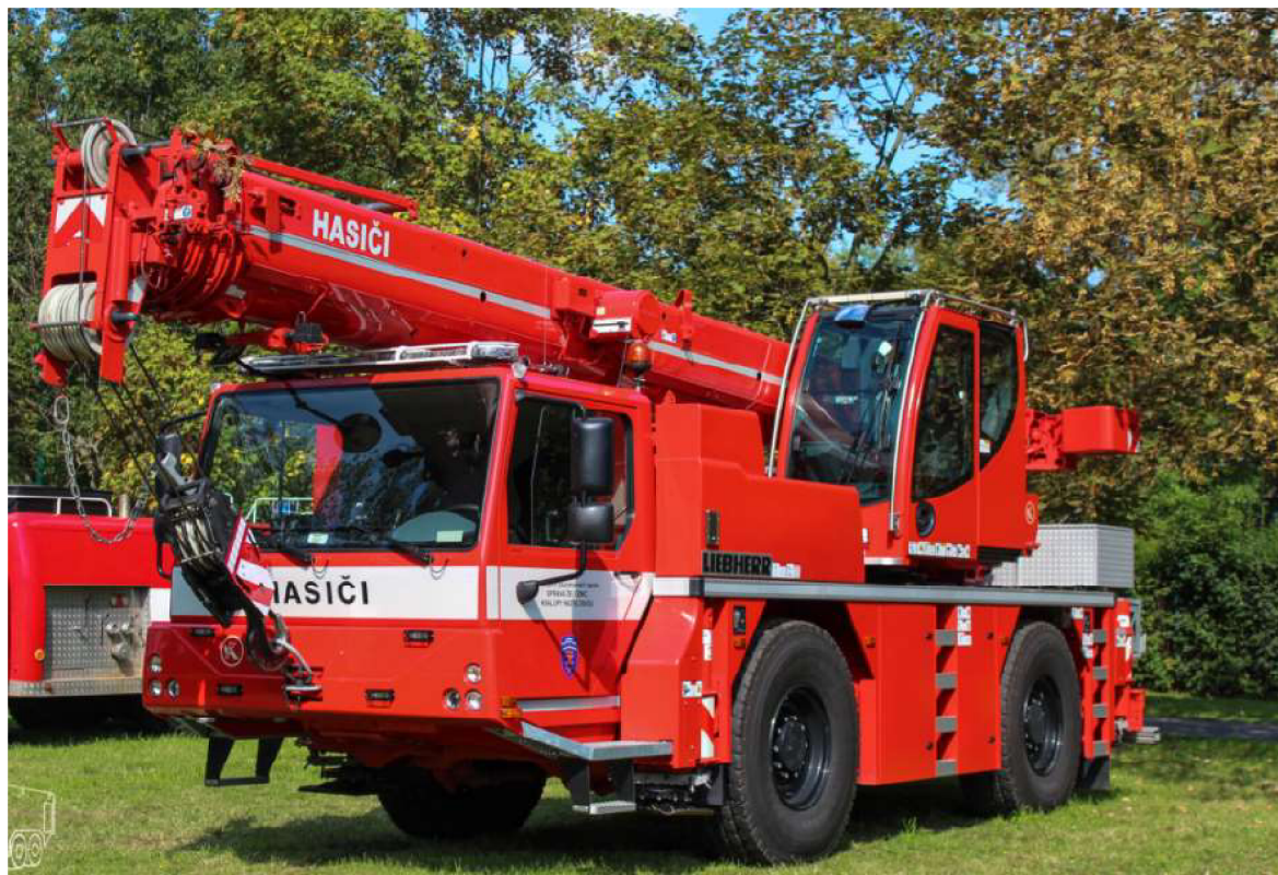
Obrázek 7 AJ 1030-2.1 HZS SŽ Kralupy nad Vltavou.

Během prací je VZ v nepřetržitém kontaktu s obsluhou automobilového jeřábu tak, aby byla zajištěna bezpečnost pro osoby vyskytující se na místě zásahu, tak i pro případ informování o nepředvídatelných jevech, které mohou během činnosti nastat.