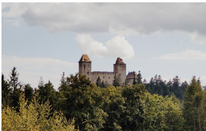
Obrázek 1: Hrad Kašperk

Hrad Kašperk je svým umístěním v nadmořské výšce 886 m n. m. nejvýše položeným královským hradem v Čechách. Nachází se nedaleko města Kašperské Hory, které je v současné době jeho majitelem. Byl postaven v roce 1356 na příkaz