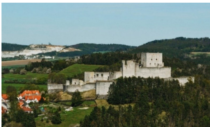
Obrázek 2: Hrad Rabí

Hrad se nachází ve stejnojmenné obci Rabí, nedaleko města Sušice, které leží uprostřed pomyslného trojúhelníku hradů. Hrad Rabí se se svou rozlohou téměř 1 ha řadí mezi největší hrady v ČR. Jeho vznik se datuje kolem roku 1350, kdy měl funkci strážní