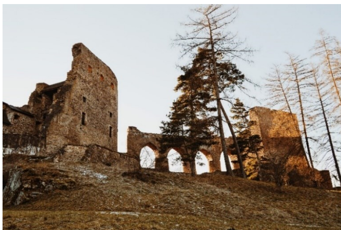
Obrázek 3: Hrad Velhartice

Hrad Velhartice byl vystavěn ve stejnojmenné obci Velhartice. Hradní areál se skládá z několika částí. Jedná se o Rajský palác, věž Putnu, hradní pivovar a renesanční zámek. Palác je s věží spojen jedinečným kamenným mostem. V blízkosti hradu se dále nalézají skanzeny.