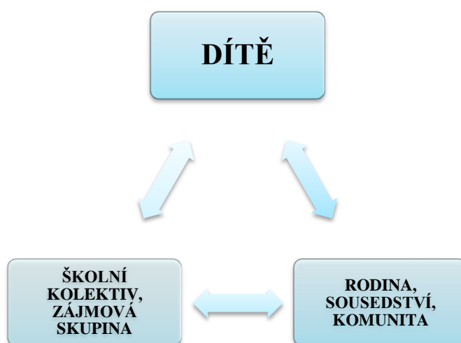
Obrázek 1 Vztah sociálního prostředí na dítě

Pro představu vlivu sociálního fungování společenství na dítě lze dle mého názoru využít model vztahu člověka a prostředí zaměřený na očekávání vypracovaný docentem Pavlem Navrátilem. Ten říká, že „člověk není vydán na pospas požadavkům svého sociálního prostředí (očekávání prostředí nejsou determinantou), vůči tomuto prostředí se vymezuje“. 8 Na níže uvedeném schématu je patrná interakce očekávání a požadavků, která působí i na dítě. Je důležité, aby interakce probíhaly harmonicky, protože pokud neprobíhají, nastávají potíže v sociálním fungování dítěte v rámci všech sociálních skupin.