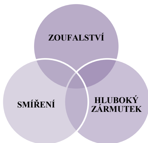
Obrázek 7 Fáze truchlení dle Elliota Kranzlera

Barbara Coloroso uvádí fáze truchlení dle Elliota Kranzlera. Udává také možnost prolínání fází a různého pořadí fází. 51