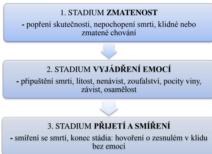
Obrázek 5 Stádia truchlení

Stádium zmatenosti je vyznačováno popíráním skutečnosti, že zemřela blízká osoba. Pozůstali se díky prvotnímu šoku chovají naprosto nelogicky, zmateně a kupodivu mnohdy i nečekaně klidně. Dalším znakem tohoto stádia je neschopnost zvládnání běžných činností, které jsou jinak každodenní rutinou. Běžné činnosti jsou