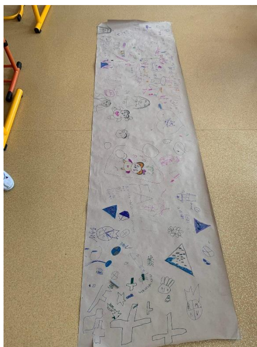
Obrázek 1: Skupinová kresba za rytmu romské hudby

Tato aktivita sloužila k rozvíjení kreativity a fantazie dětí, k tomu, aby se odreagovaly od pobytu v lavicích. Taktéž aktivita přispěla k tomu, aby spolupracovaly a vytvořily společné dílo, na kterém se všichni podíleli. Za pomoci této artefietické činnosti jsem chtěla u žáků rozvíjet kolektivního ducha této skupiny romských dětí, což mělo úspěch. Taktéž, jak bylo mým cílem, probudila jsem u dětí zážitek z kresby, ať už byl pozitivní či negativní. U této skupiny romských dětí jsem i zjistila, že místo toho, aby za rytmu hudby kreslili bezmyšlenkovitě, kreslili spíše konkrétní věci.