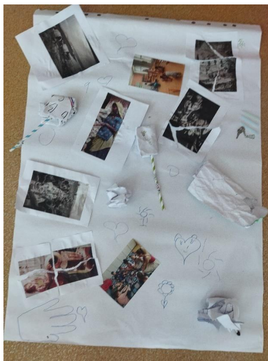
Obrázek 9: tvorba asambláže

Cílem této aktivity, jež byla poslední, bylo rozvíjení kreativity u dětí, rozvíjení jejich spolupráce a komunikace. Cíl byl naplněn. Děti si činnost užily a odnáší si nové zážitky z tvorby společného díla, což bylo účelem.