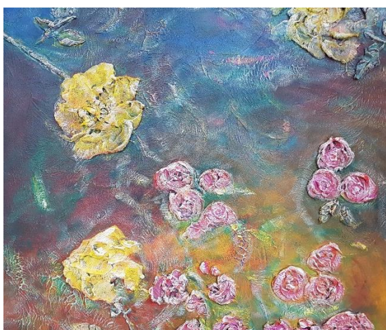
Obrázek 15: Paly Paštika