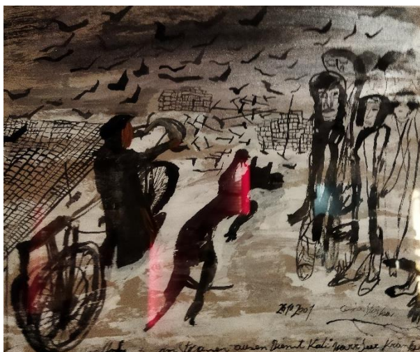
Obrázek 16: Strach (ten pes je zlo)

• Ceija Stojka – Strach (ten pes je zlo) , 2001, akvarel na lepence. Ceija Stojka (1933 – 2013), byla rakouská romská spisovatelka, hudebnice, výtvarná umělkyně a aktivistka. Spolu se svou matkou a čtyřmi bratry byla za 2. světové války vězněna v koncentračních táborech. V rámci prózy jí v roce 1988 vyšla první z jejích tří autobiografických knih „Žijeme ve skrytu“ a „Vyprávění rakouské Romky“. Poté se od 90. let minulého století věnovala výtvarné tvorbě. Vytvořila rozsáhlé soubory kreseb a maleb, z nichž většina vychází z traumatických zkušeností z let strávených v koncentračních táborech. (Dostupné z: https://www.ceijastojka.org/thefund )