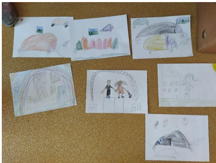
Obrázek 4: Kresba romského života

o svou kulturu a v ledolamce se zapojovaly. Samozřejmě povídání bylo přiměřené věku dětí a nezacházeli jsme příliš do hloubky. Výrazovou hrou si děti nevědomky procvičily i jemnou motoriku.