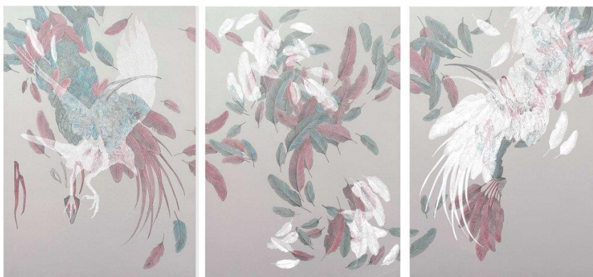
Obrázek 14: Povídky o strachu z létání, dostupné z: https://robertgabris.com/