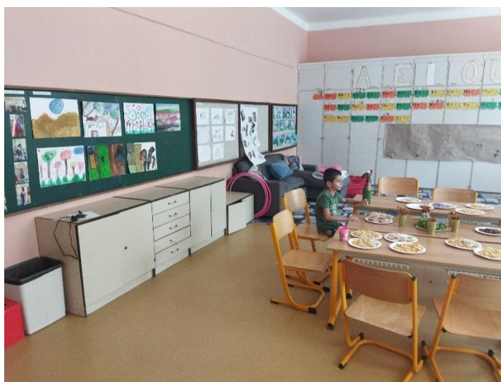
Obrázek 10: Vernisáž

Všem příchozím bylo vysvětleno, oč na této výstavě jde a co obsahuje. Během vernisáže panovala příjemná přátelská atmosféra. Děti byly chváleny za své práce.