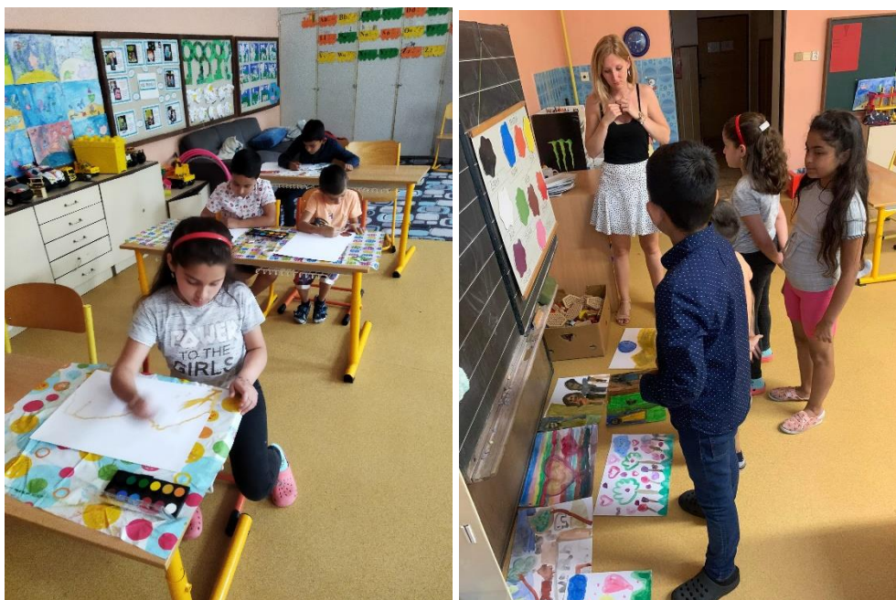
Obrázek 2 a 3: Reprodukce zvoleného díla