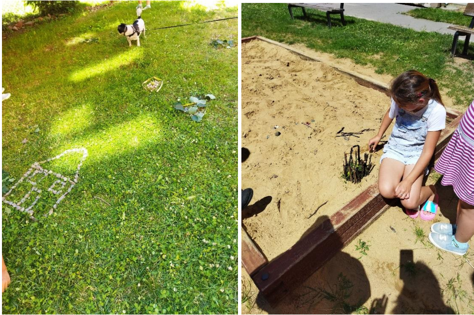
Obrázek 5 a 6: Land-art