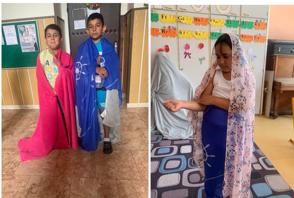
Obrázek 7 a 8: Živý obraz

Cílem činností bylo stmelení kolektivu, a hlavně rozvíjení komunikace mezi dětmi, čehož jsme docílili tím, že se navzájem fotili a také na společných fotkách si určovali, co kdo bude dělat. Ledolamkou jsme rozvíjeli kreativitu a představivost. A taktéž bylo splněno to, co je nejdůležitější u artefietické činnosti, děti měly z činností trvalý zážitek.