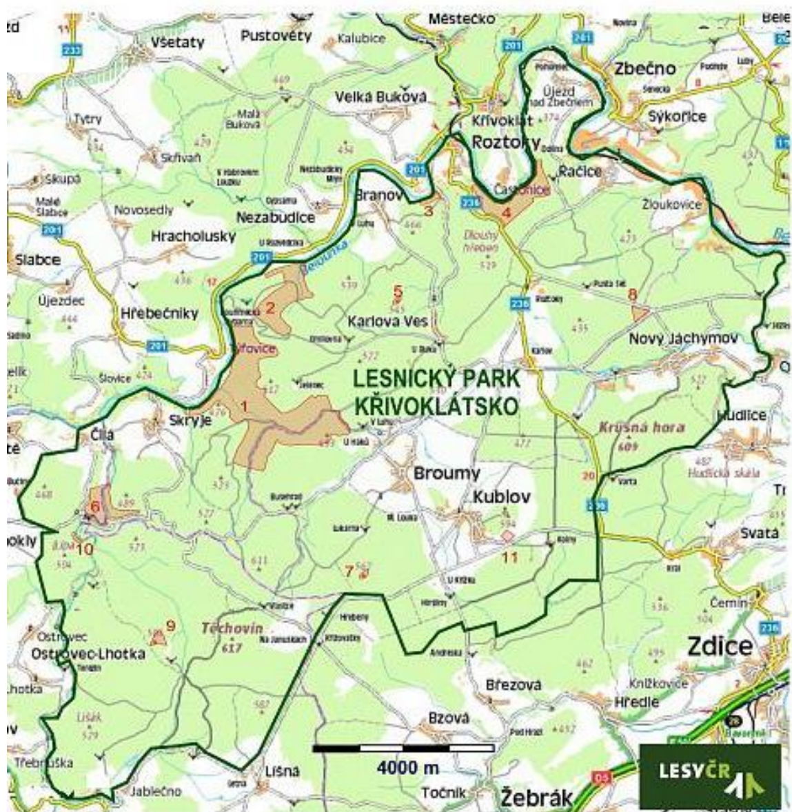
Obrázek 5 Mapa Lesnického parku Křivoklátsko, (dostupné z WWW: http://rakovnický.denik.cz/zpravy_region/chteji-lesnický-park-křivoklátsko20100209.html , 2017-04-06)

Hlavním důvodem pro vznik tohoto projektu bylo zachování vyjímečné přírody tohoto rozlehlého ekosystému a současně dál rozvíjet tradici křivoklátského lesnictví jako kulturního dědictví našeho národa. Vznik je zásluhou vlastníků a správců lesů, kteří chtějí volně hospodařit na svých majetcích bez zbytečných zásahů států. Lesnický park je tak v duchu svého hesla „území pro přírodu i pro lidi“ nesmírně vstřícným krokem pro všechny aktivity, které se podílejí na využívání tohoto krajinného celku (Lesy ČR, 2017).