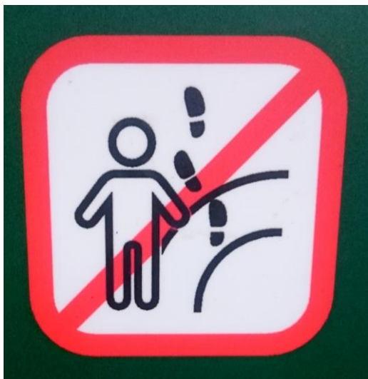
Obrázek 1 Značka informující o zákazu vstupu mimo vyznačené cesty.

Ve druhé zóně se nachází ta část lesů, která není zcela původní. Je zde znát zásah člověka.