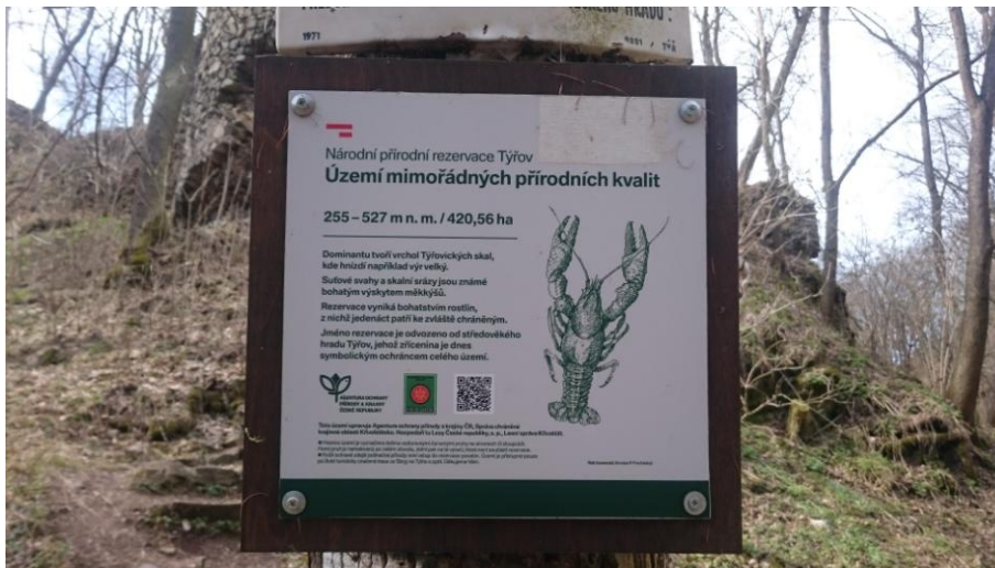
Obrázek 3 Informační cedule - Národní přírodní rezervace Týřov.

110 území, z nejznámějších a nejcennějších jsou to např. Černé a Čertovo jezero, Boubínský prales nebo Praděd (Strejček, a další, 1983).