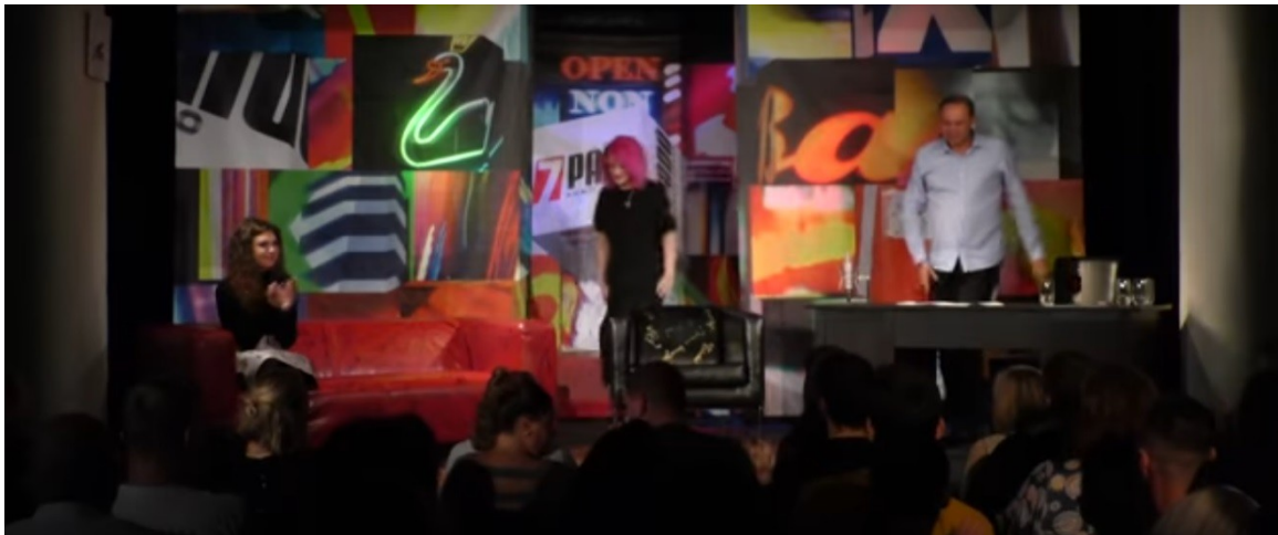
Obr. č.2: Snímek studia pořadu 7 pádů Honzy Dědka 41