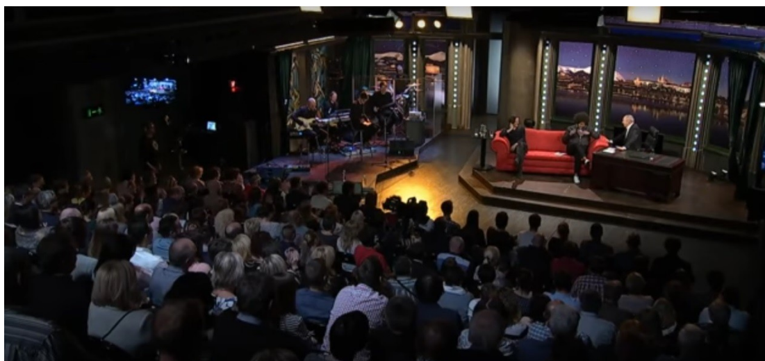
Obr. č. 1: Snímek studia pořadu Show Jana Krause 40

V divadle, kde se natáčí Dědkův i Krausův pořad, patří do zařízení stůl a židle. Dalšími zařízeními jsou červená pohovka, na které hosté sedí. U Dědka ještě navíc černé křeslo. Za zmínku stojí zajímavost, která také velmi ovlivňuje chování aktérů komunikačního aktu, a to, že u Jana Krause sedí host níže než moderátor, což zajišťuje moderátorovi lepší postavení a dominanci, v pořadu Honzy Dědka jsou oba v přibližně stejné výškové úrovni a moderátor se na hosta nenaklání jako v případě Jana Krause.