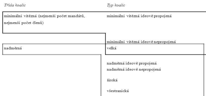
Obr. 1 - Zdroj: S. Balík Komunální politika: Obce aktéři a cíle místní politiky 2009 str. 48

Pro potřeby určování druhu komunálních politických koalic, je potřeba vycházet také z druhu obcí, ve kterých se tyto koalice skládají. Pro potřeby případových studií je ideální rozdělení obcí podle velikostí.