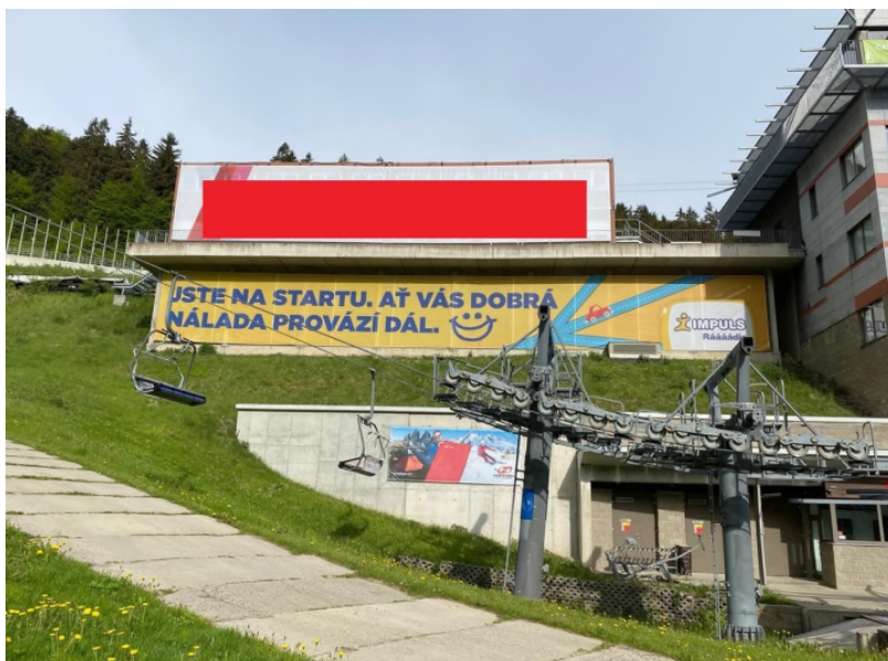
Obrázek 20: Reklama na buňkovišti