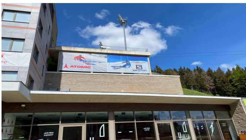
Obrázek 21: Reklama na správní budově 1