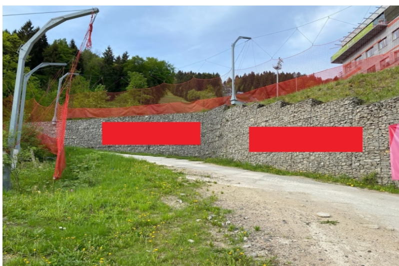
Obrázek 19: Reklama na gabiónu