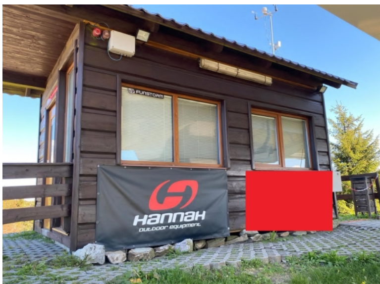
Obrázek 23: Reklama na výstupní stanici

Zdroj: reklamní ceník Skiareál Ještěd, 2021