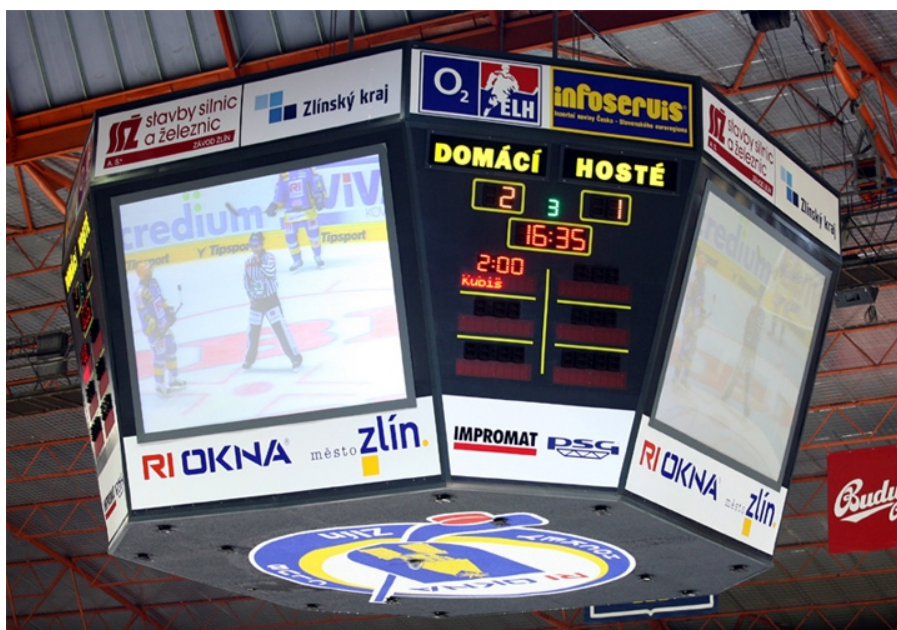
Obrázek 5: Reklama na TV kostce

U tohoto druhu reklamy je důležitý donucovací efekt. Divák se po čas zápasu či soutěže zajímá o výsledek a s tím vnímá i reklamu. Dnes jsou nejučinnější multimediální kostky (viz. Obrázek 5), které jsou dány technologickými možnostmi. Tato forma využívá především vizuálních efektů a tím možnost sdělování obsáhlejšího množství informací. Vyskytují se při všech sportovních akcích, kde se používají tabule a ukazatele (Čáslavová, 2020), (ftvs.cuni.cz).