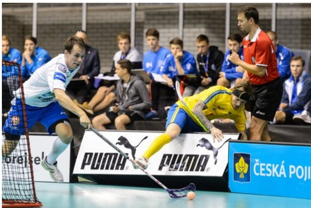
Obrázek 3: Reklama na mantinelech

Tento druh reklamy se vyskytuje a využívá ve sportech, které mají své sportoviště ohraničené např. hokej, fotbal, tenis (viz. Obrázek 3). Dnes existují i videopásy s pohyblivou reklamou či pásy s měnící se reklamou. Využívá se zde opět název a logo firem, název produktu, stručný text atd. Vyskytuje se zde nepřehledné množství reklam, při přítomnosti dvou a více značek si zákazník zapamatuje tu známější. Na zákazníka působí jako přímé upozornění při závodech, turnajích, při televizním vysílání záležitosti na četnosti záběrů.