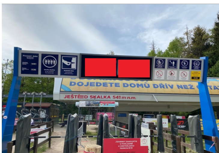
Obrázek 12: Reklama na digital signage