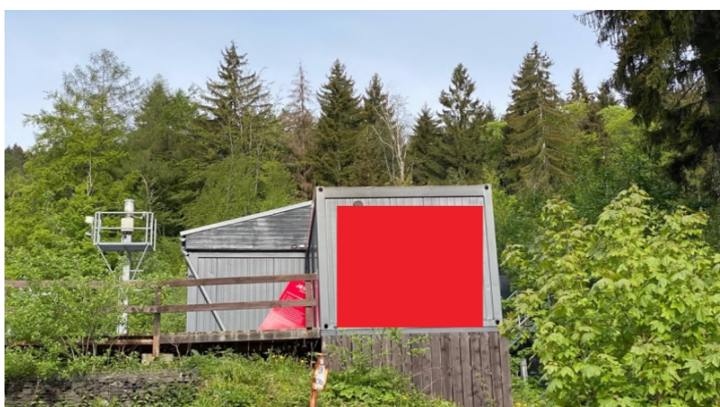
Obrázek 18: Reklama na WC