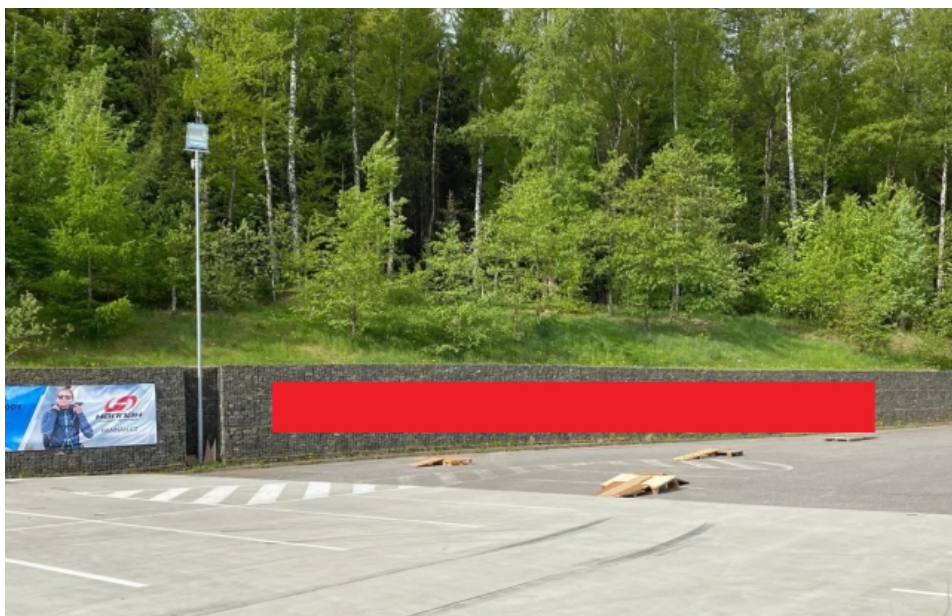
Obrázek 24: Reklama na gabiónu parkoviště