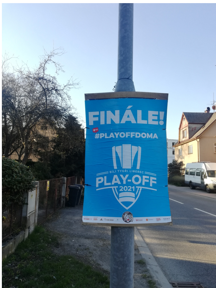
Obrázek 6: Reklama na sloupu veřejného osvětlení