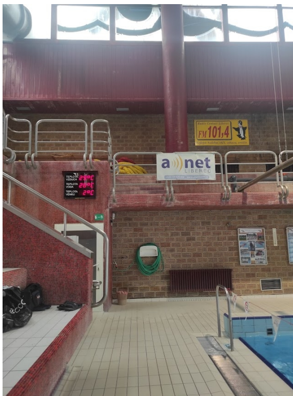
Obrázek 34: Reklama na zábradlí