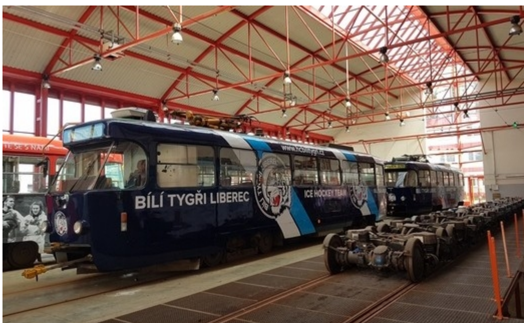
Obrázek 9: Celoplošná reklama na tramvaji HC Bílí tygři Liberec