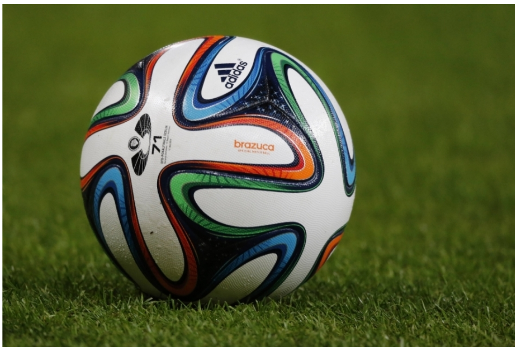
Obrázek 4: Reklama na sportovním náčiní

Tato reklama využívá specifického nářadí a náčiní (viz. Obrázek 4). Zvyšuje seznámení zákazníka se značkou, produktem či firmou. Nejčastěji se zde opět využívá text, značka, logo firmy apod. Většinou to jsou drobné reklamní nápisy a značky organizací např. na míčích, lyžích, tenisových raketách. Úspěšnost reklamy závisí na typu nářadí, náčiní, množství televizních záběrů a velikosti nápisu.