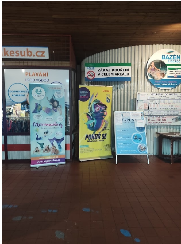
Obrázek 33: Reklama u pokladen