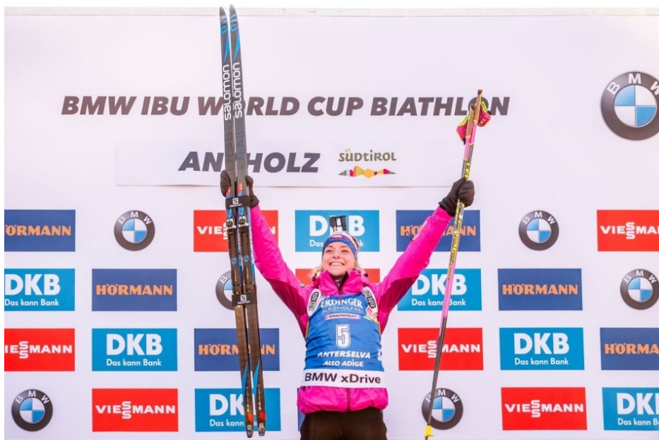
Obrázek 2: Reklama na startovacím čísle

Tato reklama je využívána především ve sportech jako jsou např. běžecké sporty, skoky na lyžích, maratony atd. Může se zde znázorňovat text nebo motiv, vše spadá do rozhodovací pravomoci pořadatelů. Můžeme však najít sporty, kde se startovní čísla nepoužívají (tenis, plavání). Avšak jsou sporty, kdy je startovní číslo (viz. Obrázek 2) povinnou a stabilní součástí dresu (kolektivní hry). Při sportovních akcích je působení přímé a při televizních přenosech se působení násobí. Konečný efekt reklamy závisí na velikosti samotné reklamy, na rychlosti pohybu a výskytu v televizním přenosu.