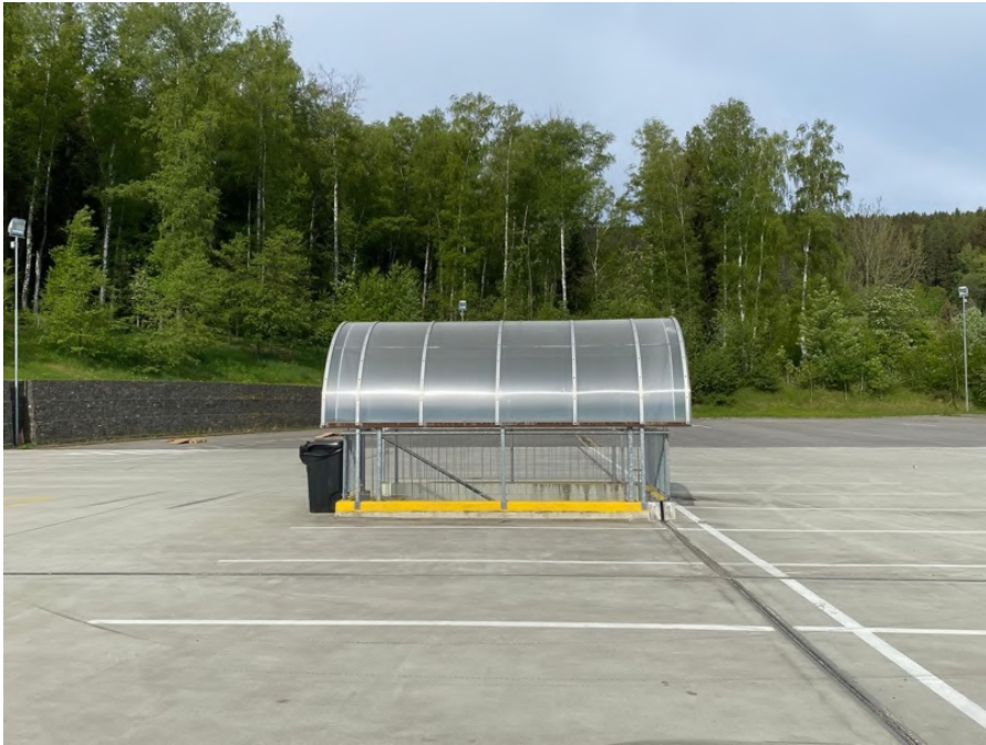
Obrázek 25: Reklama na zastřešení schodiště