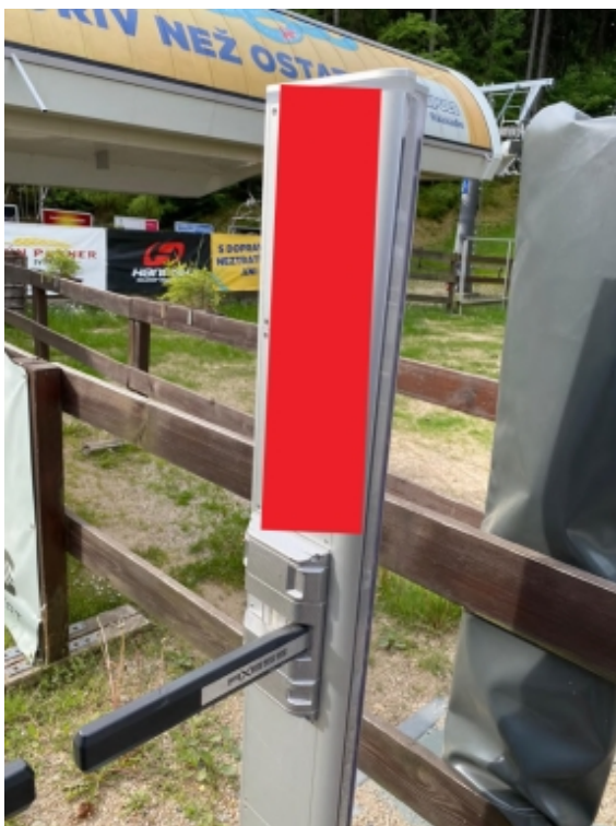
Obrázek 16: Reklama na turniketu