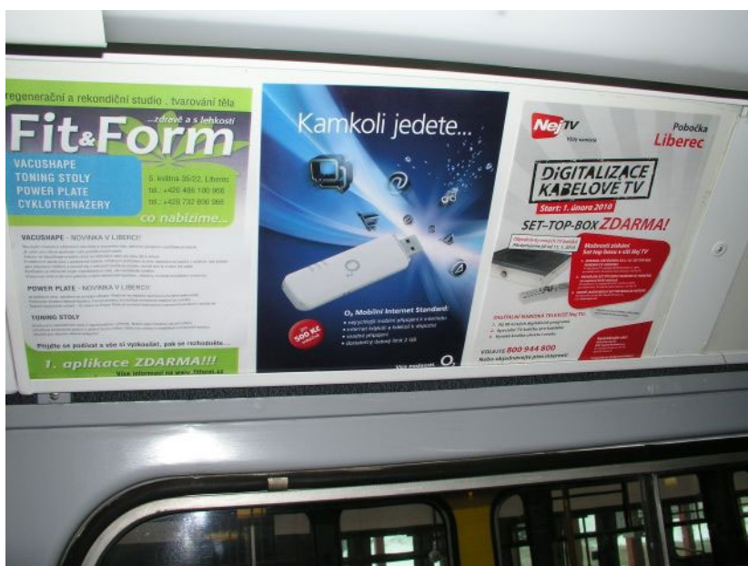
Obrázek 10: Reklama v interiéru vozidel