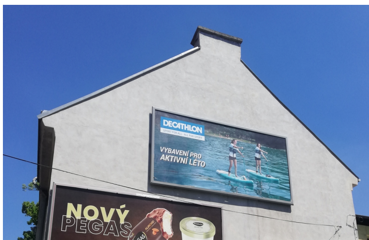
Obrázek 35: Reklama Decathlon

Nejčastěji můžeme vidět reklamy od firmy Decathlon, která se snaží sport dostat i k obyčejným lidem. Reklamy vystavují během celého roku, a pouze mění tematiku sportu dle období. Nejčastěji využívá billboardy na velmi dobře dostupných místech Liberce (viz. Obrázek 35).