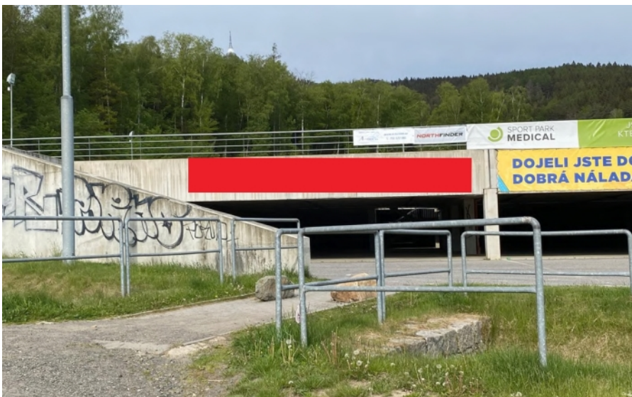
Obrázek 26: Reklama na betonové stěně parkoviště