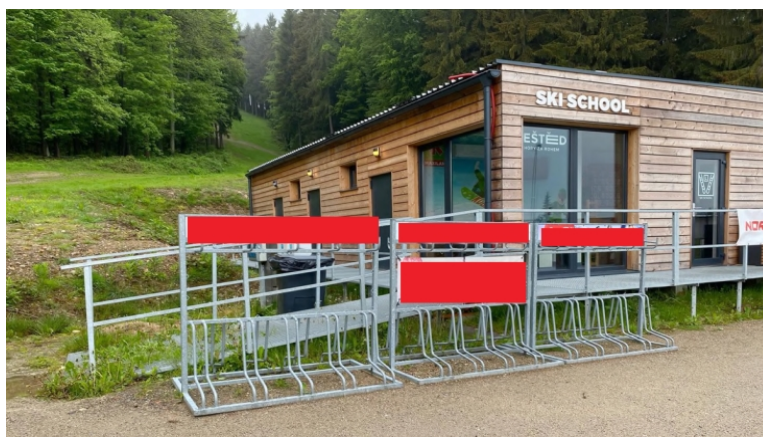
Obrázek 13: Reklama na stojanech