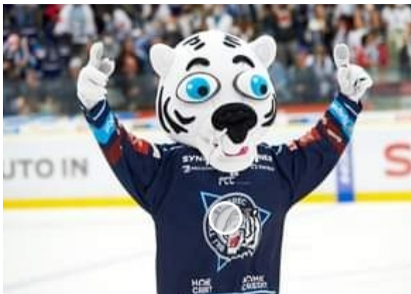
Obrázek 31: Reklama na maskotovi