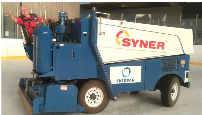
Obrázek 30: Reklama na rolbě