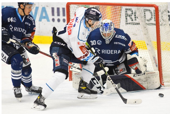
Obrázek 29: Reklama na vybavení hráčů