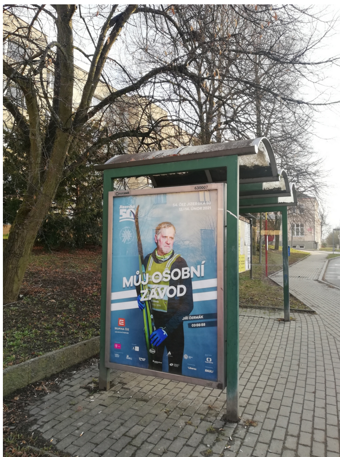
Obrázek 11: Reklama na zastávce