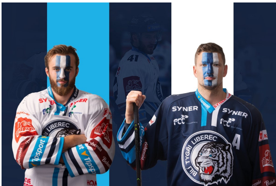
Obrázek 1: Reklama na dresu

Tato reklama využívá volného místa na sportovních dresech (viz. Obrázek 1), kde se nabízí například přední strana a zadní strana dresu, rukávy, nohavice apod. Tento druh sportovní reklamy seznamuje zákazníka s produktem, firmou, její akcí, příp. produkt či akci obnovuje nebo informuje o změně image produktu. Na plochu dresu můžeme umístit stručný text, motiv, logo atd. a toto vše omezují předpisy každé sportovní federace.