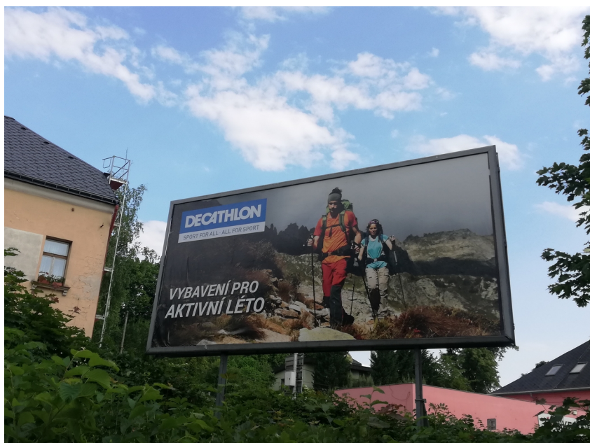
Obrázek 7: Reklama na billboardu

Ostatní druhy reklam jsou oceněny individuálně mezi které patří např. naváděcí a směrové tabule, směrníky, informační panely atd.