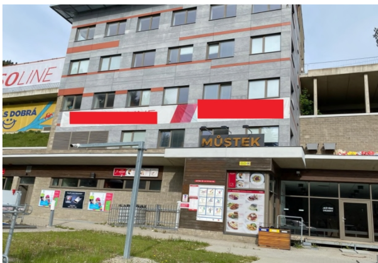
Obrázek 22: Reklama na správní budově 2