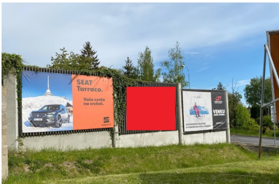
Obrázek 27: Reklama na protihlukové stěně