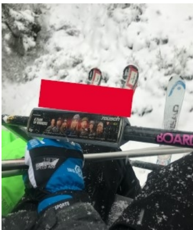
Obrázek 14: Reklama na bloku