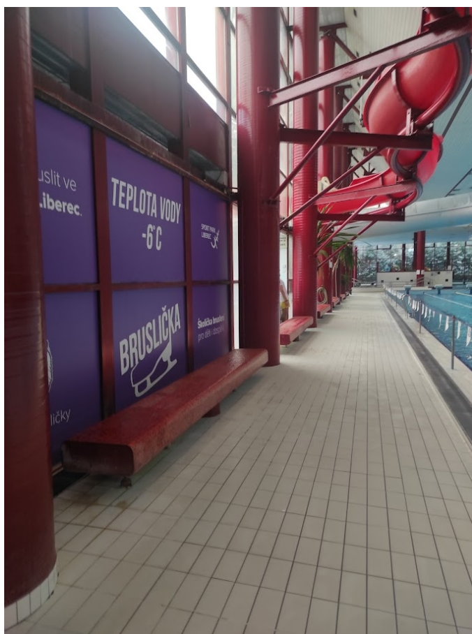
Obrázek 32: Reklama u velkého bazénu

Plavecký bazén nabízí celkem 5 reklamních ploch, které jsou možné k inzerci. Inzerovat můžou jak velké firmy, tak i malé firmy ale i jednotlivé subjekty. Smlouva je sepsána vždy na 1 rok, poté zde smlouvu prodloužit ale opět pouze jen na 1 rok. Podmínky pro získání reklamní plochy jsou velmi individuální. Ceny nejsou stanoveny a vždy záleží na vzájemné dohodě.