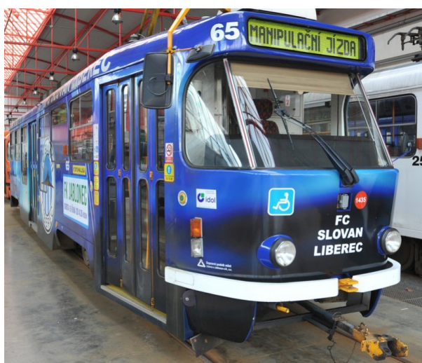
Obrázek 8: Celoplošná reklama na tramvaji FC Slovan Liberec