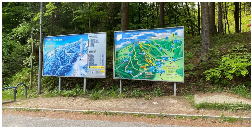
Obrázek 17: Reklama na panelu - F10