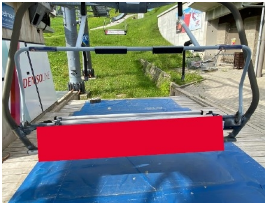
Obrázek 15: Reklama na lanovce