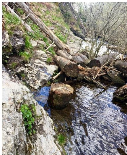
Obrázek 14 Náročná stezka v údolí

Po fyzicky náročném sestupu se dostaneme zpátky na rozcestník Na paloučku, odkud se vrátíme zpátky do Karlovy Studánky.