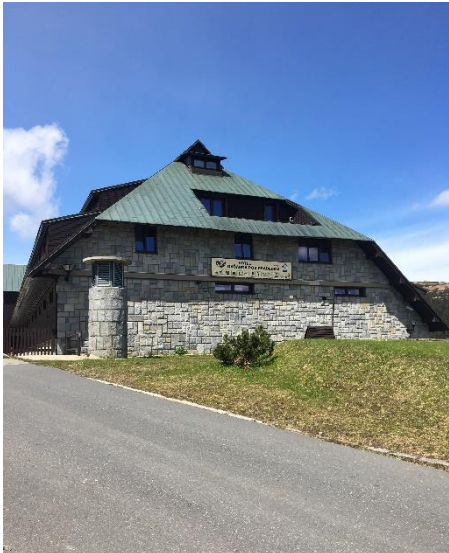
Obrázek 10 Chata Ovčárna