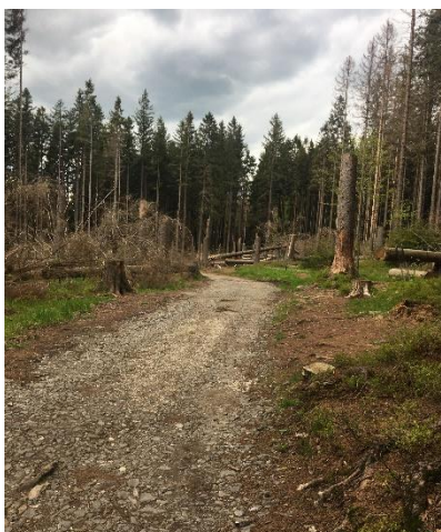
Obrázek 20 Cesta k mechovému jezírku

Cesta vede lesem (obrázek 20) a není nijak náročná. Dojdeme k rozcestníku U mechového jezírka a vydáme se směrem k němu. Cesta ke vstupu (obrázek 21) do areálu vede po dřevěné lávce, což ji činí atraktivnější. Po zaplacení vstupného obdržíme vzhledově, ale i velikostně originální vstupenky (viz obrázek 22).