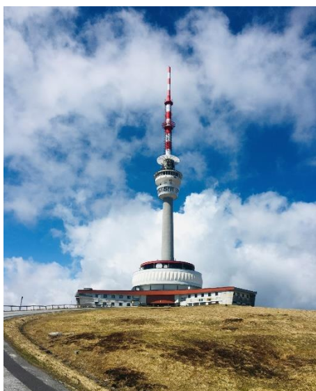
Obrázek 8 Hora Praděd (Autorka)

Po několika minutách vystoupáme na vrchol (obrázek 8). Před budovou vysílače nás přivítá dřevěná socha Praděda (obrázek 9). Budovu vysílače je možné obejít dokola a užít si výhled například na známé Petrovy kameny. Co může působit negativním dojmem, je nedostatek informačních cedulí, které by nám objasnily, jaké vrcholy v dálce vidíme. Celkově vrchol Pradědu je ochuzen o jakékoliv informační materiály, které by návštěvníka o čemkoli informovaly, proto se návštěvník musí spolehnout sám na sebe, a využít například informace z internetu. V případě zájmu můžeme navštívit restauraci, která se v budově nachází, či se výtahem nechat vyvézt na rozhlednu, která je umístěna na vysílači.