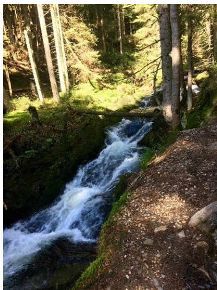
Obrázek 3 Bílá Opava

Naučná stezka obsahuje celkem 13 zastávkových bodů, na kterých je vysvětlený vznik chráněného území, živočichové zde žijící, či například i problémy, se kterými se potýká.