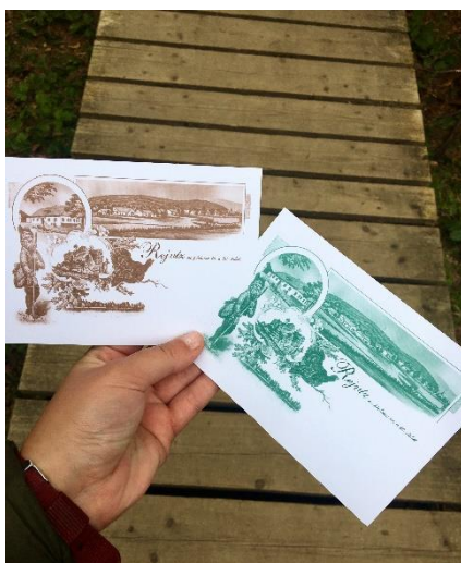
Obrázek 22 Vstupenky k jezírku

Cesta areálem vede mezi lesy po již zmíněné lávce (obrázek 23). Než se dostaneme k samotnému jezírku, můžeme si díky informačním cedulím umístěných na stezce přečíst něco o okolní přírodě a vzniku jezírka.