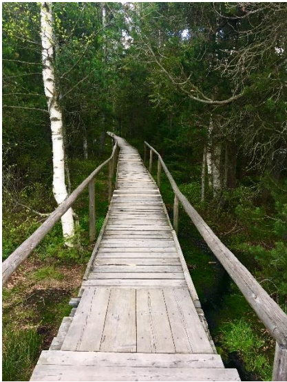
Obrázek 23 Stezka k mechovému jezírku

Po chvíli se dostaneme až na konec stezky k Velkému mechovému jezírku (obrázek 25, 26).