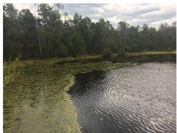
Obrázek 26 Velké mechové jezírko 2