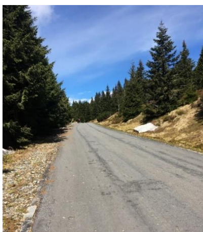
Obrázek 6 Cesta od chaty Barborky na Praděd