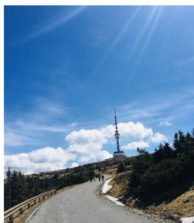
Obrázek 7 Cesta na horu Praděd