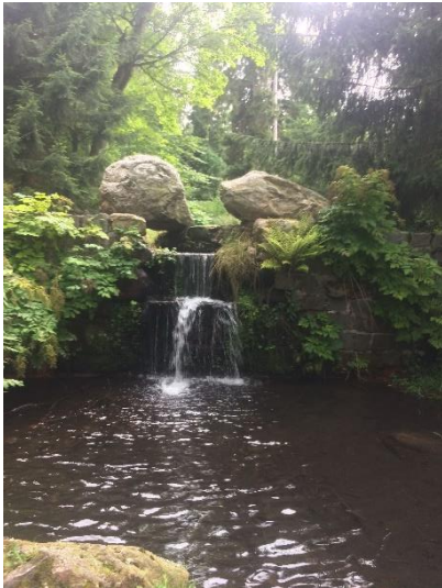
Obrázek 17 Vodopád v Karlově Studánce