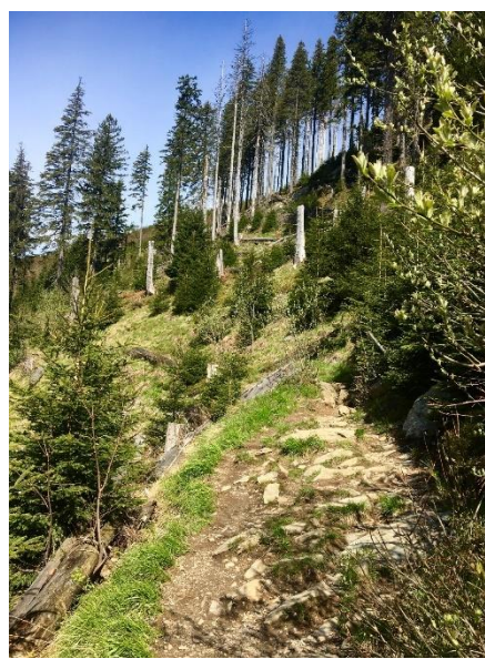
Obrázek 4 Stezka údolím (Autorka)

Po přibližně dvou kilometrech dojdeme k rozcestníku Na paloučku, kde se stezka rozděluje. Dělí se na žlutou a modrou. Pro náš výlet zvolíme modrou značku a začneme pozvolna stoupat. Cesta v lese není velmi upravená, z tohoto důvodu je považována za velmi náročnou. V okolí si můžeme povšimnout, jaké škody vichřice v chráněném území může způsobit (viz obrázek 4).