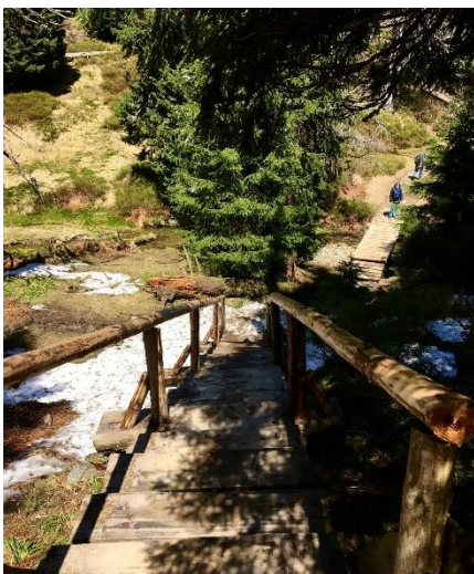
Obrázek 13 Cesta do Údolí Bílé Opavy