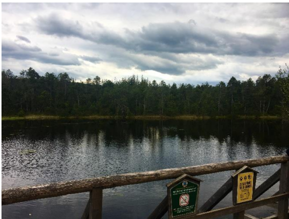
Obrázek 25 Velké mechové jezírko 1