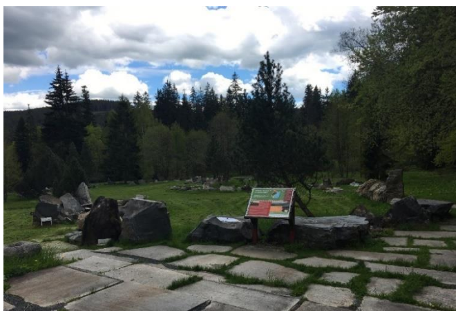
Obrázek 16 Geologická expozice (Autorka)