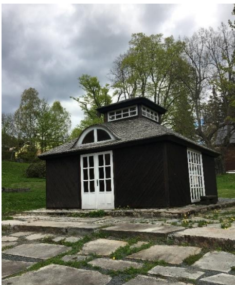
Obrázek 15 Budova infocentra

V Karlově Studánce nás čeká několik velice příjemných zastávek. Hned na vrchu můžeme navštívit za budovou infocentra (obrázek 15) expozici „Geologie Jeseníků na jednom místě“ (obrázek 16), která nám představí více než 300 hornin, které se z jesenické oblasti pochází. Nalezneme zde například břidlici, mramor, či například grafit. Poté můžeme volně pokračovat do parku, který může sloužit jako příjemné místo odpočinku po náročné trase. Nachází se zde malý vodopád (obrázek 17) a fontána se sochou jelena.