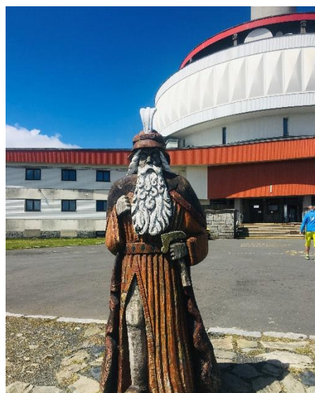
Obrázek 9 Praděd

Po prohlídce nejvyššího vrcholu Hrubého Jeseníku se po stejné cestě budeme vracet dolů. Po přibližně 20 minutách dojdeme k chatě Ovčárna (viz obrázek 10). Nad chatou můžeme spatřit další bod našeho výletu – Petrovy kameny (obrázek 11). Vzhledem k okolnosti, že se v oblasti, kde se kameny nachází, vyskytuje lipnice jesenická a zvonek jesenický (které se nikde jinde nevyskytují) je přístup k přírodní památce omezený. 133 Přiblížit se jim můžeme pomocí žluté stezky, vedoucí k zastávce „Nad Ovčárnou“, a dále kdybychom pokračovali pár metrů po červené (obrázek 12).