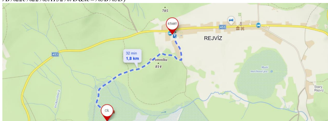
Obrázek 2 Celková mapa výletu 2/2 ( https://mapy.cz/turisticka?planovani-trasy&x=17.2958889&y=50.2250882&z=15&rc=97L3vxYnDhdTndS9&rs=ward&rs=base&ri=13166&ri=2037062&mrp=%7B%22c%22%3A132%7D&xc=%5B%5D&rpw=1%3B97JmMxYmtjfbAMpfQxAm2DfRufQgej7 )

Vycházková trasa začíná v Karlově Studánce na parkovišti Hubertus. V tuto chvíli se nabízí dvě možnosti. První možnost je, že se přesuneme k autobusové zastávce a necháme se vyvézt k chatě Ovčárna, odkud po asfaltové cestě budeme pokračovat dál