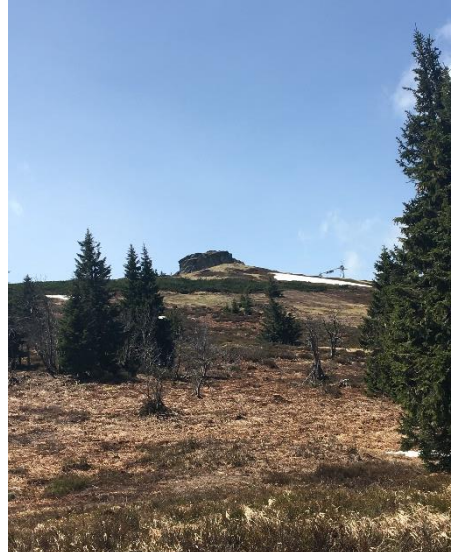
Obrázek 11 Petrovy kameny (Autorka)