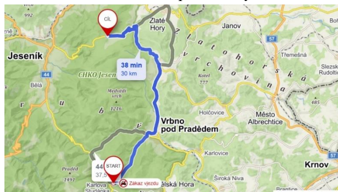
Obrázek 19 Trasa z Karlovy Studánky na Rejvíz https://mapy.cz/turisticka?planovani-trasy&x=17.2931812&y=50.1735391&z=11&l=0&rc=97LfZxXtCkeN6xYmkf&rs=muni&rs=coor&ri=4529&ri=&mrp=%7B%22c%22%3A111%7D&xc=%5B%5D&rwp=1%3B97OZtxXnH5dAmCdkzbxYSWwel0xYhkJdSq5983EXILXb8t3IN&rut=1

Autem se přesuneme do horské osady Rejvíz, která se nachází pár kilometrů za okresním městem Jeseník. Cesta nám odhadem zabere maximálně půl hodiny, na obrázku 19 je zobrazena trasa.