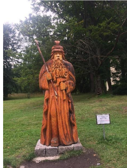
Obrázek 18 Socha Praděda (Autorka)

Parkem můžeme projít k roubenému pitnému pavilonu, kde budeme moci ochutnat pramen Petr, který zde byl vyvrtán v 60. letech minulého století. 134 Důležité je myslet na to, že nádobu, z které chceme pít, si musíme donést vlastní.