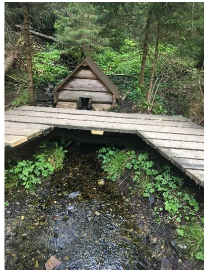
Obrázek 24 Studánka podél stezky k jezírku