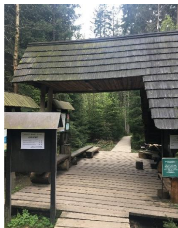
Obrázek 21 Vstup do NPR Rejvíz