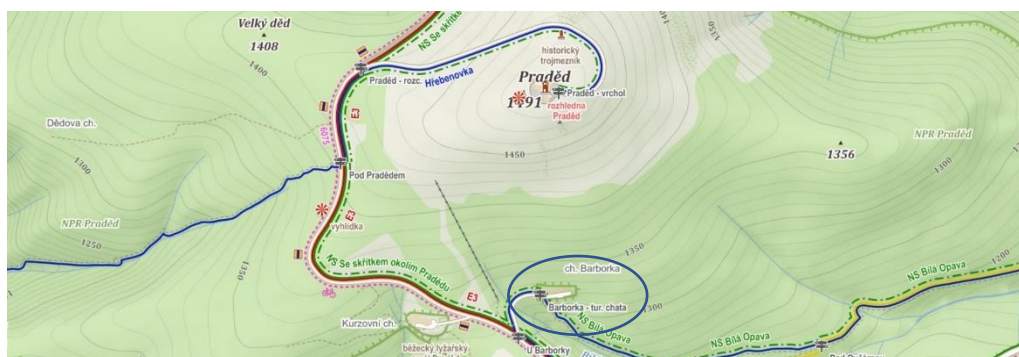
Obrázek 5 Chata Barborka na mapě ( https://mapy.cz/turisticka?planovani-trasy&x=17.2324533&y=50.0796382&z=15&l=0 )

Po přibližně 2 kilometrech se dostaneme k chatě Barborce (zobrazena na mapě na obrázku 5), odkud se budeme držet ukazatele a po modré se vydáme směrem k Pradědu. Cesta již zdaleka nevede lesem a je tvořena asfaltem (viz obrázek 6). Dokonce i v pozdních jarních měsících je možné se místy setkat s pozůstatky neroztátého sněhu. Co se flóry týče, s přibývajícím nadmořskou výškou ubývá i počet stromů, které nahrazují drobnější dřeviny. Po chvíli dojdeme k rozcestníku Praděd, který se nachází 1420 m n. m., odtud nám bude zbývat pouhý kilometr, k pokoření vrcholu. V tuto chvíli před námi bude vrchol hory jasně viditelný (viz obrázek 7).