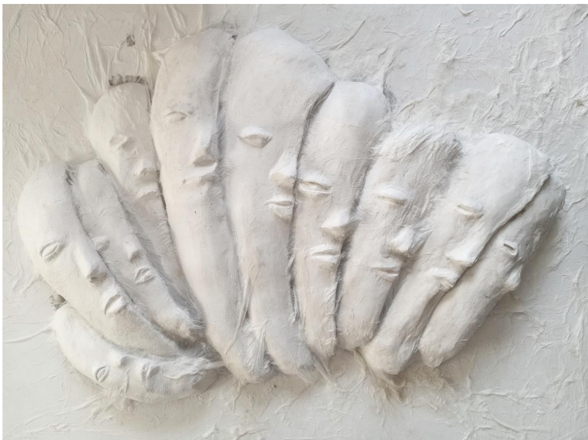
Obrázek 13: Jednotlivé komponenty kaširované po nalepení k natřenému podkladu.

Největší výsledný sádrový objekt dosahuje délky přibližně 50 cm, v jeho nejširším bodě má pod 15 cm. Naopak nejmenší objekt měří přibližně do 30 cm. K podkladu jsem každou část lepila silikonovým lepidlem a následně překližku ošetřila bílou akrylovou barvou.