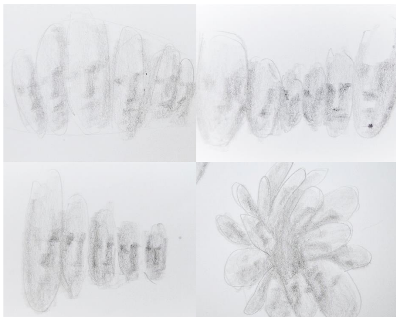
Obrázek 7: Návrhové skici k objektu Peklo v člověku.