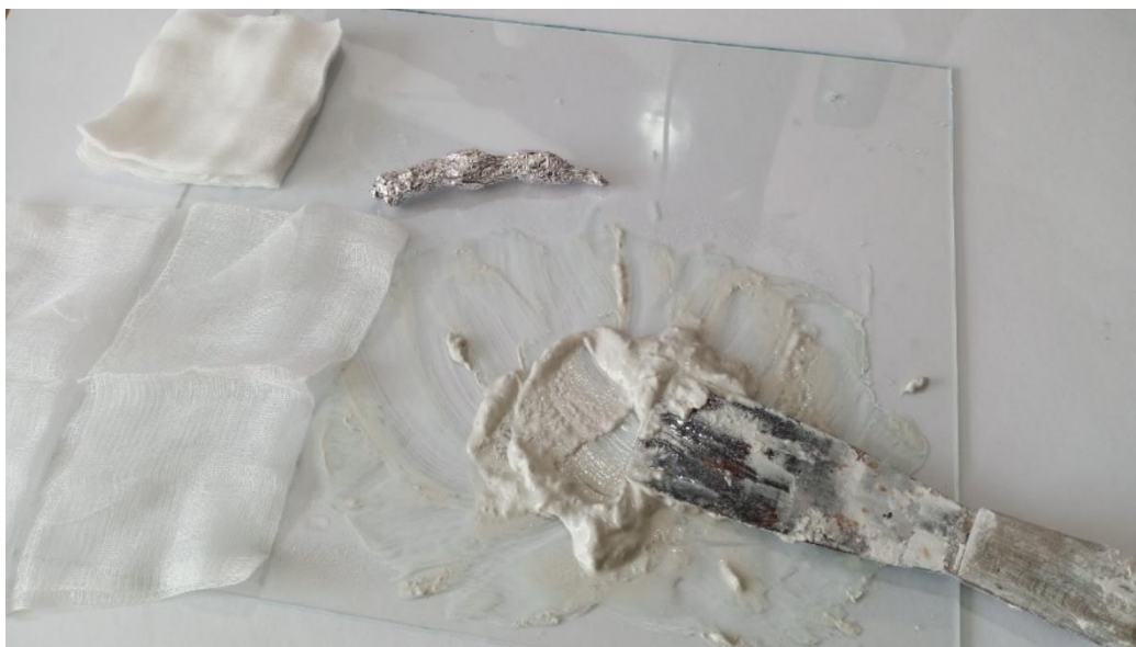
Obrázek 15: Příprava kaše z Fimo hmoty a základ prstu z hliníku.