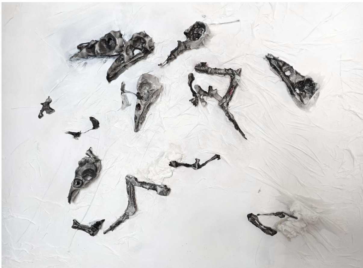
Obrázek 10: Kašírovaný objekt s nalepenými komponenty.

pracovala s technikou kašírování. K tomu jsem využila tenkých papírových kapesníků a lepidlo na tapety. Po řádném vyschnutí jsem vše natřela podkladovou akrylovou barvou a na ni jsem postupně přidala další vrstvy.