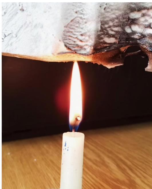
Obrázek 9: Úprava extrudovaného polystyrenu nad plamenem.

Hlavními částmi tohoto objektu jsou stylizované části ptačích koster, které jsem vytvořila z extrudovaného polystyrenu. Ten jsem zvolila pro jeho nízkou hmotnost, která byla pro mne při tvoření z technických důvodů jednou z hlavních priorit, ale také jeho snadná opracovatelnost, a to i v domácích podmínkách. Nejdříve jsem do polystyrenu vyřezala základní tvar, který jsem pak dotvořila tavením nad ohněm.