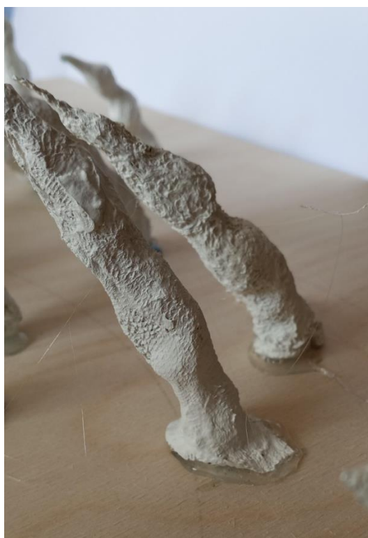
Obrázek 16: Hotové prsty přilepené k podkladu.

Po vyschnutí jsem komponenty lepila k podkladové desce a poté jsem vše natřela bílou podkladovou barvou akrylového složení. I na tomto objektu jsem využila textury vytvořené kaširováním a natavené kousky polystyrenu organických tvarů. Takto texturovaný podklad jsem natřela černou akrylovou barvou, a i zde jsem použila patinování vyvýšených míst