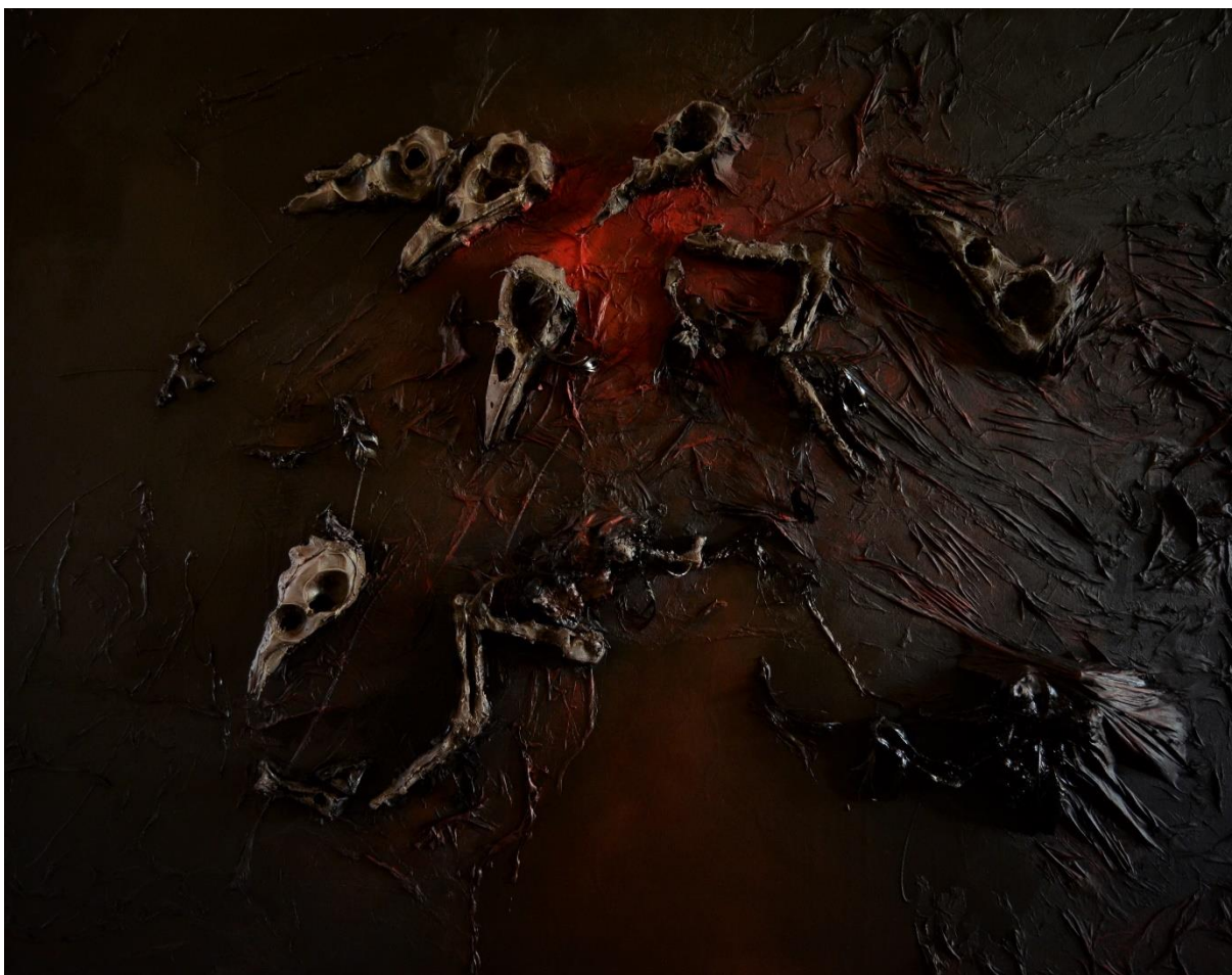
Obrázek 11: Dokončený objekt Peklo s lidmi.

Obraz zachycuje stylizované ptačí lebky, kosti zvířat a peří na černém zvrásněném pozadí. Černé mastné slepené peří může odkazovat na ptáky vyplavené z moře po ropné havárii. Červená skvrna v centru obrazu prvoplánově symbolizuje barvu krve, ale též vystavuje červenou stopku lidskému destruktivnímu počínání. Textura a zvrásnění díla jako rány na duších zvířat nucených žít s člověkem prostupují celým prostorem. Po lidském počínání toho ze zvířat příliš nezbude, proto není dílo poseto kostrami, ale dominují pouze lebky, neúčinný odpad biovýroby. Mrtvá zvířata topící se v černotě nemají před zlým počínáním člověka úniku ani spásy. Jsou odsouzeni k bídě a utrpení, což je podtrženo barevností obrazu.