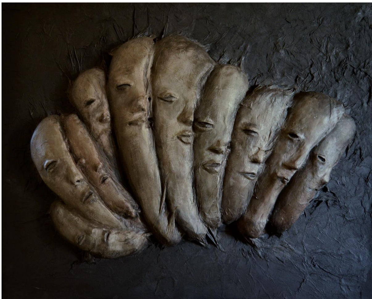
Obrázek 14: Dokončený objekt Peklo v člověku .

Myslím si, že je vhodné, aby se každý pokusil projít si procesem hledání interpretace tohoto díla, neboť jeho cílem je hlubší poznání sebe samotného. Objekt pojednává o změnách osobnosti a identity, a i já sama jsem v průběhu jeho tvorby pracovala hned s několika myšlenkami, a proto z mého úhlu pohledu nemá vyhraněnou interpretaci.