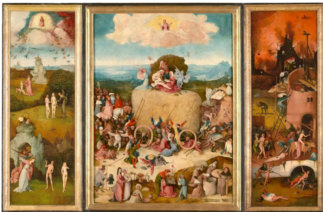
Obrázek 1: The Haywain Triptych . Autor: H. Bosch. 1512-1515

Hieronimus Bosch , tvořící v období renesance, byl bezesporu jedním z nejslavnějších malířů ve svých dílech ilustrující výjevy z pekla a krajinu podsvětí. Pocházel z Holandska a žil v letech 1450 až 1516. Malbě se začal věnovat nejspíše díky svému otci nebo strýci. V počátcích tvorby tvořil obrazy s biblickými výjevy vyjadřující pro renesanci optimistickou naději v lidstvo. Avšak pozdější díla na rozdíl od jeho současníků nebyly stigmatizovány tradičním pojetím své doby, jsou svojí podobou naprosto originální, pojímají hlubokých významů a doposud se nepodařilo všechny objasnit, neboť moderní psychologie nedokáže zasáhnout do zákoutí a okolností jeho doby. Je ale jasné, že Bosch ve svých obrazech podává zrcadlo tehdejší společnosti a kritizuje její morální hodnoty. Středověká temnota žití se odráží na jeho scénériích fantaskních krajin zamořených bytostmi z pekla i samotným ďáblem, které obsahují výjevy lidských hříchů, bláznovství a chaosu, smrti a posmrtném utrpení v pekle. Jeho bohatou fantazii dokazují stovky bizarně vyhlížejících monster, mutantů. 17 Krásným příkladem jeho tvorby je dílo zvané Haywain Triptych, česky Fůra sena, jejíž třetí část otevřeného triptychu vyobrazuje nejspíše právě peklo.