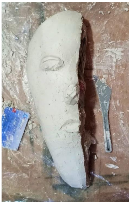
Obrázek 12: Jeden ze sádrových komponentů po základní povrchové úpravě.

Jako hlavní materiál k modelování jednotlivých komponentů jsem zvolila sádro. Nastříhané pásy gázy jsem namočila do zpolu ztuhlé sádry a následně je vrstvila na jednoduchý podklad vytvořeného ze zmačkaných novin do určitého tvaru, v němž držely pomocí lepící pásky a igelitového sáčku, aby se sádrový objekt snadno odděloval a byl dutý. Když byla sádra ve vhodné fázi tuhnutí, začala jsem ji modelovat pomocí špachtlí a plastové karty. Po vyschnutí jsem ji dobrousila smirkovým papírem.