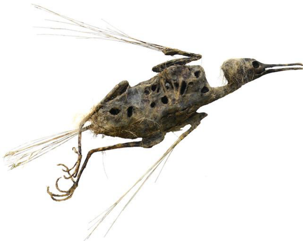
Obrázek 4: Untitled Sculpture 13 . Autor: O. de Sagazan

Olivier de Sagazan , dříve biolog, známý francouzský umělec současné doby, se ve své tvorbě věnuje především oblastem performance, malířství a sochařství. 20 Samotným námětem většiny, nebo snad všech jeho děl, je idea zkoumání organického života, což je dost určitě vyústěním jeho bývalého profesního zaměření. Z jeho zálibení darovat jakékoliv hmotě život vznikl nápad pokrývat své vlastní tělo hlínou a sledovat člověka před očima proměňujícího se v jakousi monstrózní bytost, jejíž tvary a vzhled se neustále mění a snaží se přijít na to, kým vlastně je. Tato myšlenka byla jedním z podnětů ovlivňující zpracování námětu a konceptu této bakalářské práce.