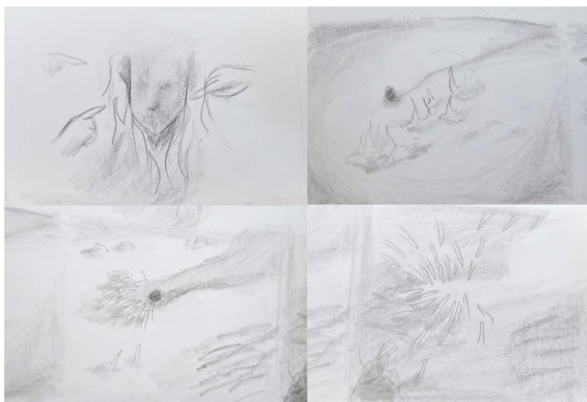
Obrázek 8: Návrhové skici k objektu Peklo s lidmi.