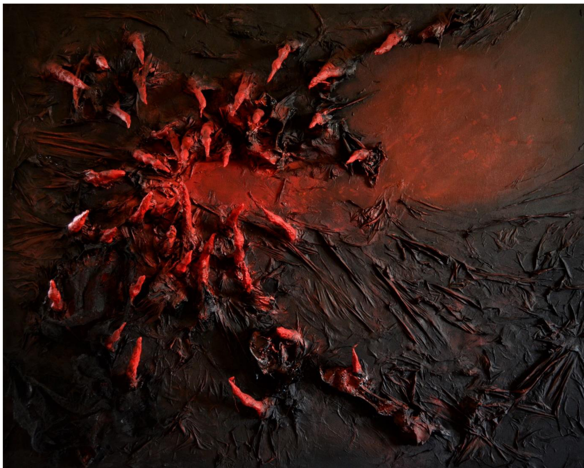
Obrázek 17: Dokončený objekt Peklo mezi lidmi.

z kaširovaného papíru. Barvu prstů jsem volila v odstínech červené. Jako další komponent jsem natrhala kusy zdravotnické gázy a namáčela v černé barvě. Po uschnutí jsem je lepila k podkladu a prstům.