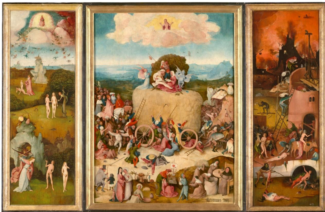
Obrázek 1: The Haywain Triptych . Autor: H. Bosch. 1512-1515

Hieronymus Bosch , tvořící v období renesance, byl bezesporu jedním z nejslavnějších malířů ve svých dílech ilustrující výjevy z pekla a krajinu podsvětí. Pocházel z Holandska a žil v letech 1450 až 1516. Malbě se začal věnovat nejspíše díky svému otci nebo strýci. V počátcích tvorby tvořil obrazy s biblickými výjevy vyjadřující pro renesanci optimistickou naději v lidstvo. Avšak pozdější díla na rozdíl od jeho současníků nebyly stigmatizovány tradičním pojetím své doby, jsou svojí podobou naprosto originální, pojímají hlubokých významů a doposud se nepodařilo všechny objasnit, neboť moderní psychologie nedokáže zasáhnout do zákoutí a okolností jeho doby. Je ale jasné, že Bosch ve svých obrazech podává zrcadlo tehdejší společnosti a kritizuje její morální hodnoty. Středověká temnota žití se odráží na jeho scénériích fantaskních krajin zamořených bytostmi z pekla i samotným ďáblem, které obsahují výjevy lidských hříchů, bláznovství a chaosu, smrti a posmrtném utrpení v pekle. Jeho bohatou fantazii dokazují stovky bizarně vyhlížejících monster, mutantů. 17 Krásným příkladem jeho tvorby je dílo zvané Haywain Triptych, česky Fůra sena, jejíž třetí část otevřeného triptychu vyobrazuje nejspíše právě peklo.