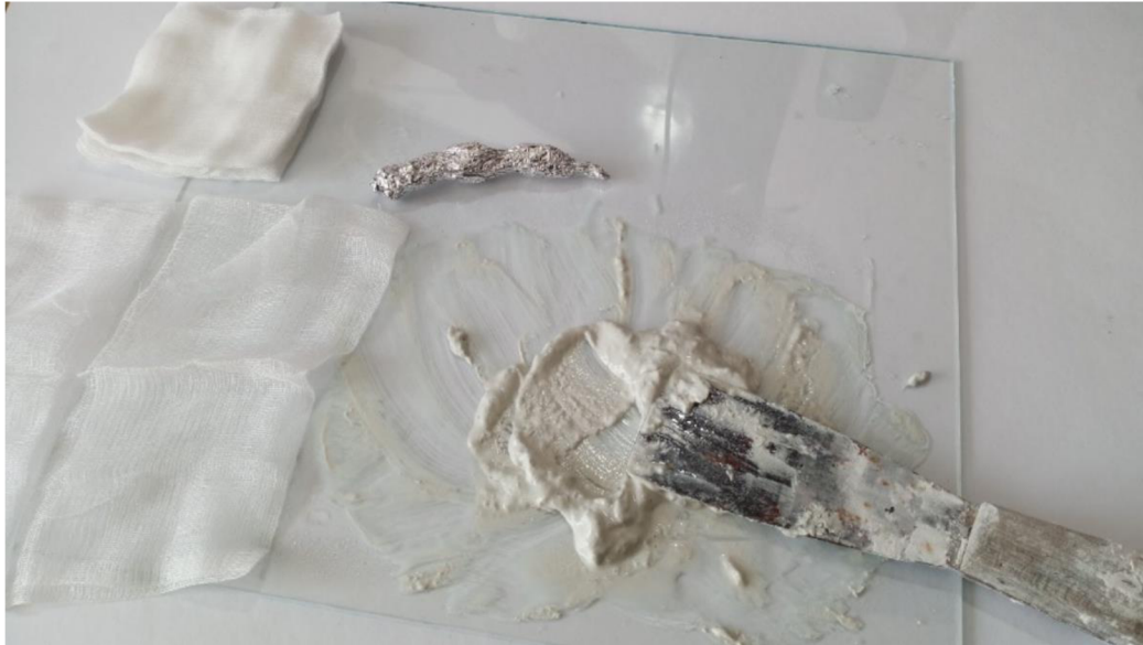
Obrázek 15: Příprava kaše z Fimo hmoty a základ prstu z hliníku.