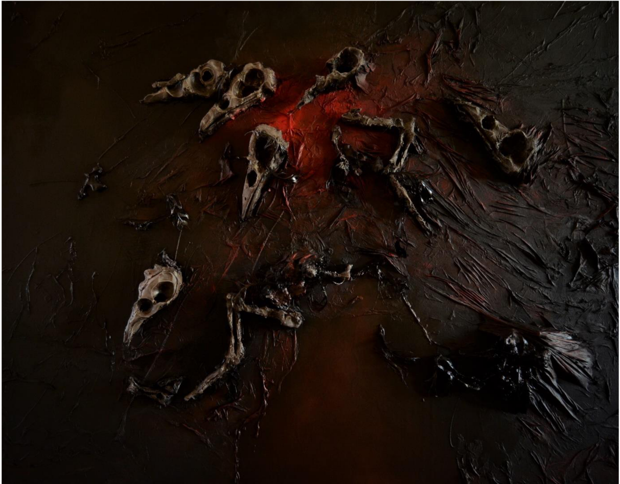
Obrázek 11: Dokončený objekt Peklo s lidmi.

Obraz zachycuje stylizované ptačí lebky, kosti zvířat a peří na černém zvrásněném pozadí. Černé mastné slepené peří může odkazovat na ptáky vyplavené z moře po ropné havárii. Červená skvrna v centru obrazu prvoplánově symbolizuje barvu krve, ale též vystavuje červenou stopku lidskému destruktivnímu počinání. Textura a zvrásnění díla jako rány na duších zvířat nucených žít s člověkem prostupují celým prostorem. Po lidském počinání toho ze zvířat příliš nezbude, proto není dílo poseto kostrami, ale dominují pouze lebky, neúčinný odpad biovýroby. Mrtvá zvířata topící se v černotě nemají před zlým počináním člověka úniku ani spásy. Jsou odsouzeni k bídě a utrpení, což je podtrženo barevností obrazu.