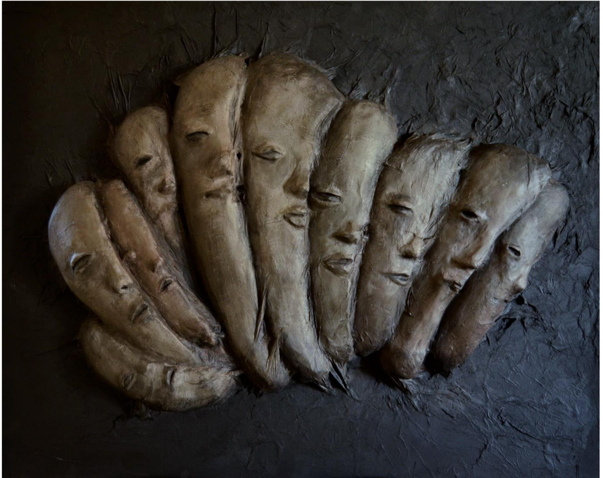
Obrázek 14: Dokončený objekt Peklo v člověku .

Myslím si, že je vhodné, aby se každý pokusil projít si procesem hledání interpretace tohoto díla, neboť jeho cílem je hlubší poznání sebe samotného. Objekt pojednává o změnách osobnosti a identity, a i já sama jsem v průběhu jeho tvorby pracovala hned s několika myšlenkami, a proto z mého úhlu pohledu nemá vyhraněnou interpretaci.