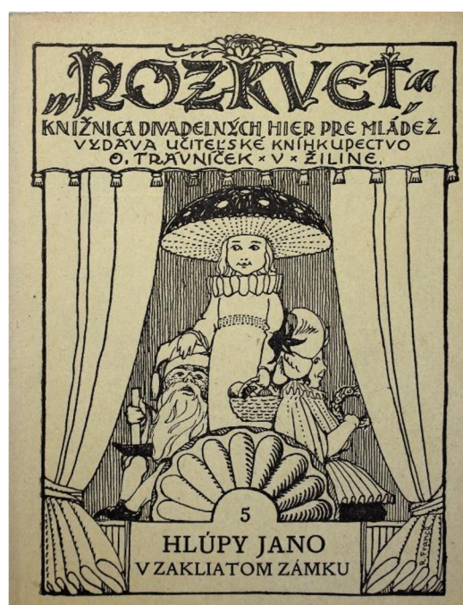
Obr. 8: Obálka slovenského vydání hry Honza v zakletém zámku ; 1922.