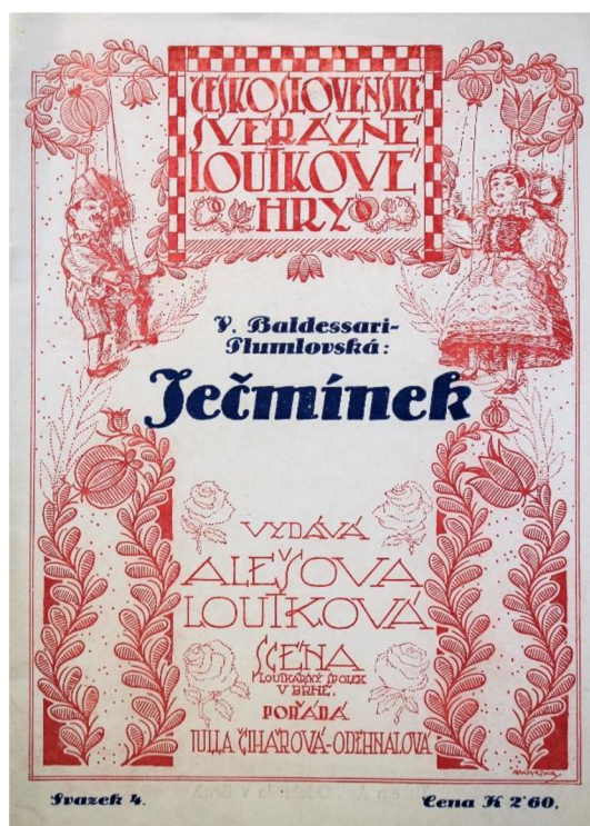
Obr. 11: Obálka hry Ječmínek z Knihtiskárny Antonína Odehnala v Brně; 1919.