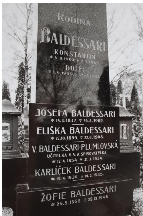
Obr. 5: Hrobka rodiny Baldessari, kde je pochována i Vojtěška Baldessari Plumlovská; Ústřední hřbitov v Olomouci.