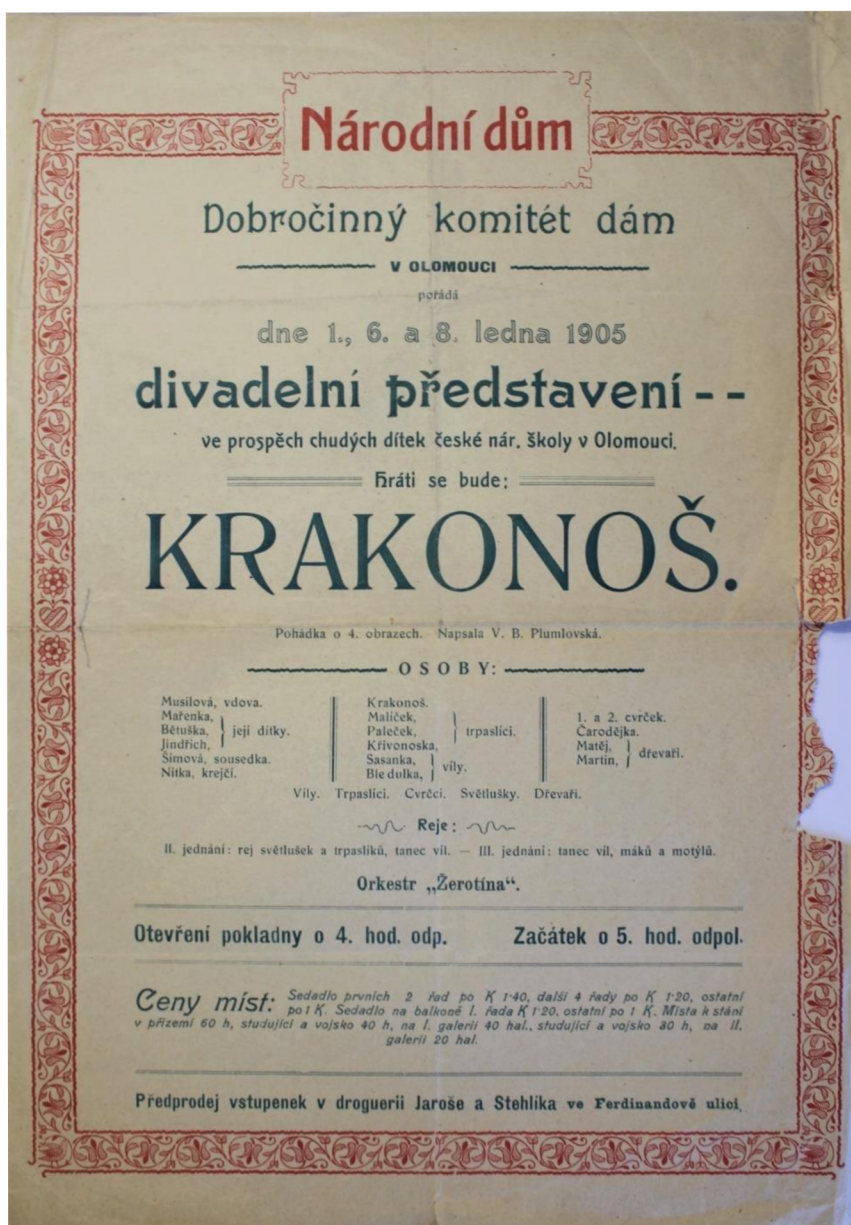
Obr. 9: Plakát k divadelnímu představení hry Krakonoš ; 1905.