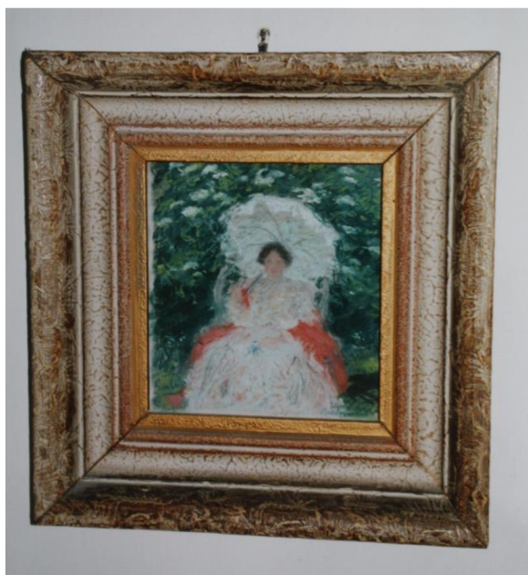
Obr. 4: Portrét Vojtěšky Baldessari Plumlovské od Maxe Švabinského; rok neznámý.