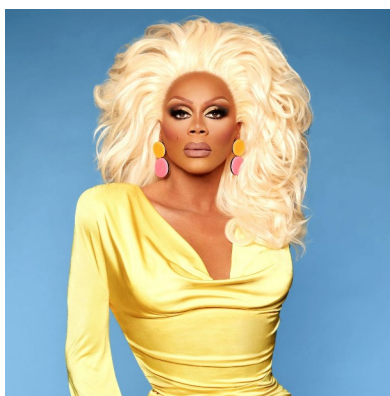
Obr. 1: drag queen RuPaul.

"Narodil jsem se nahý a zbytek je drag." 13