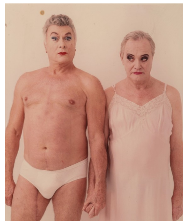
Obr. 26: Annie Leibovitz. Tony Curtis a Jack Lemmon . Los Angeles, 1995 (pro Vanity Fair ).