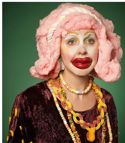
Obr. 20: Cindy Sherman.