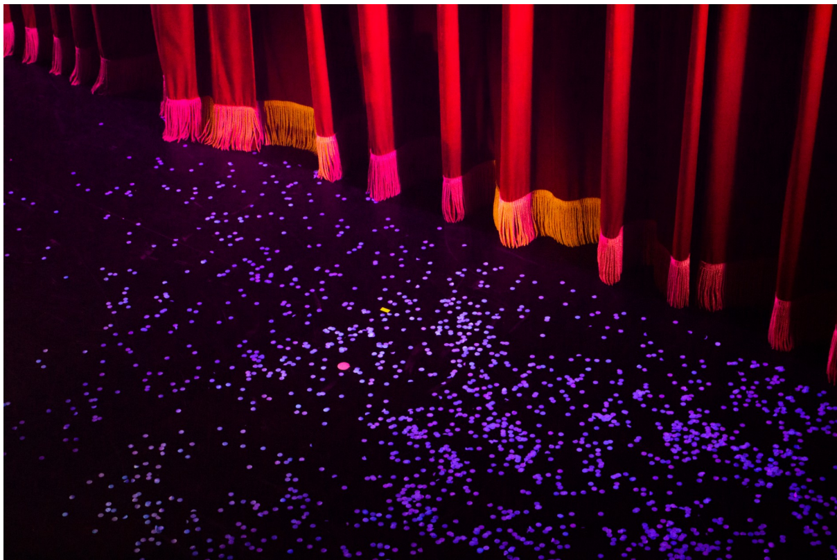
Obr. 48: Anna Nerušilová. Show, Cabaret des Péchés, Brno, 2024