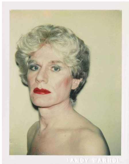
Obr. 10: Andy Warhol. Self-Portrait in Drag , 1982.

Celkově lze říci, že se stal ikonou moderního umění a jeho práce neovlivnila jen umělecký svět, ale i širší kulturní a společenskou rovinu. Andy Warhol zemřel v roce 1987 (ve věku 58 let) na pooperační komplikace. 34