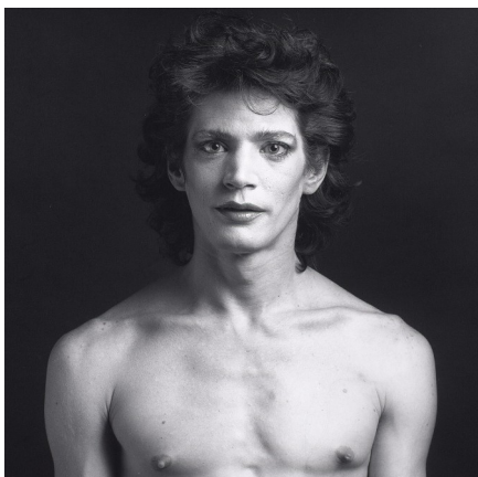
Obr. 21: Robert Mapplethorpe. Self Portrait , 1980.