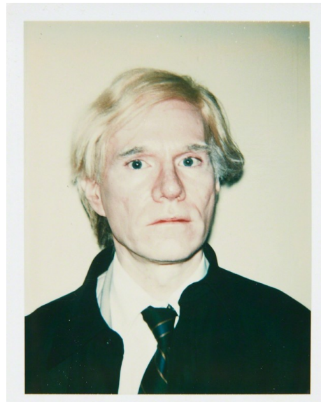
Obr. 11: Andy Warhol. Self-Portrait , 1977.