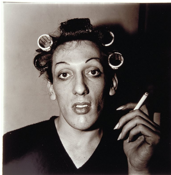
Obr. 18: Diane Arbus. A Young Man in Curlers , 1966