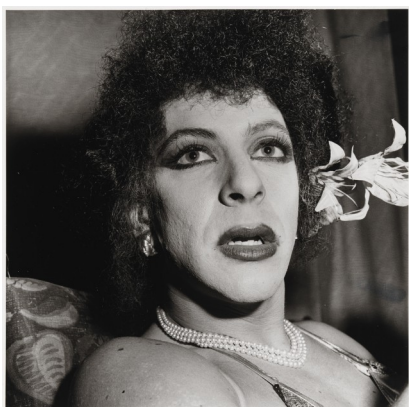
Obr. 14: Peter Hujar. Drag Queen With Flower in Hair , Halloween. 1980.

Hujar miloval drag a fotil nejednu osobu. Uchvátil ho prvek transformace a to, jak její účastníci měnili povahu genderu. Svými fotografiemi ukazuje, že drag není jen muž v šatech, ale že jde o identitu osobnosti. Fotografie působí skoro až jako obrazy, vytvořené v šatnách divadel či nočních klubů. Fotografoval i ateliérové portréty v jeho skromném studiu na East Street. Používal jemné osvětlení a bílou zeď na pozadí. Charakteristickým znakem je i čtvercová kompozice. 36