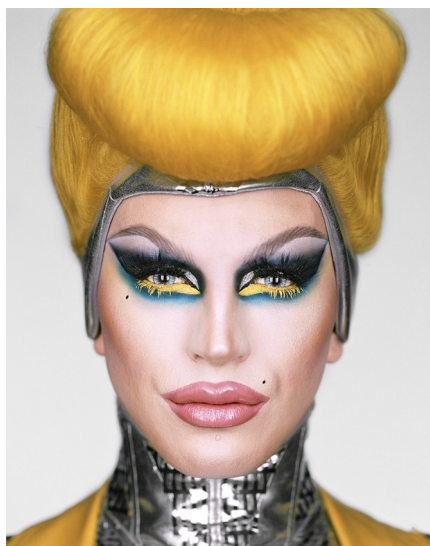
Obr. 29: Martin Schoeller. Aguaria (z cyklu Dragcon ). 2020.

V roce 2020 nafotografoval projekt DragCon , kde zobrazil podoby celkem 37 drag queens z pořadu RuPaul's Drag Race . Projekt byl publikován v časopisu New York Magazine . 63