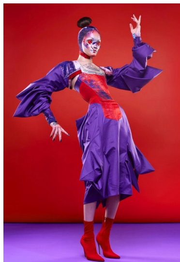
Obr. 34: Hungry . 2019.

Mé první přímé setkání s drag queen proběhlo v galerii Telegprah v Olomouci, kde jsem v roce 2022 navštívila show Miss Petty (viz s. 16). Tehdy jsem šla „obhlédnout situaci“ a ověřit si, jak taková drag show probíhá. Podruhé jsem se pak s komunitou setkala na duhovém průvodu Prague Pride 2022 , kde jsem je pouze zdálky obdivovala.