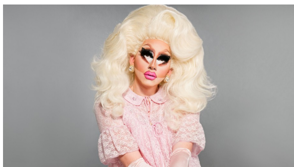
Obr. 3: Trixie Mattel

Další významnou účastnicí soutěže je Bob the Drag Queen , vlastním jménem Caldwell Tidicue. Vyhrála titul America's Next Drag Superstar v 8. sérii RuPaul's Drag Race . 17 Společně s drag queen Monét X Change založili kosmetickou značku BOMO Beauty . 18 Dále se soutěže zúčastnily významné drag queen jako například Aguaaria, Sasha Colby či Symone.