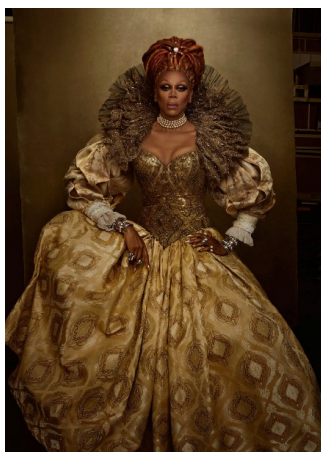
Obr. 24: Annie Leibovitz Rupaul (pro Vogue ). 2019.

V roce 2007 vytvořila Annie Leibovitz slavné oficiální portréty královny Alžběty II, v zahradě a interiérech Buckinghamského paláce. 56 Portrétovala i mnoho dalších významných osobností – Patti Smith, Keitha Haringa či Johna Lennona a Yoko Ono (v roce 1980, pár hodin předtím než se John Lennon stane obětí vraždy). 57 Vyfotografovala i dvojici herců Tonyho Curtise a Jacka Lemmona, známých z filmu Někdo to rád horké , kde sehráli hlavní role. Dva jazzové hudebníky, kteří chtějí zapadnou do dívčí kapely. Fotografie vznikla v zákulisí uprostřed jejich proměny v ženy. 58