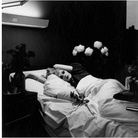
Obr. 16: Peter Hujar. Candy Darling on Her Deathbed , 1973.