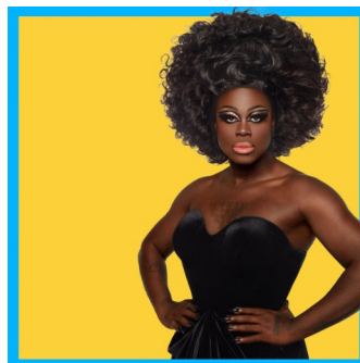
Obr. 4: Bob the Drag Queen .