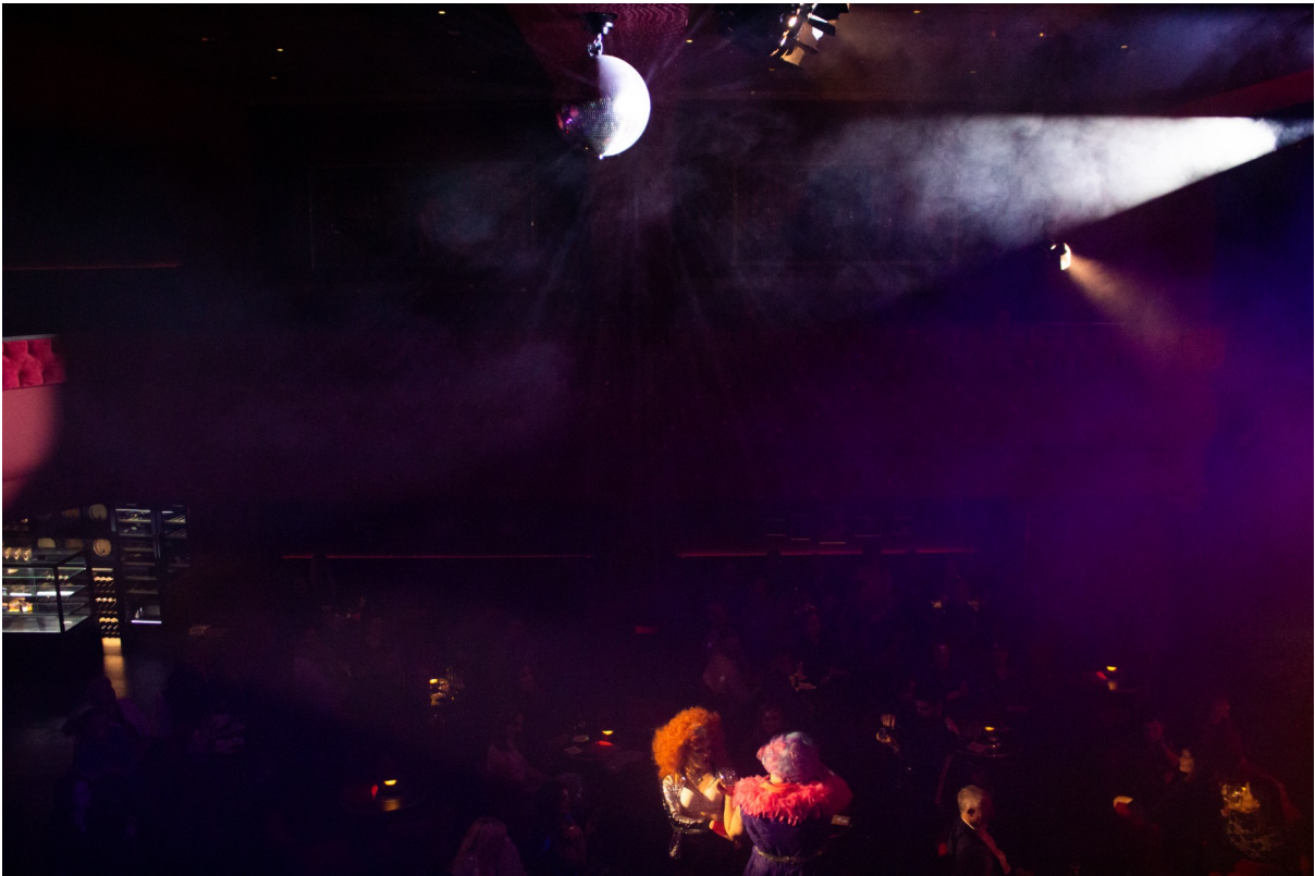
Obr. 47: Anna Nerušilová. Show, Cabaret des Péchés, Brno, 2024