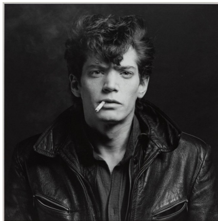
Obr. 22: Robert Mapplethorpe. Self Portrait , 1980.