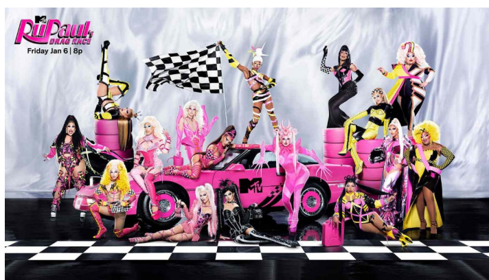
Obr. 2: plakát RuPaul's Drag Race , série 15.

Seriál oslavuje krásu dragu a pomohl tím přetvořit způsob, jakým společnost vnímá svět drag queens a celkově LGBT+ komunitu. Jde tedy o mnohem více, než jen soutěžní reality show. Koncept je jednoduchý: zakladatel, moderátor a porotce RuPaul hledá America's Next Drag Superstar . Drag queens soutěží proti sobě ve výzvách, které testují jejich kreativitu, humor a dovednosti. Na konci každého dílu je pak zpravidla vyřazena jedna královna, finále je vyvrcholením dané série. Vítěz získává finanční odměnu a další výhody.