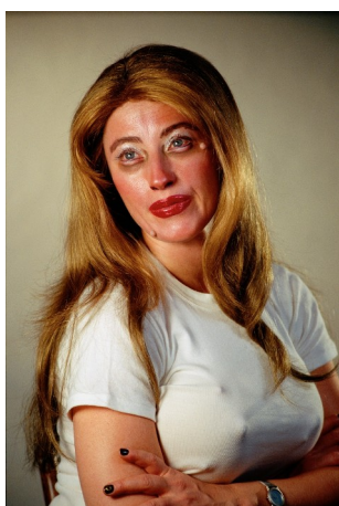
Obr. 19: Cindy Sherman. Untitled #360 . Z cyklu Headshots , 2000.

Její průlomová série je Untitled Film Stills (1977) je inspirovaná černobílou filmovou fotografií, objevuje se zde vyobrazena ve stereotypních ženských rolích. 43 V letech 2000-2002 pak vytvořila sérii snímků Headshots , zabývající se problematikou stárnutí žen. K dalším jejím slavným souborům řadíme například Sex Pictures nebo Horror Pictures . 44 Patří do neoficiální skupiny umělců – Pictures Generation , kam spadá i Robert Longo nebo Richard Prince. Spojoval je zájem o kritiku masmédií, zpochybnění autorství či identity. 45