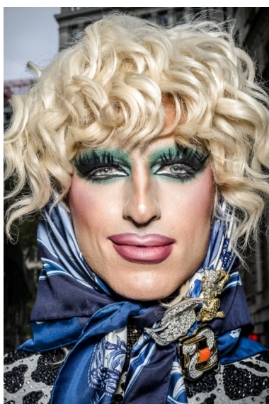
Obr. 27: Bruce Gilden. USA. NYC. 2019.

V roce 1998 se připojil k ikonické agentuře MAGNUM. 60 Kromě svých osobních projektů tvořil i pro značku Louis Vuitton či pro časopis New York Times. Fotografoval dvě legendární drag queens Milk a Lady Bunny jako módní editorial pro W Magazine, předvádějí extravagantní doplňky sezony (2019). 61