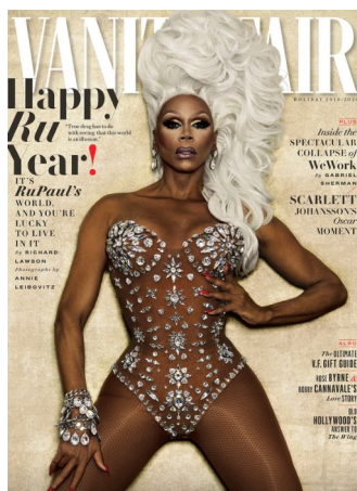
Obr. 25: Annie Leibovitz, obálka časopisu Vanity Fair , 2019/2020.