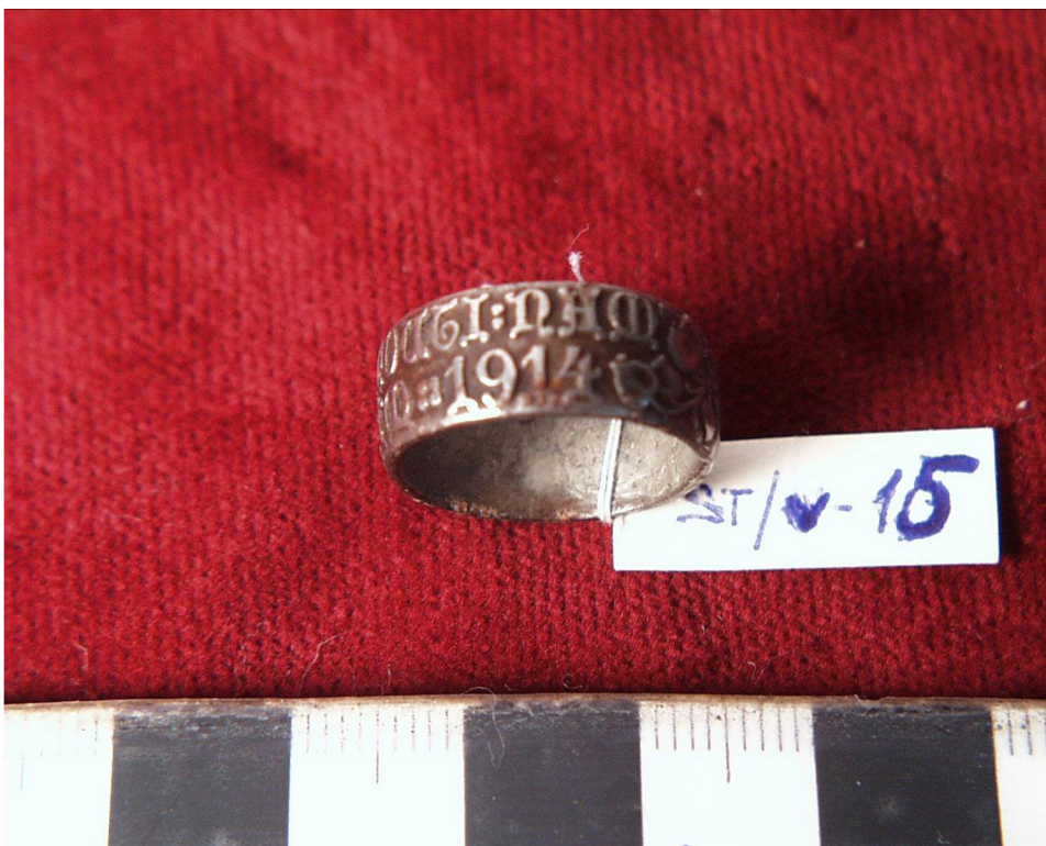
Obr. č. 7. ST/05-15 – Prsten královéhradeckého městského strážníka Karla Pecolda, památka na rok 1914