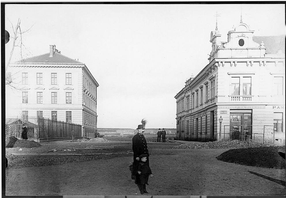
Obr. č. 8. HK/07-1541 – Strážník na hlídce v dnešní Opletalově ulici, poč. 20. století