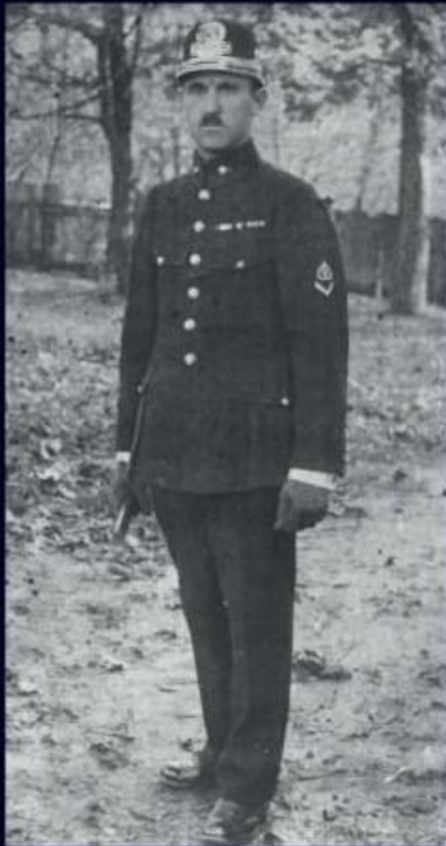
Strážník SUSB z roku 1924.