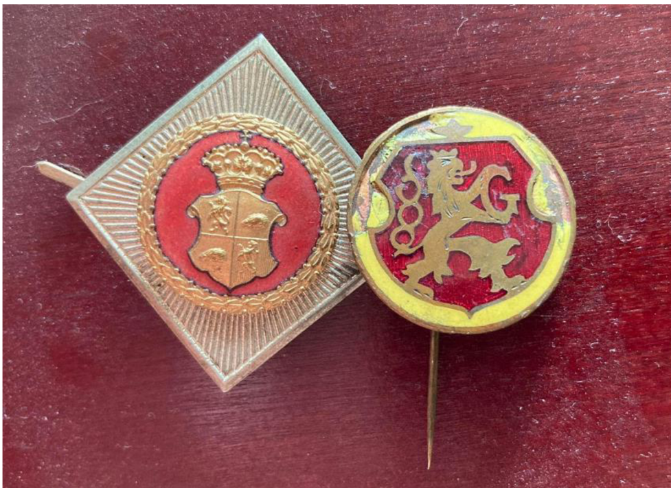
Obr. č. 18. – Hradecký a jihlavský odznak, soukromá sbírka, nspecifikované období