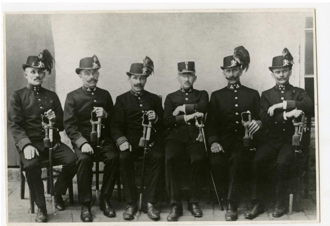
Obr. č. 4. (bez uvedeného inv. č.) HK policejní sbor 1916