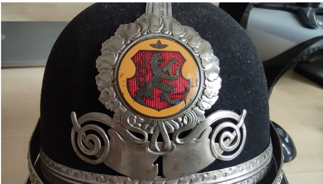
Obr. č. 20. – Hradecká přilba se žlutým odznakem, soukromá sbírka, nespecifikované období