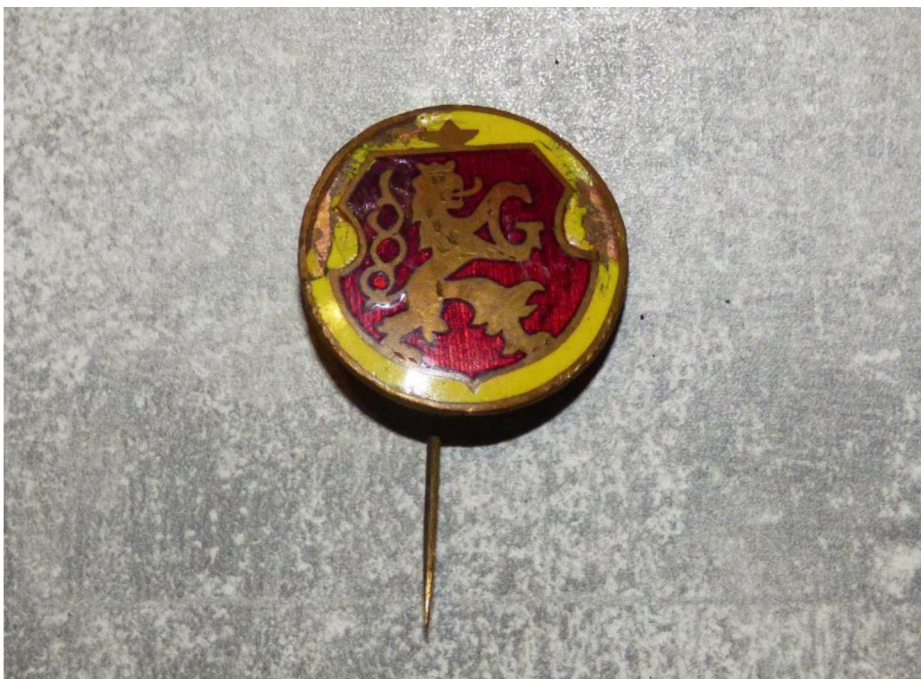
Obr. č. 17. – Hradecký žlutý odznak, soukromá sbírka, nespecifikované období