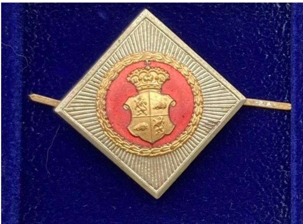
Obr. č. 19. – Jihlavský odznak, soukromá sbírka, nspecifikované období