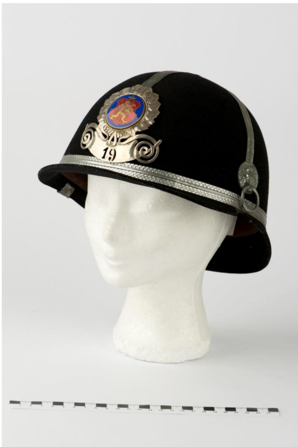
Obr. č. 16. - ST 04-03_low Přilba městské policie Hradce Králové, 30. léta 20. století