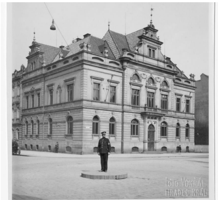
Obr. č. 11 – A2-HK-07-00691 – dostupné MVČ, bez popisku