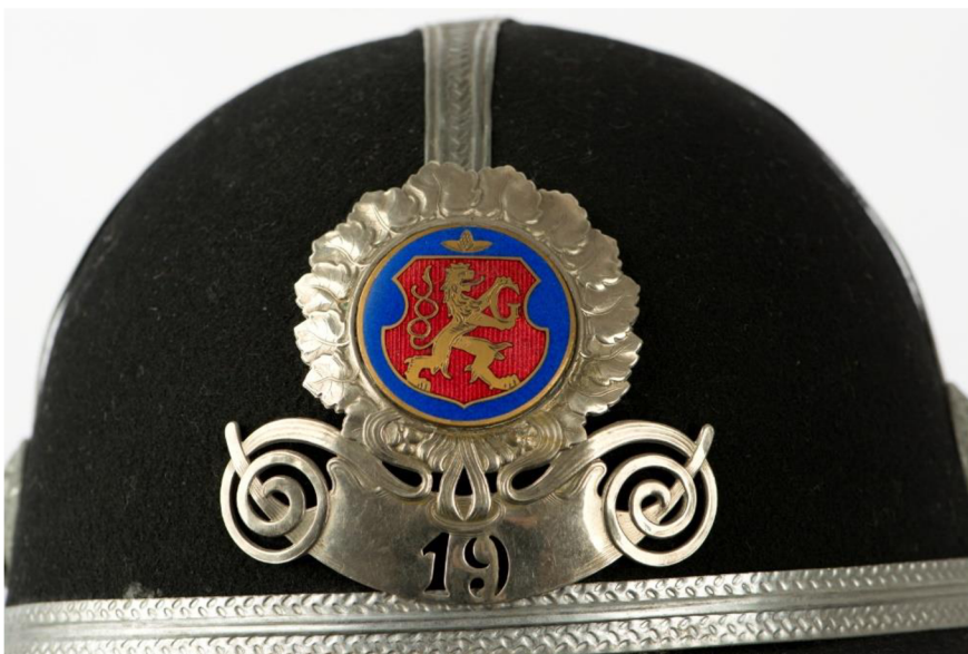
Obr. č. 15. - ST 04-003-X1_low Přilba hradeckého strážníka po roce 1931.