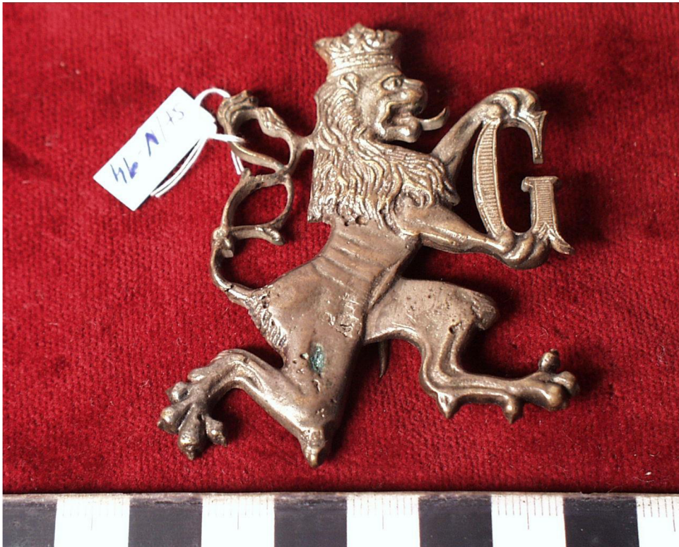
Obr. č. 6. ST/05-14 – Čepicový odznak městského strážníka Hradce Králové