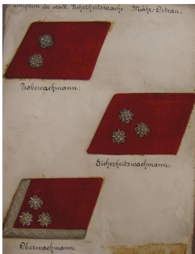
Obr. č. 5. – rakouské hodnostní označení pravděpodobně po r. 1900, soukromá sbírka