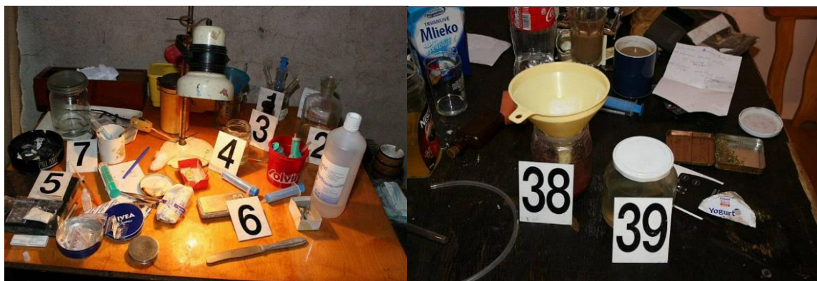
Obrázek 1 a 2: Varna pervitinu 97

Všechny nalezené stopy v nelegální laboratoři metamfetaminu se nezasílají ke zkoumání, z důvodu finanční i časové náročnosti. Po dohodě se znalcem se utvoří ucelený řetězec stop, který se zasílá ke znaleckému zkoumání z oboru chemie, který prokazuje ilegální výrobu metamfetaminu. Ostatní stopy jsou uloženy ve skladech. 96