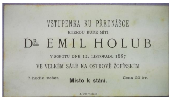
Obr. 4/ Vstupenka na jednu z Holubových přednášek, Náprstkovo muzeum, Praha