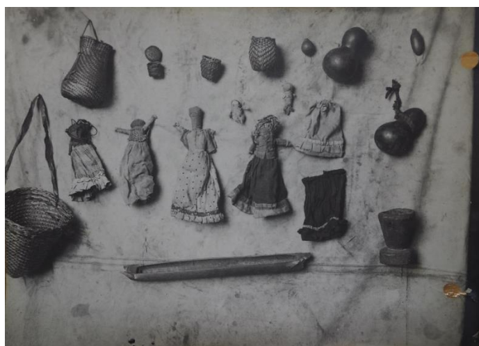
Obr. 26/ Instalace exponátů, 1913, fotografie, Náprstkovo muzeum, Praha