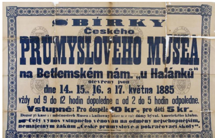
Obr. 1/ Plakát Náprstkovského Průmyslového muzea, Náprstkovské muzeum, Praha