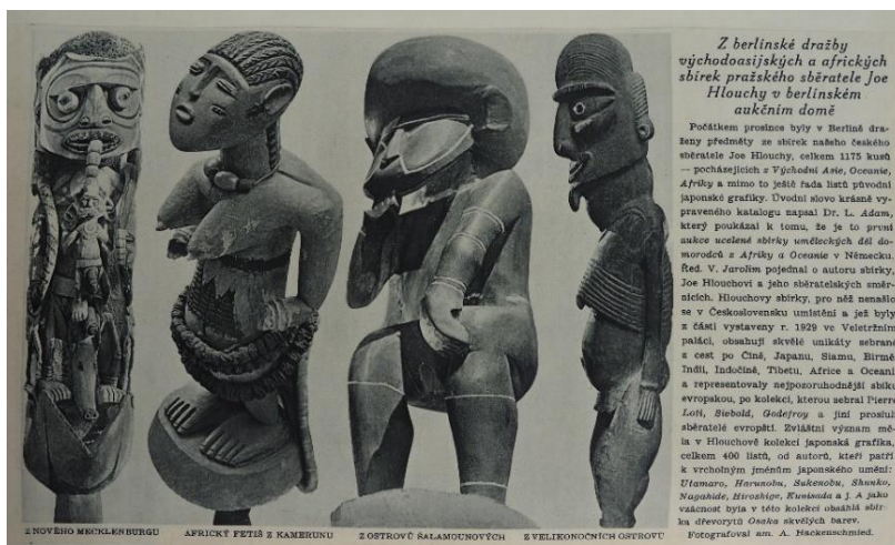
Obr. 17/ Fotografie k berlínské dražbě z článku v Pestrém týdnu V, 1930, č. 30, 13. 12., s. 1.