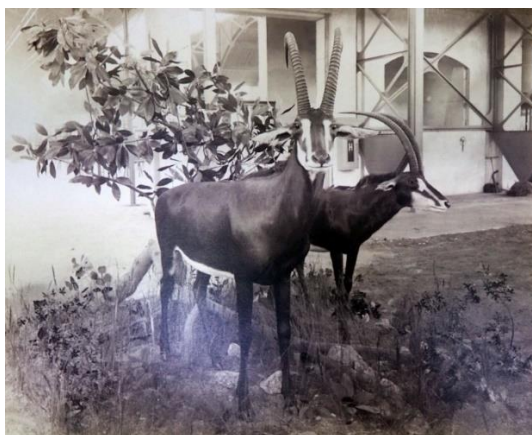
Obr. 9/ Jan Mulač, Pohled do výstavy jihoafrických sbírek Emila Holuba v Praze 1892, fotografie, 33 × 45 cm, Náprstkovo muzeum, Praha