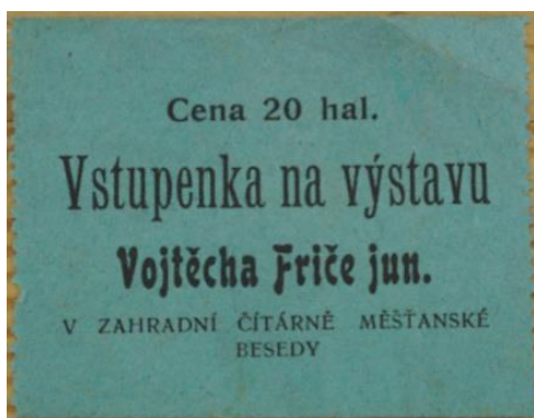
Obr. 22/ Vstupenka na výstavu A. V. Friče, 1902 Náprstkovo muzeum, Praha