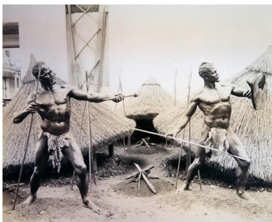
Obr. 8/ Jan Mulač, Pohled do výstavy jihoafrických sbírek Emila Holuba v Praze 1892, fotografie, 33 × 45 cm, Náprstkovo muzeum, Praha