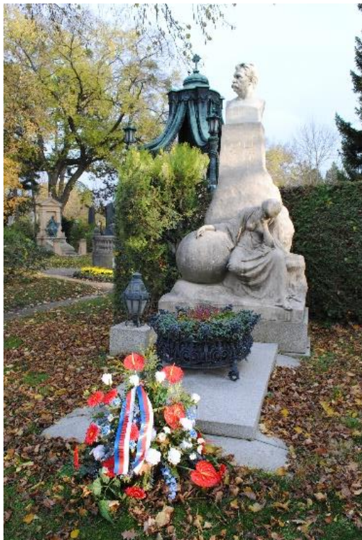
Obr. 2/ Pomník Emila Holuba, Zentralfriedhof Vídeň