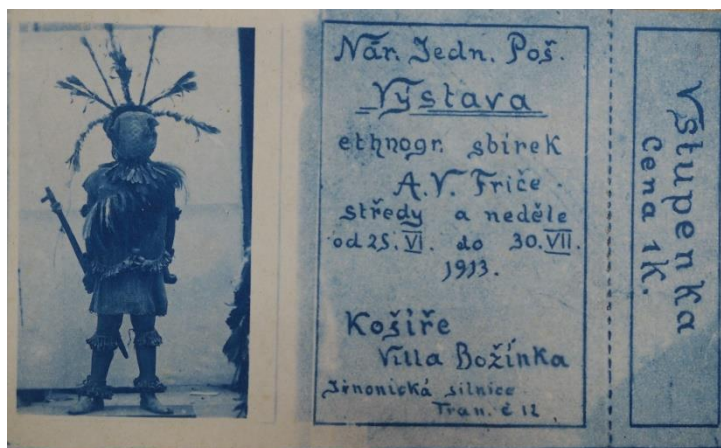
Obr. 27/ Vstupenka na výstavu ve vile Božínce, 1913, Náprstkovo muzeum, Praha