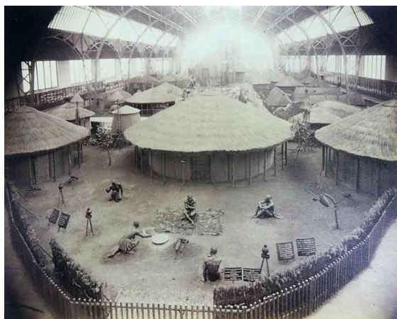
Obr. 7/ Jan Mulač, Pohled do výstavy jihoafrických sbírek Emila Holuba v Praze 1892, fotografie, 33 × 45 cm, Náprstkovo muzeum, Praha