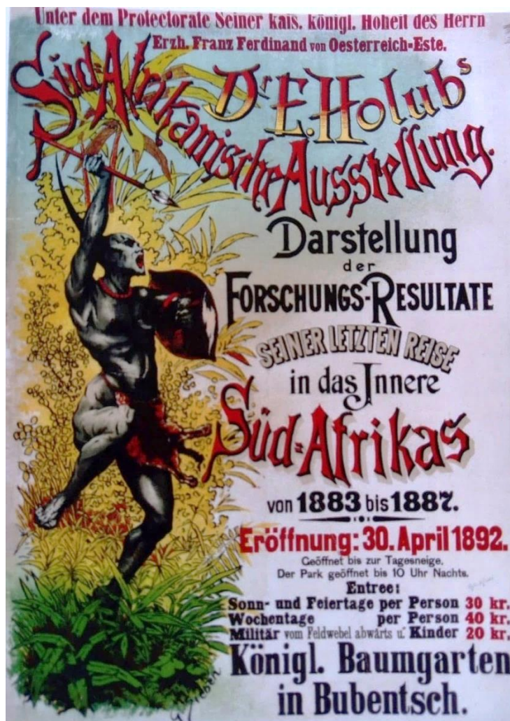
Obr. 10/ Gottfried Sieben, Plakát výstavy jihoafrických sbírek Emila Holuba v Praze 1892, barevná litografie, papír, 95 × 71 cm, Náprstkovo muzeum, Praha