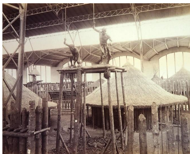
Obr. 6/ Jan Mulač, Pohled do výstavy jihoafrických sbírek Emila Holuba v Praze 1892, fotografie, 33 × 45 cm, Náprstkovo muzeum, Praha