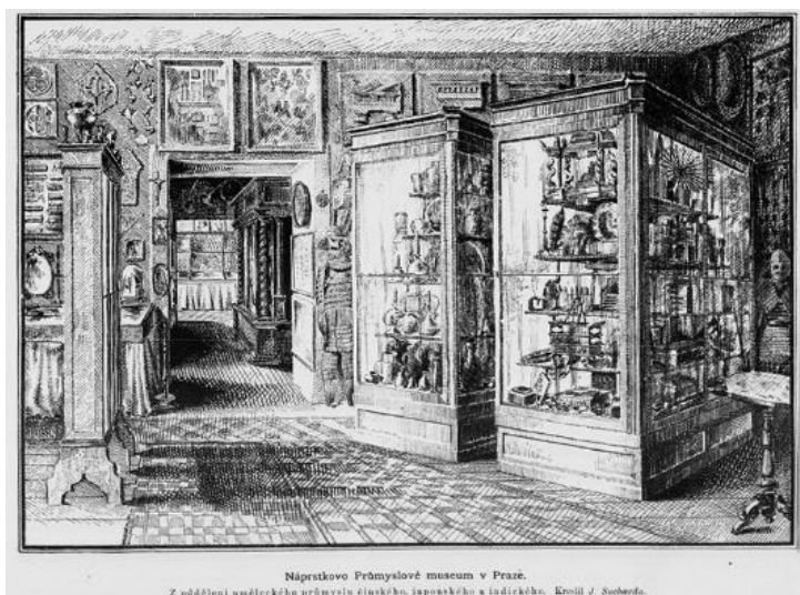
Obr. 5/ Pohled do expozice Průmyslového musea, kresba J. Sucharda, in: Anonym, Náprstkovo průmyslové muzeum v Praze, Světobzor IXX, 1885, č. 35, 14. 8., s. 558