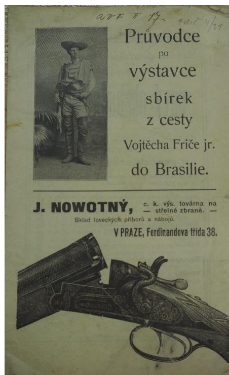
Obr. 23/ Katalog Fričovy výstavy, 1902, Náprstkovo muzeum, Praha