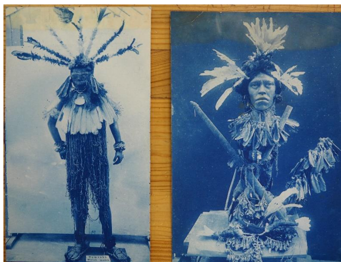
Obr. 24/ Figuríny vystavené ve vile Božínce, 1913, kyanotypie, Náprstkovo muzeum, Praha