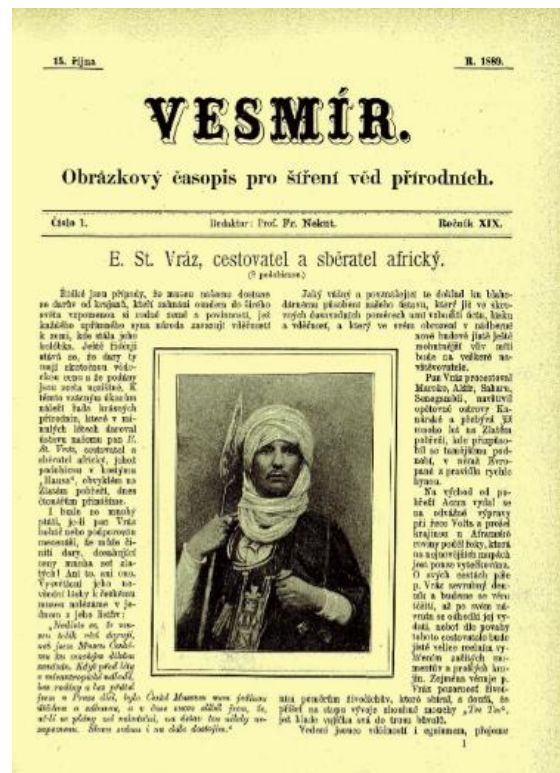
Obr. 3/ Titulní strana časopisu Vesmír XIX, 1889, č. 1, s článkem a fotkou E. St. Vráze