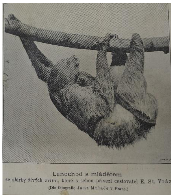
Obr. 12/ Plakát Vrázovy výstavy u Halánků, Náprstkovo muzeum, Praha