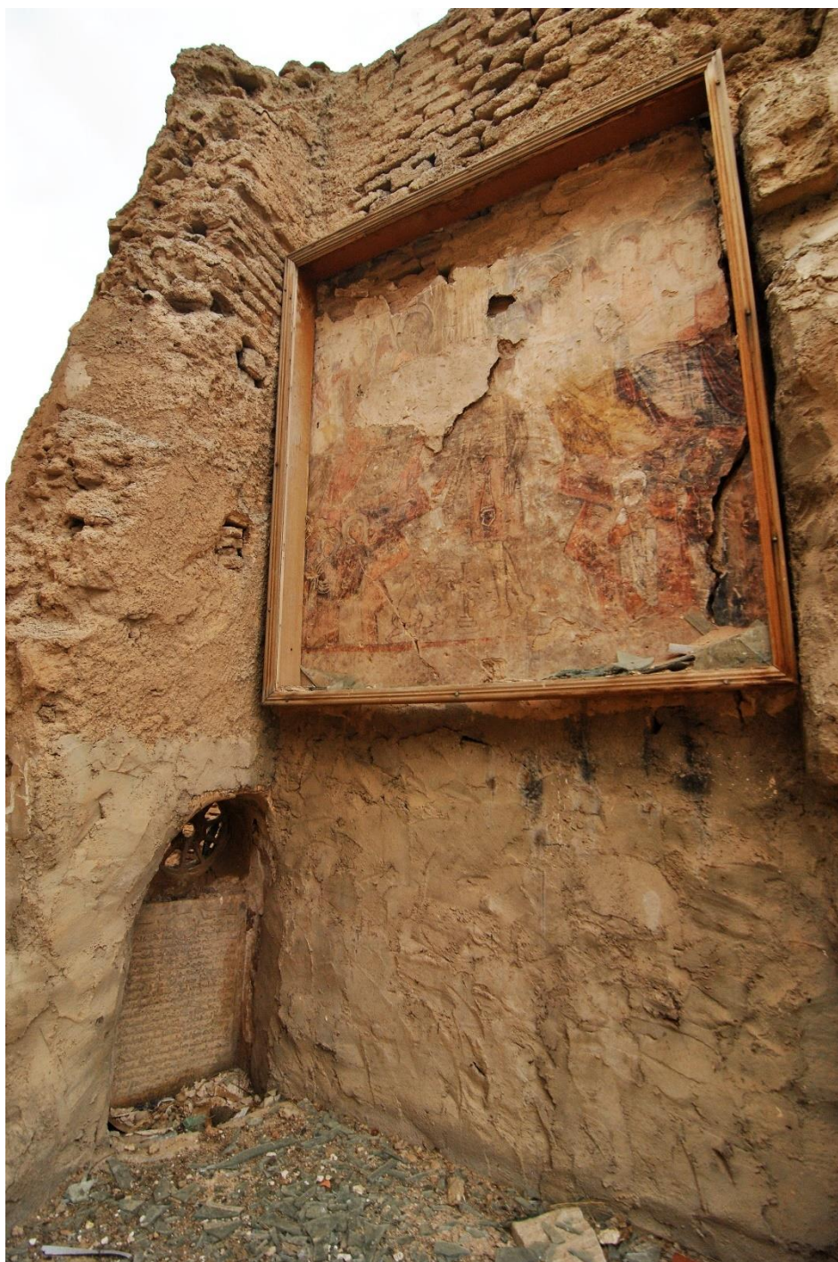
Částečné zbavení tváří v kostele sv. Jiřího, Qaraqoš, duben 2017.