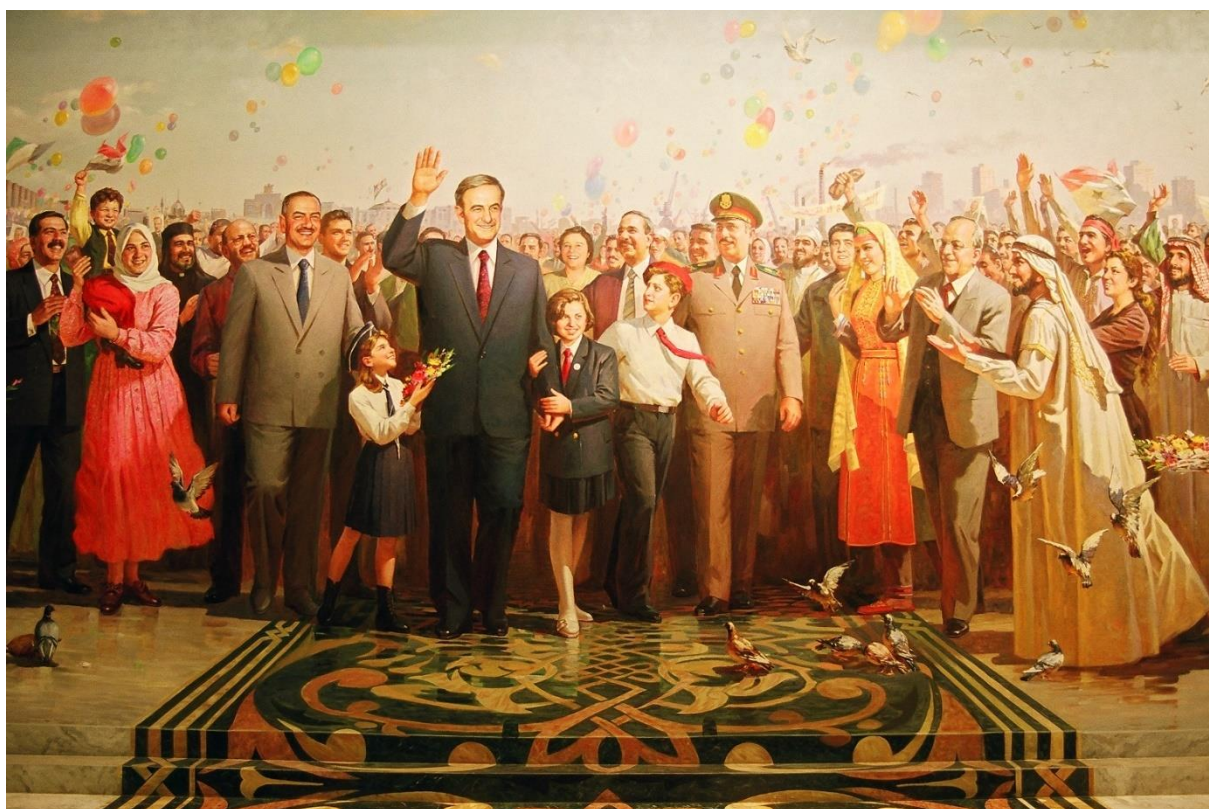
Háfez al-Asad v obležení Syřanů: multináboženská a multietnická sekulární společnost. Na obrázku je kněz a voják, o kus dál za nimi muslimský duchovní. Na pozadí industriální a historické budovy.