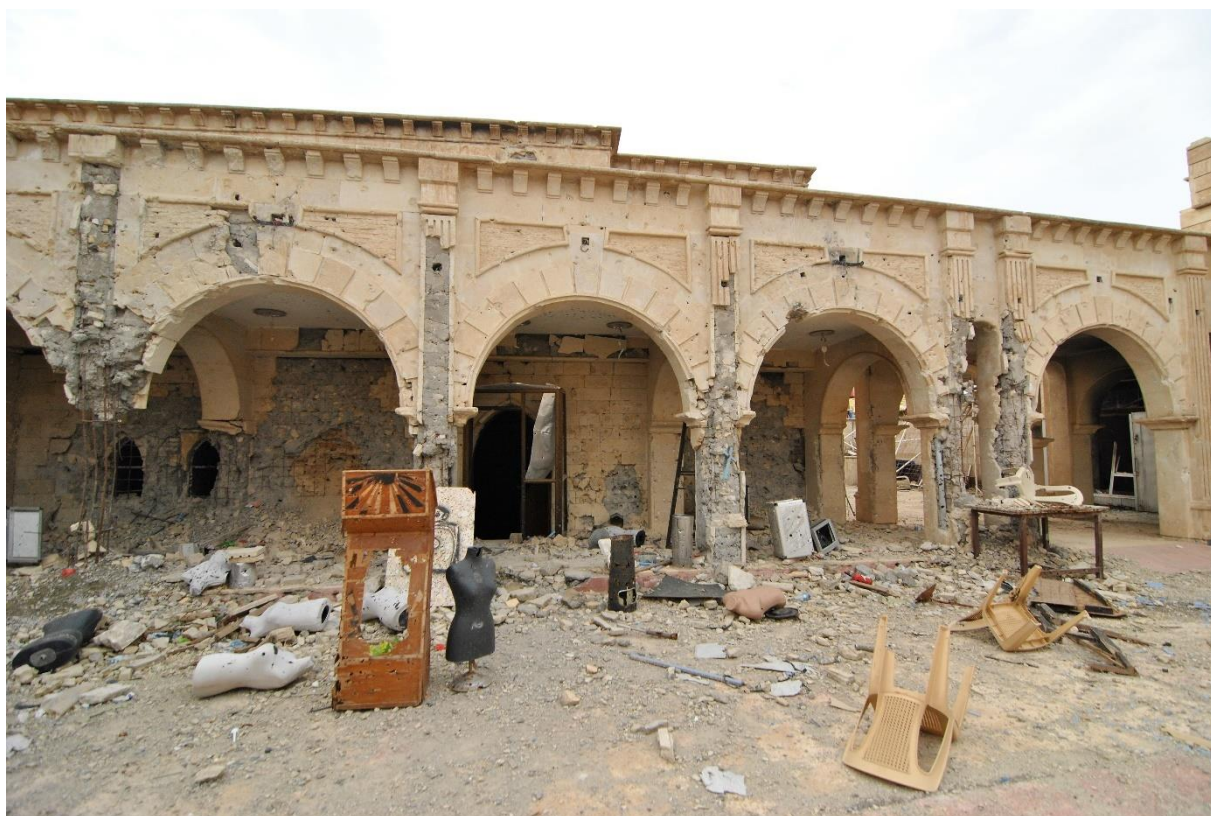
Kostel Panny Marie Imakuláty, Qaraqoş, duben 2017.