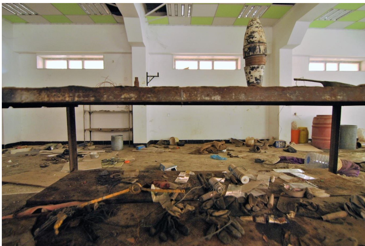
Interiér fary kostela sv. Jiřího s materiálem na výrobu trhavín, Qaraqoş, duben 2017.