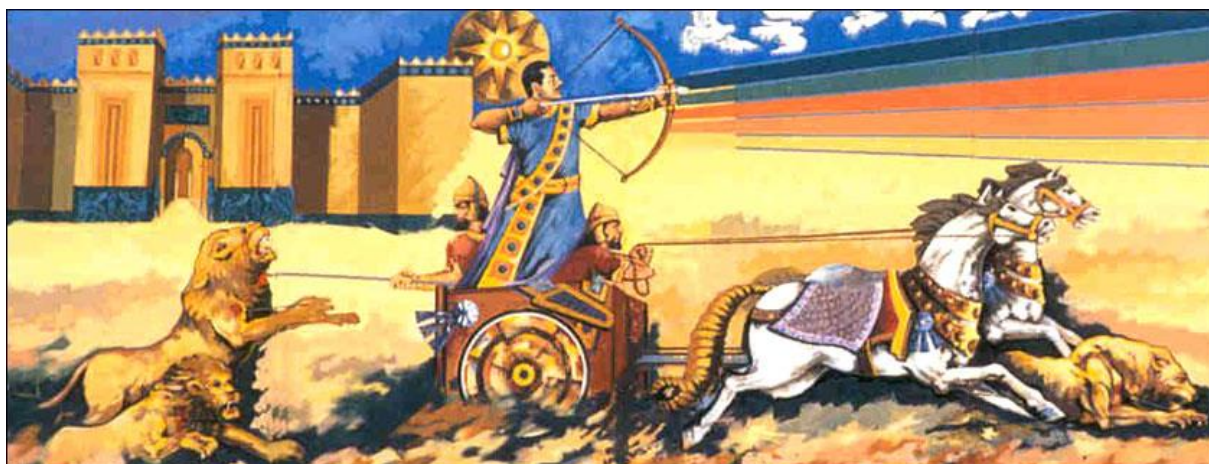
Saddám Husajn jedoucí na spřežení ve stylu starověkého krále Aššurbanipala.