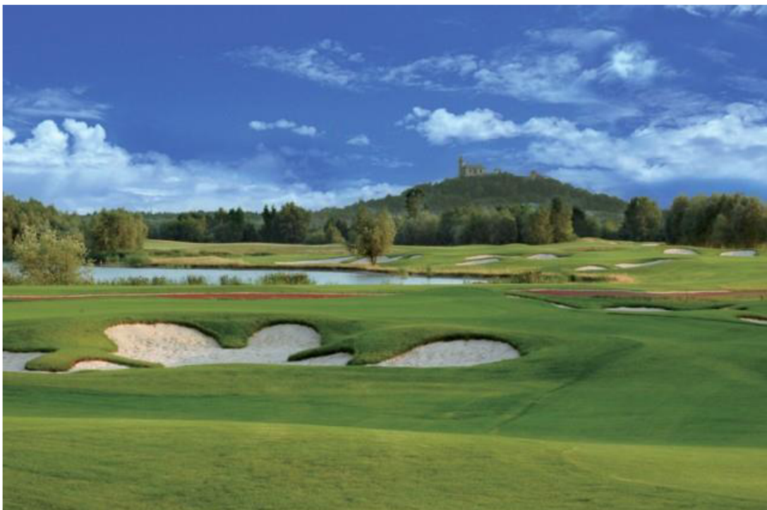
Obr. 5 – Golfové hřiště v Dřítči (Katalog obcí ČR - https://www.cestujemepocr.cz/Obec/Detail/3584/Dritec ).

Pardubický okres je známý díky sportu. Největším sportovním objektem v mikroregionu pod Kunětickou horou je resort Golf & Spa Kunětická hora ve Dřítči. Samotné 18-ti jamkové golfové hřiště bylo vybudováno na bývalém odkališti Opatovické Elektrárny (Svazek obcí pod kunětickou horou). Pravidelně se zde hostí prestižní golfové soutěže, mezi které patří i European Challenge Tour. Zařízení disponuje více než 140 lůžky (Golf & Spa Kunětická hora). Areál poskytuje komplexní golfové vyžití včetně indoorgolf simulátorů, masážní a relaxační wellness centrum, tenisové kurty, minihřiště s umělou trávou a plážový volejbal (Katalog obcí ČR). Obvykle sem zavítají účastníci kongresové turistiky. Místo bývá cílem konání svateb, konferencí, či incentivních firemních programů.