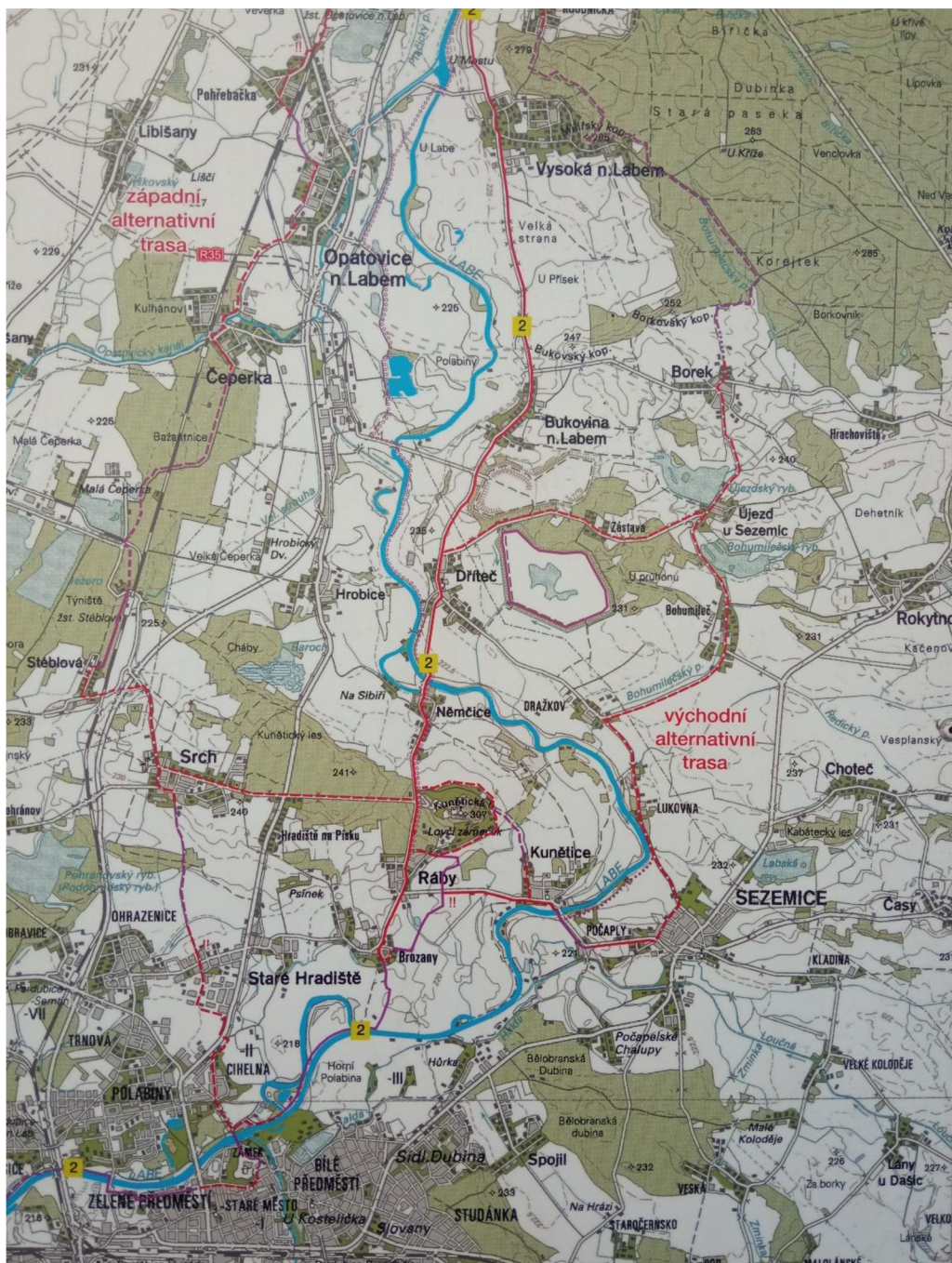
Obr. 12 - Trasy cyklostezek (Labská stezka - https://www.labskastezka.cz/ )