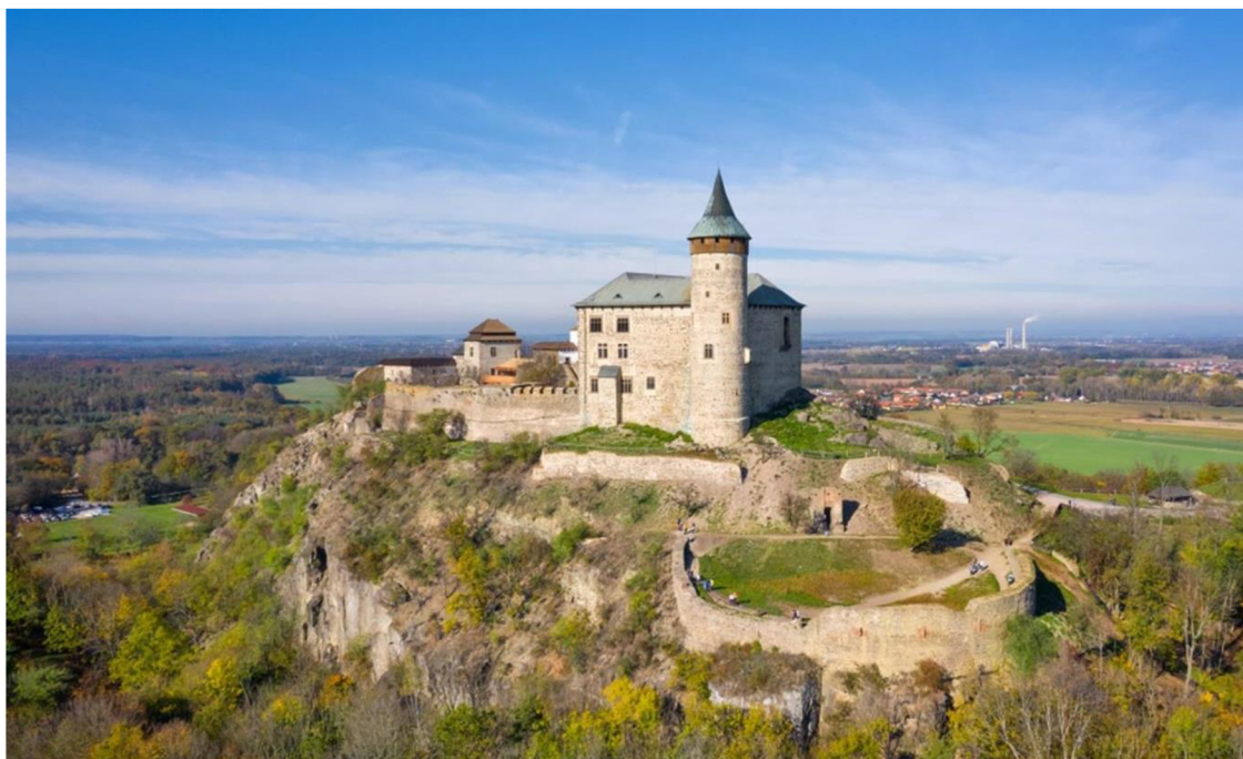
Obr. 3 – Kunětická hora (Kudy z nudy - https://www.kudyznudy.cz/aktuality/rekonstrukce-hradu-kuneticka-hora-vtiskne-pamatce ).

Konají se zde mimo jiné obvykle i různé festivaly, tím nejznámějším je hudební festival České hrady. V okolí hradu se kromě vyhlídkových míst, restaurací s penzionem a jiného občerstvení nachází mnoho dalších cílů, například výběhy se zvířaty, jako jsou jeleni, daňci, kozy, ovce a další s možností jejich krmení. Dále pak trampolínové centrum nebo i ranč, který provozuje nezisková organizace, jež se zabývá chovem českých zvířat a nabízí jízdy na koních pro děti, ale i dospělé (Restaurace pod Kunětickou horou).