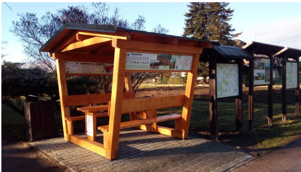
Obr. 8 - Infopoint obce Sezemice (Region Kunětické hory 21. století - https://www.venkov21stoleti.cz/rkh/infopointy.asp )