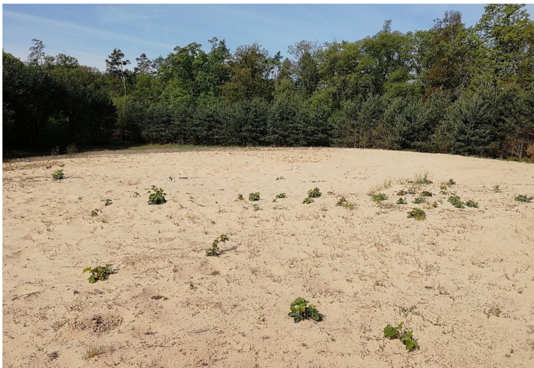
Obr. 7 – Vesecký kopec.

duny pocházejí z mladšího pleistocénu až holocénu (Mackovčín a Sedláček, 2002). Přesypy u Rokytna jsou přírodní rezervace, vyhlášena roku 1982. Tvoří ji 0,5 km dlouhý a 200 m široký pás. Území je pokryto lesním porostem, převážně borovicí lesní. Žije zde mravkolev dunový, který je v Čechách vzácný (David a Soukup, 2011). Přesyp u Malolánského je přírodní památka, která se od ostatních přesypů odlišuje výskytem kriticky ohrožené ostríci pískomilné. Tento druh rostliny je rozšířen v nížinách severozápadní a střední Evropy, další nejbližší lokalita je v Horní Lužici v Německu. V takovém množství se v Česku vyskytuje ostrice pískomilná pouze zde (David a Soukup, 2011). Daří se jí pouze jen na okrajích lesa. Rozvoj její populace by tak vyžadoval proředění nebo úplné vykácení porostu (Mackovčín a Sedláček, 2002). Vesecký kopec u Sezemic, předtím, než byla jeho většinová část odtěžena, byl považován za nejvyšší písečnou dunou v České republice (BOTANY.cz). Mezi typické ptactvo patří pěnice černohlavá, kos černý, pěnkava obecná, strakapoud velký a hrdlička divoká. Spatřit lze i ještěrku obecnou a slepýše křehkého (David a Soukup, 2011).