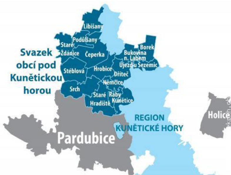
Obr. 1 - Mapa Svazku obcí pod Kunětickou horou a Regionu Kunětické hory (Svazek obcí pod Kunětickou horou - https://svazekpkh.oblast.cz/tema/tema.phtml?id=5024 ).

V praktické části následuje popis faktorů lokalizačních, selektivních a realizačních, které mají dopad na rozvoj cestovního ruchu v regionu. Po uvedení těchto faktorů následuje jejich analýza a následné návrhy na zlepšení potenciálu. V této kapitole je upřesněna lokalita, na kterou je práce zaměřena. Zkoumanou destinací je mikroregion pod Kunětickou horou a okolní obce Regionu Kunětické hory znázorněné na obr. 1. Přestože se jedná o rozlohou menší území, mají toho mikroregiony mnoho co nabídnout. Mikroregion pod Kunětickou horou se nachází na severu okresu Pardubice. Jeho území je definováno společenstvím obcí spadajících do spolků, jež společně spolupracují na jejich rozvoji. Na dvou níže uvedených mapách je vyobrazeno území obcí, které jsou součástí dvou hlavních takovýchto spolků.