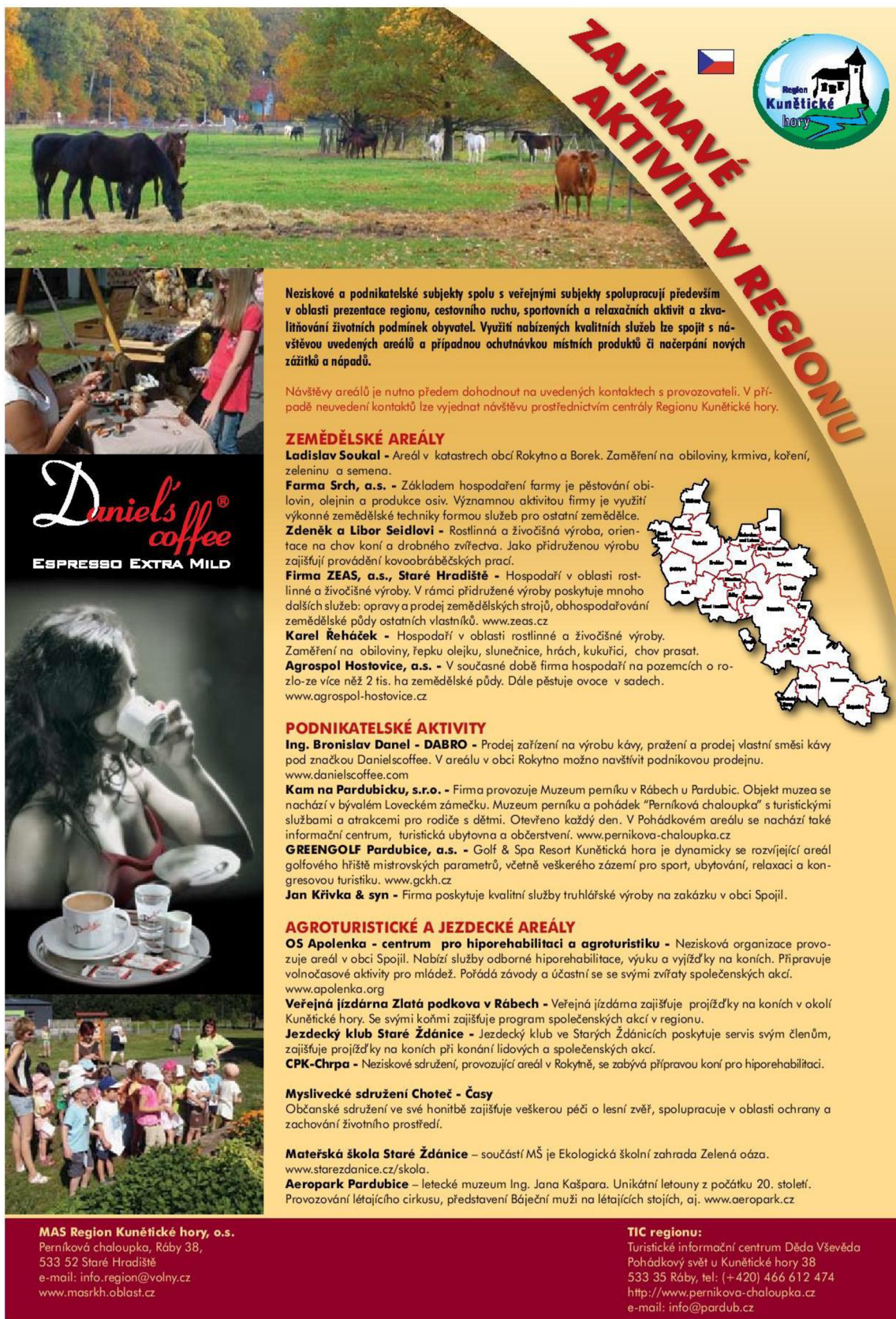
Obr. 10 - Propagační materiál Zajímavé aktivity (MAS Region Kunětické hory - https://www.masrkh.oblast.cz/tema/tema.phtml?id=10314 )