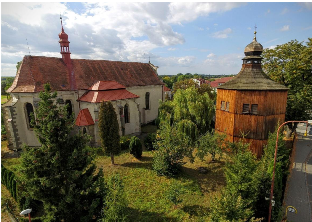
Obr. 4 – Dřevěná zvonice a kostel Nejsvětější Trojce v Sezemicích (Region Kunětické hory 21. století -

https://www.venkov21století.cz/rkh/fr.asp?tab=venkov21rkh&id=264&burl=&pt=TCSE ).