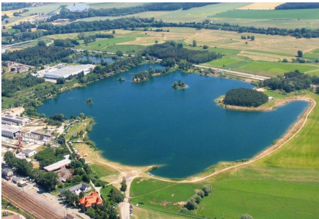
Obr. 6 – Písník u Opatovic nad Labem (Opatovice nad Labem - https://www.opatovicenadlabem.cz/image.php?nid=17849&oid=8179660 ).

Dalšími dvěma populárními přírodními koupališti jsou písníky Oplatil a Hrádek v obci Stéblová. I zde se nachází několik zařízení s občerstvením. Na místě se konalo několik festivalů a pravidelně se zde pořádají závody v triatlonu (Turistika.cz). Stojí zde také kemp a společně s ním je v úmyslu v okolí vybudovat sportovně-rekreační areál – středisko vodních sportů a přispět tak k rozvoji cestovního ruchu v místní oblasti (Marina Kemp Stéblová).