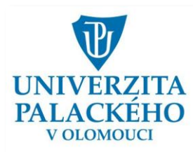
Obrázek 2 Logo Univerzity Palackého v Olomouci