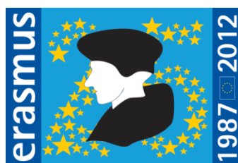
Obrázek 1: Logo k výročí programu Erasmus

Program ERASMUS 6 , který se řadí mezi programy Celoživotního učení ( Lifelong Learning Learning – LLP ), patří mezi nejúspěšnější výměnné programy pro vysokoškolské studenty. Komisařka pro vzdělávání, kulturu a mnohojazyčnost Androulla Vassiliou (EK, 2012) uvedla: „Erasmus je jedním z úspěchů Evropské unie. Je jejím nejznámějším a nejoblíbenějším programem. Výměnné pobyty v rámci tohoto programu dávají studentům možnost, aby si zlepšili znalost cizích jazyků a rozvíjeli dovednosti, jako je přizpůsobivost, které zlepší jejich vyhlídky na zaměstnání.“ Každý rok se za podpory tohoto programu účastní zahraničních mobilit více než 230 000 studentů. Studentům nabízí možnosti studia na zahraničních univerzitách či získat zkušenosti z pracovní stáže. Od roku 2007 program nabízí podporu také pro výměnu akademických či administrativních pracovníků a pro projekty mezinárodní spolupráce mezi univerzitami. (EK, 2013)