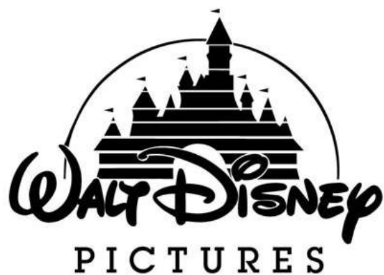
Obr. 14: Různá Loga společnosti Walt Disney