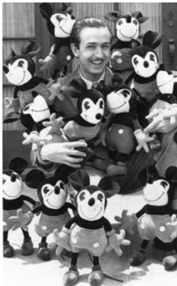
Obr. 1: Mladý Walt Disney v obležení Mickeymoušů