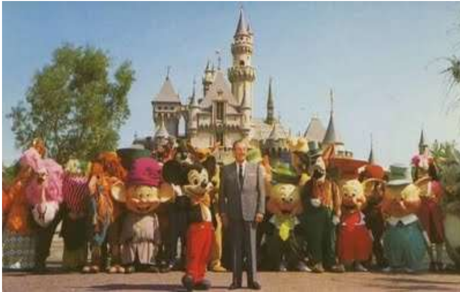
Obr. 7: Slavnostní otevření prvního Disney parku (1955)