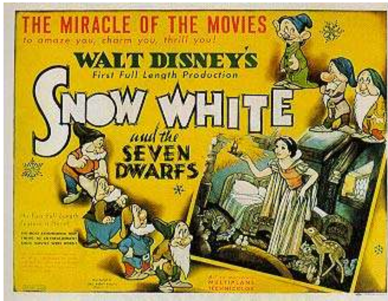
Obr. 5: Plakát k filmu Sněhurka a sedm trpaslíků (1937)