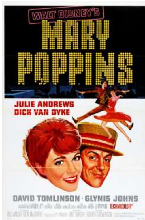
Obr. 9: Úspěšná Mary Poppins (1964)