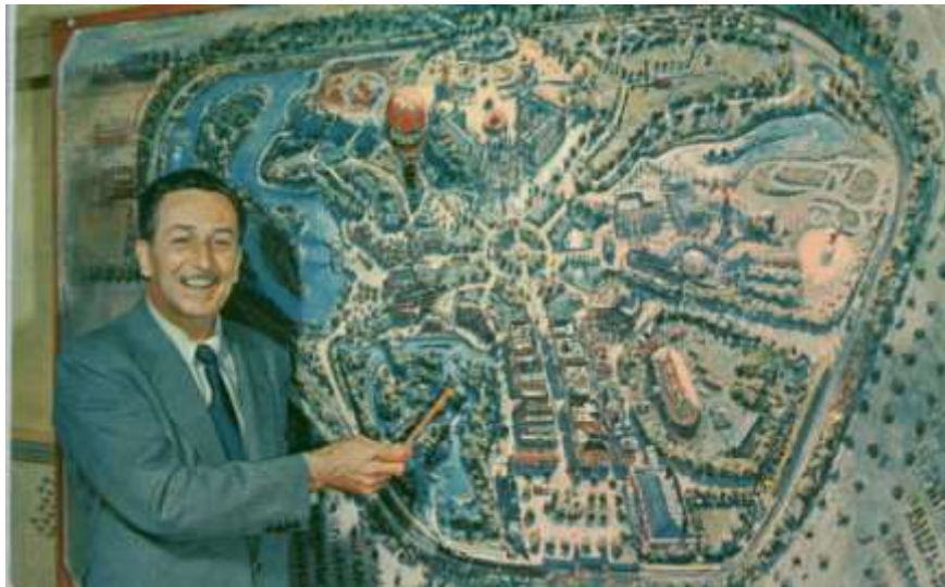
Obr. 6: Walt Disney před mapou Disneylandu v Californii