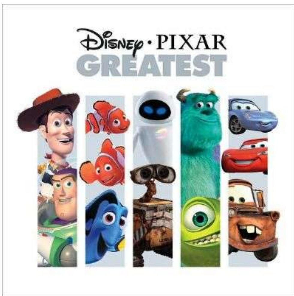
Obr. 11: Spolupráce s Pixarem.