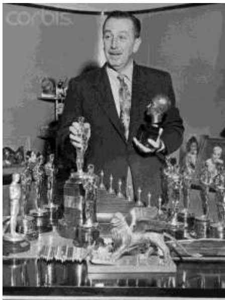
Obr. 2: Starší Walt Disney v obležení tentokrát různých ocenění.