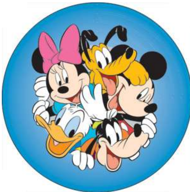
Obr. 4: Mickey Mouse a přátelé – Pluto, Goofy, Donald, Minnie