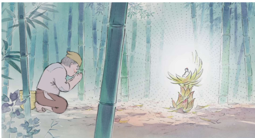
Obr. 1 První setkání Sběrače a princezny

Kaguya roste na kráse a přitahuje mnoho nápadníků. Pokusí se ji získat pět šlechticů – Kaguya jim řekne, že se vdá jen za toho, kdo jí přinese jeden z darů, které jim uloží získat. Během čekání na jejich návrat se Kaguja s matkou vydají zpět na venkov, aby se podívaly na rozkvetlé sakury. Po návratu náhodně spatří Sutemaru, kvůli jejímu novému postavení se však nemohou setkat. Kagujini nápadníci se mezitím postupně vrací, dva z nich se snaží princeznu podvést, jeden zemře (z čehož je Kaguja velmi zoufalá a cítí se provinile), jeden se rozhodne, že mu za výpravu princezna Kaguja nestojí a princ Išicukuri donese místo misky květinu spolu s nádhernými sliby, místo Kaguji na něj ale čeká jeho manželka. Nakonec zájem projeví i samotný císař, i toho ale stejně jako v původním příběhu odmítne. Kaguja pak rodičům s pláčem oznámí, že pochází z Měsíce a že si pro ni její lid brzy přijde. Začnou přípravy na obranu zámku. Kaguja se naposledy vrátí na venkov a setká se se Sutemaruem, který už má ženu a dítě. I přesto jí nabídne, že spolu mohou utéct, což Kaguja přijme. Létají spolu v objetí po obloze, nakonec ale Kaguja zmizí a Sutemaru se probudí sám na louce. Kaguja se opět vrací do zámku, kam si pro ni přijde Nebeský lid. Rozloučí se s rodiči, a v posledním záběru se se slzami v očích naposledy dívá na Zemi.