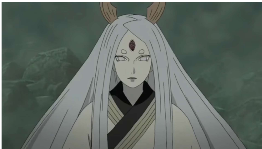
Obr. 2 Ócucuki Kaguja s otevřeným třetím okem

rudé třetí oko a vyrostou jí na hlavě dva rohy, které připomínají králičí uši. Menší zajímavostí je to, že Kaguja nosí roucho s potiskem magatama (勾玉). 62