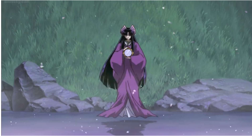
Obr. 3 Kaguja během boje s Inujašou

Můžeme vidět, že tento film se nechal Taketori monogatari inspirovat relativně ve velké míře, kromě samotné Kaguji zde figuruje pět darů, o které princezna Kaguja žádá své nápadníky, vidíme zde také velkou důležitost nebeského roucha, jenž je spojeno s nesmrtelností. V jeho spojitosti se zmiňuje také příběh o nebešťance, která se přijde na Zemi vykoupat. 66 Samozřejmě zde figuruje i samotná hora Fudži, o které původní příběh hovoří na konci. Kaguja také cituje pasáže z původního příběhu, zejména pak když se objevují předměty, které ji mají osvobodit. Například po získání ohnivého roucha říká: „Kdybyste věděl, jak rychle tento plášť shoří, neseděl byste zde tak bezstarostně.“ 67 Kaguja také v první scéně, kde se objevuje, cituje císaře Mikada: „Již se nikdy nesetkat, slzy smutku přetékají v hloubi mého srdce, nač mi je elixír života, na ničem nezáleží.“ 68 Samotná Kaguja je pak typicky zápornou postavou, která nehledí ani na své blízké – v tomto případě pomocnice, které ji vysvobodily. Od původní