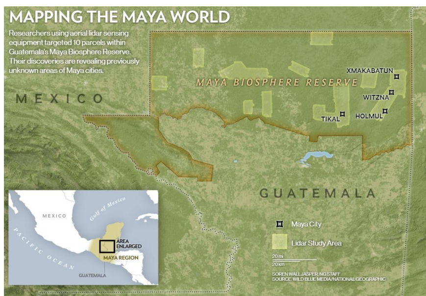
Obrázek 4: Území, kde proběhl výzkum pomocí systému Lidar a oblasti, které díky němu byly zaznamenány.

Výzkumný projekt byl vedený guatemalskou nadací Pacunam , která se zabývá vědeckým výzkumem, udržitelným rozvojem a ochranou kulturního dědictví. Projekt je plánovaný na 3 roky, toto byla jen jeho první fáze. Odhaduje se, že bude zmapováno dalších 14 000 km 2 guatemalského území. Vědci doufají, že díky objevu nových lokalit a následnému pochopení, kdo Mayové ve skutečnosti byli, budou nově objevená místa více chráněna. (Clynes, 2018)