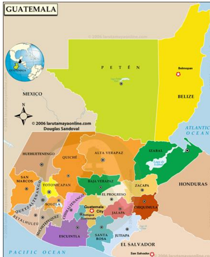
Obrázek 1: Mapa - rozdělení Guatemaly dle departamentů (22)