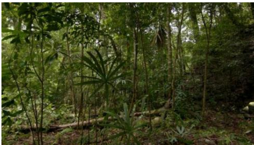
Obrázek 5:Území před objevením mayských pyramid. (zdroj: Clynes, 2018)