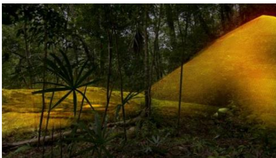
Obrázek 6:Staré mayské pyramidy objevené díky systému Lidar.