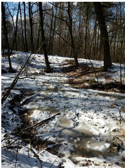
Studovaná lokalita (okolí PP) - březen 2018