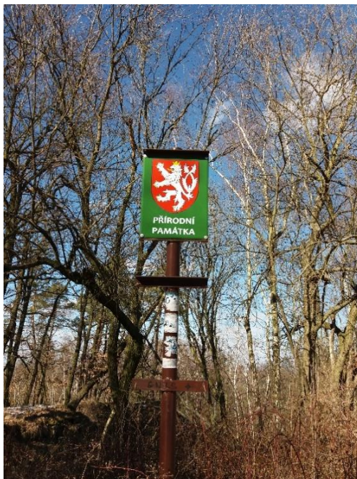
Označení přírodní památky

Příloha č. 1: Fotodokumentace – autorka Jaryna Maciborska, 2018