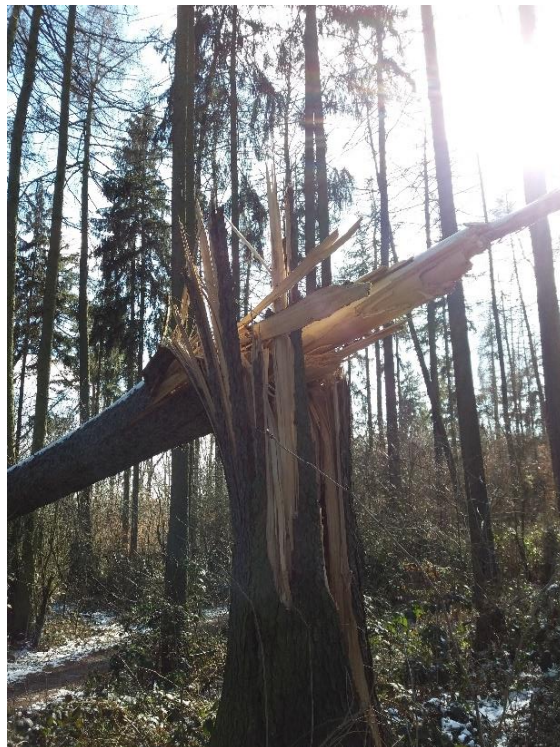
Detail neodstraněného zlomeného stromu