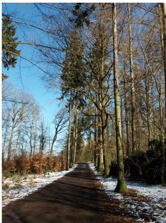
Stezka ohraničující přírodní památku