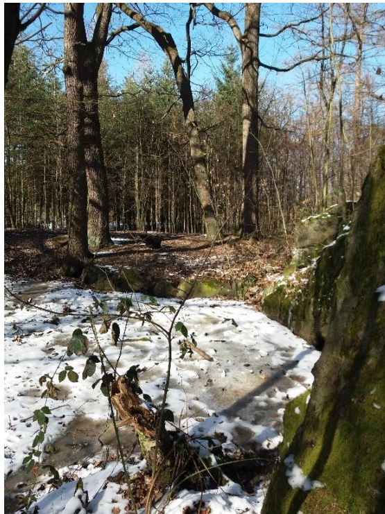
Svah u bulžňníkové skály