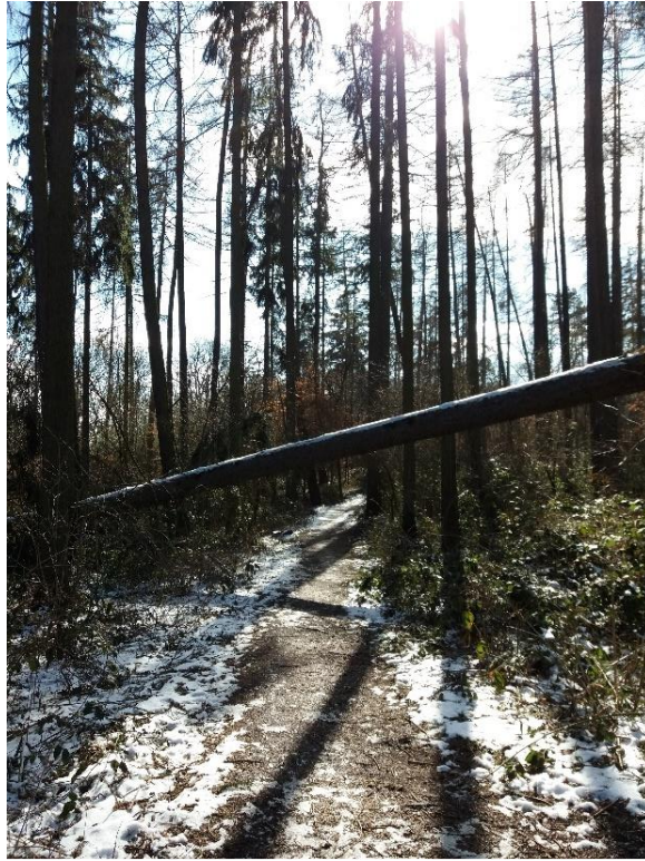
Neodstraněný strom přes stezku