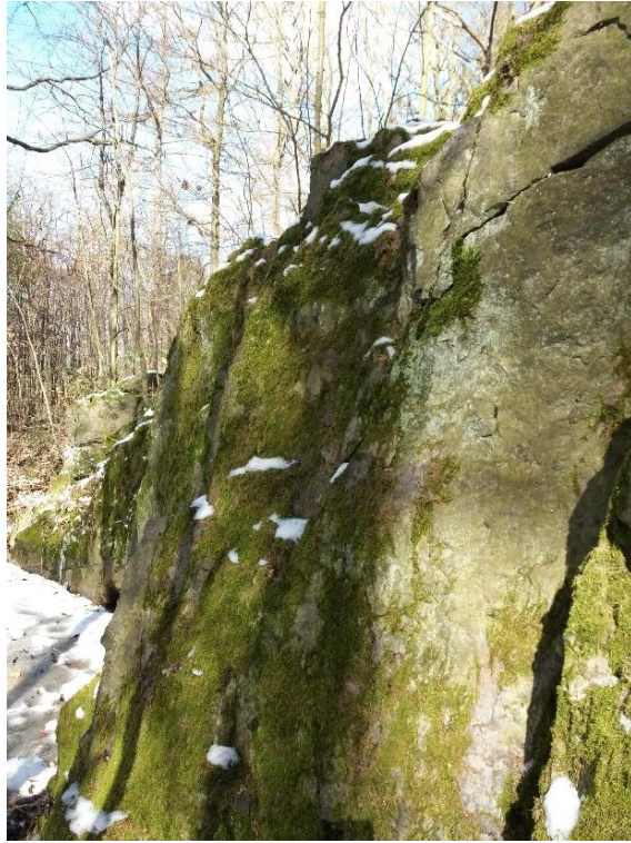
Pohled na bulžňníkovou skálu - detail