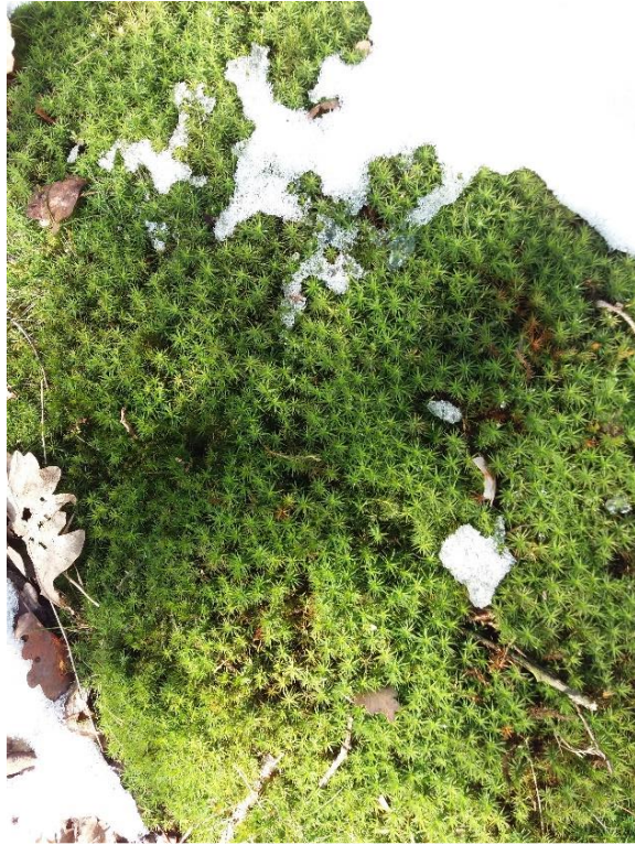
Mechové patro - březen 2018