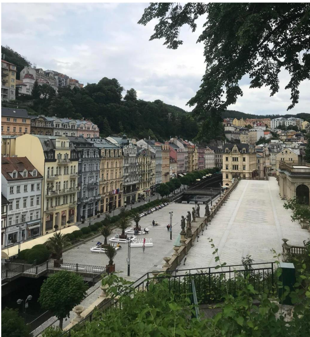
Obrázek 1: Centrum a Mlýnská kolonáda (vpravo).

Následně zmiňuje přibližný počet osmdesáti léčivých termálních pramenů, které se vyskytují v Karlových Varech, jejichž účinků se využívá při léčbě celé řady onemocnění. Jako ten nejznámější označuje Karlovarské vřídlo, nejteplejší český termální pramen, s teplotou 73 °C, který mohou návštěvníci obdivovat na stejnojmenné Vřídelní kolonádě.