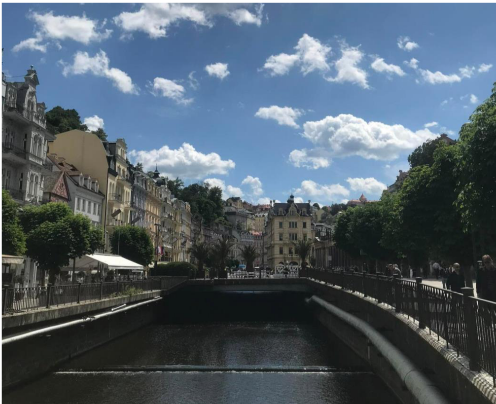
Obrázek 2: Řeka Teplá v Karlových Varech.

mohou lidé při návštěvě Karlových Varů okusit, jako návštěvy muzeí – Muzeum skla Moser či Návštěvnické centrum Becherovky, hudební festivaly – např. VARY GOOD FEST či