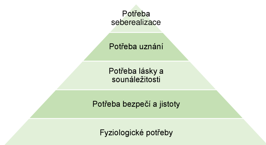
Obr. 2 Maslowova hierarchie potřeb

Maslowova hierarchie potřeb je založena na myšlence, že člověk bude dostatečně motivován jen případě, kdy uspokojí nejprve potřeby nižšího řádu a až následně potřeby řádu vyššího. Maslowova teorie tak uspořádává lidské potřeby od pěti úrovní. Lidský jedinec musí nejprve uspokojit fyziologické potřeby, tvořící základ pyramidy a až postupně se může dostat k potřebám nevyšším, které se nachází na vrcholu pomyslné pyramidy (Přikryl, online.)