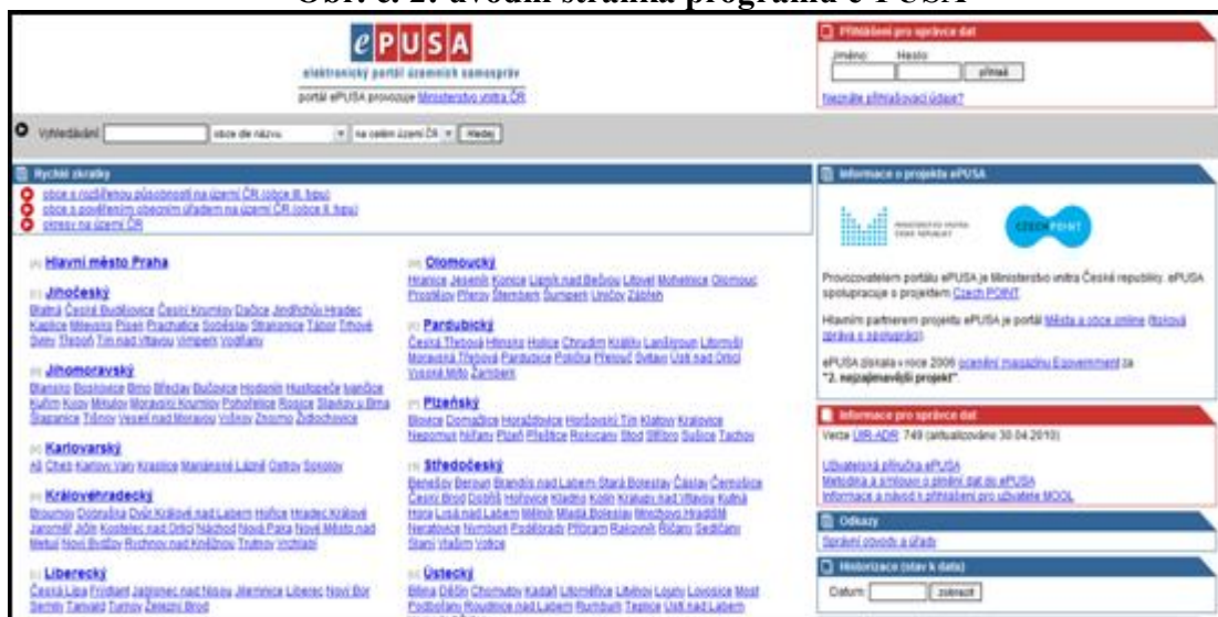
Obr. č. 2: úvodní stránka programu e-PUSA

Úvodní stránka portálu zobrazuje rozvržení podle krajů ČR spolu s odkazy (zkratkami) přímo na větší města daného kraje. Popisky: vyhledávání nahoře, rychlé zkratky těsně pod, zkratka kraje vlevo, správní obvody a úřady, sekce odkazy. V každém momentě navigace je v horní části stránky formulář pro vyhledávání obce, subjektu či zřizované organizace podle názvu, nebo osoby podle jména na území celé ČR nebo na aktuálně zvoleném území. K dispozici jsou taktéž tzv. rychlé zkratky, které umožňují přeskakovat jednotlivé úrovně vypisování a umožňují např. výpis všech okresů na území ČR bez potřeby výběru kraje.