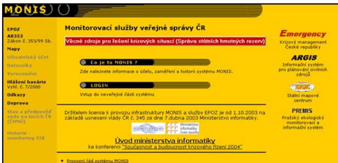
Obr. č. 3: úvodní stránka programu MONIS