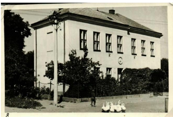
budova školy ze 60. let 20. stol.