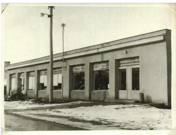
obchod 1975