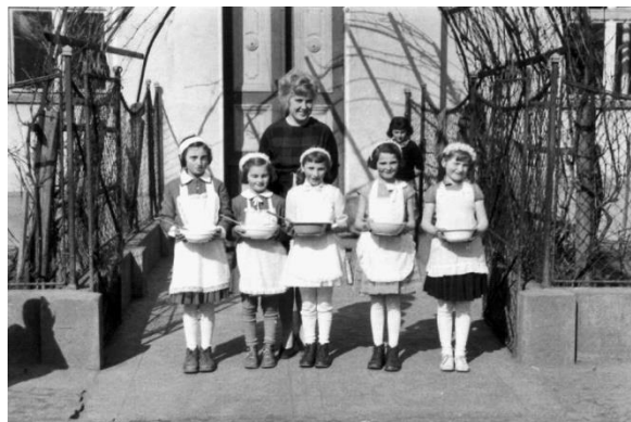
bývalé žákyně 50. léta 20. stol.