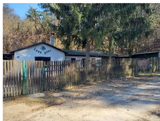
myslivna 2022