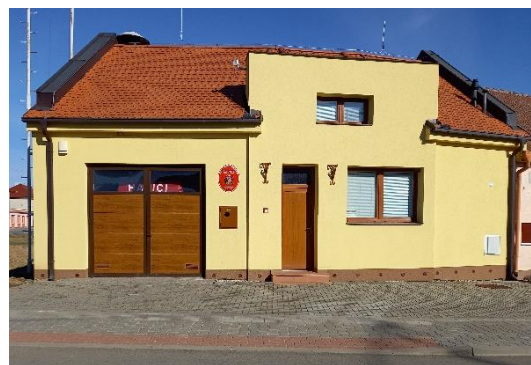
hasičská zbrojnice 2022