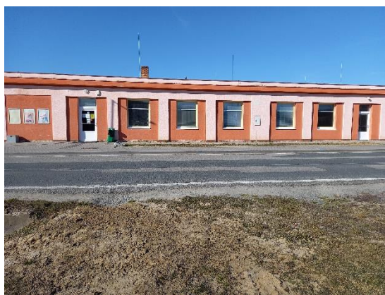
obchod 2022