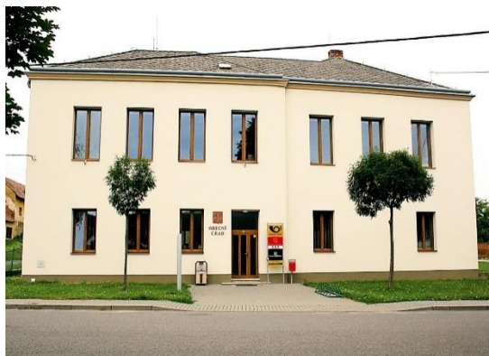
budova školy 2022 – obecní úřad