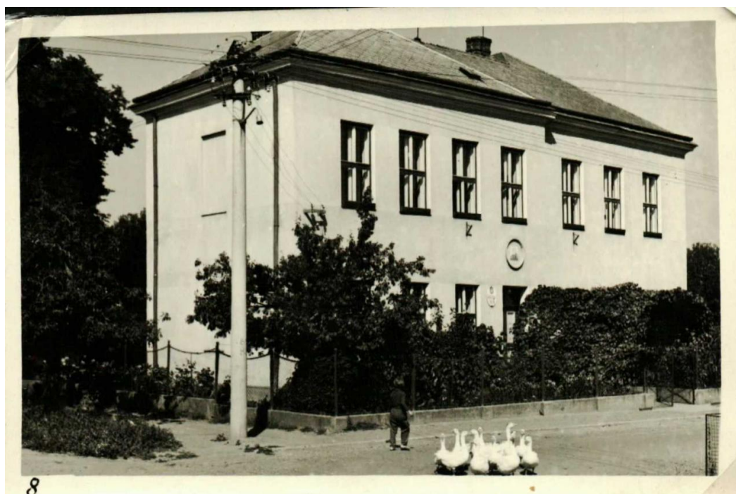
Příloha 7: Budova bývalé školy v Žádovicích ze 60. let 20. století