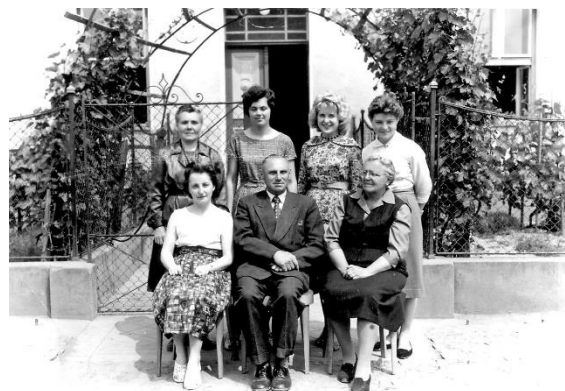
učitelé školy 50. léta 20. stol.