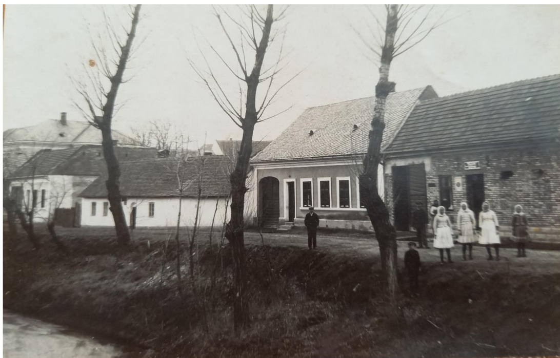
Příloha 6: Dobová fotografie cesty ke škole z 1. pol. 30. let 20. století