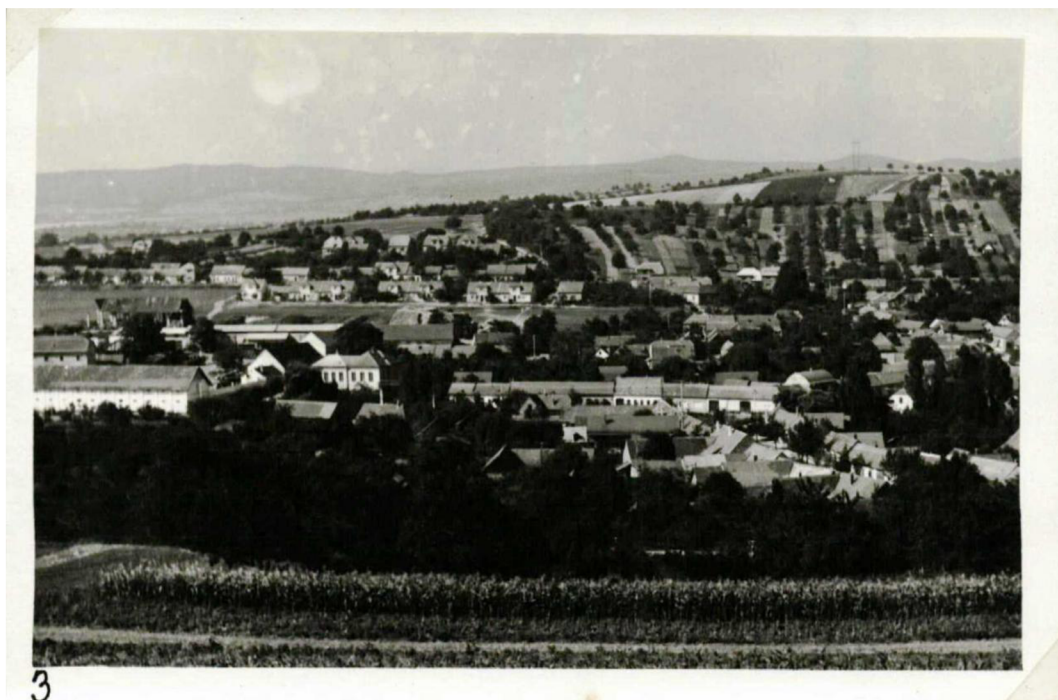
Příloha 8: Dobová fotografie obce z části Pod Kříbem r. 1970