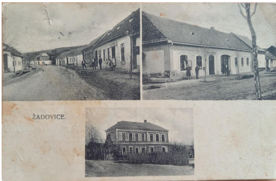
Příloha 5: Dobová pohlednice obce Žádovice r. 1930