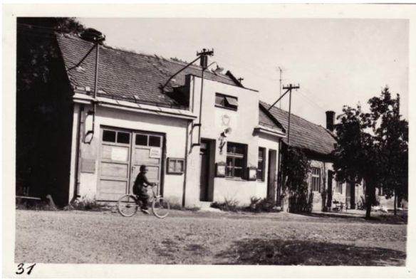
hasičská zbrojnice 1960