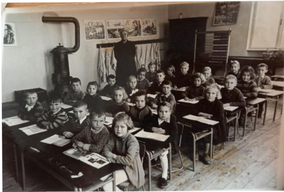
žáci ve třídě r. 1956