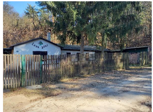
myslivna 2022