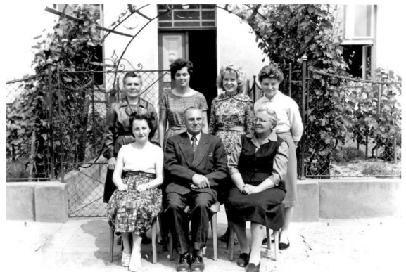
učitelé školy 50. léta 20. stol.