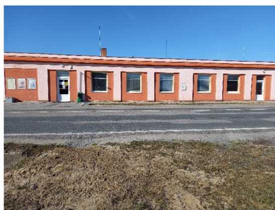
obchod 2022