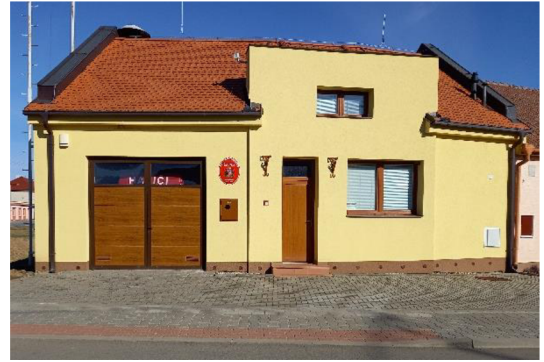
hasičská zbrojnice 2022