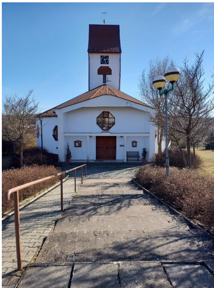
Příloha 11: Vchod do kostela r. 2022