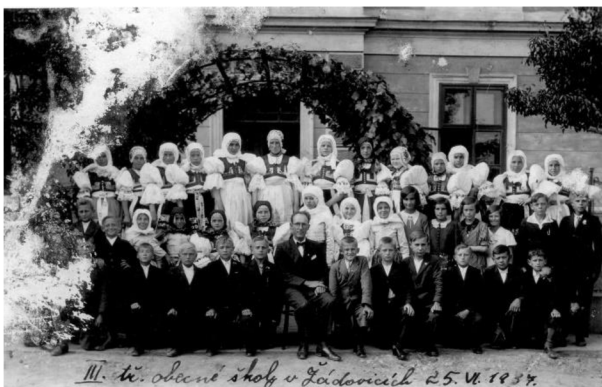
žáci bývalé školy r. 1937