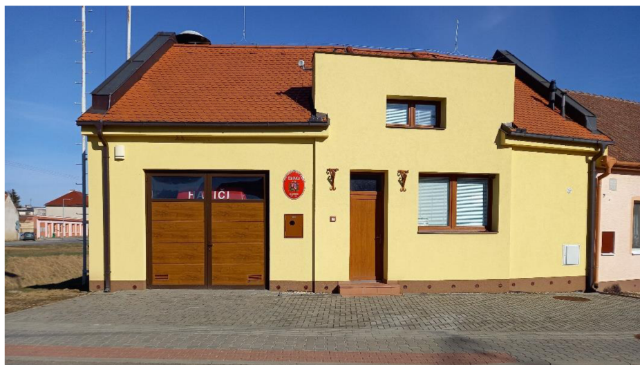
Příloha 12: Hasičská zbrojnice r. 2022