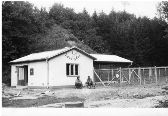
myslivna rok 1985