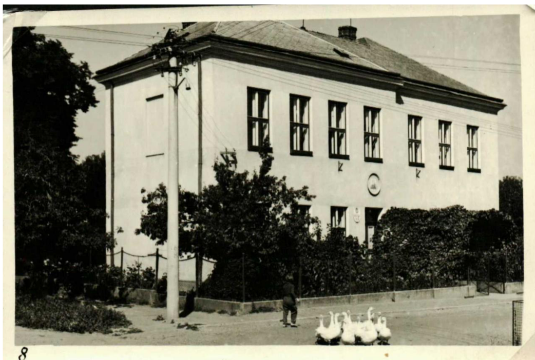
Příloha 7: Budova bývalé školy v Žádovicích ze 60. let 20. století