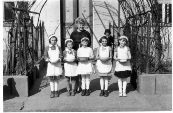
bývalé žákyně 50. léta 20. stol.