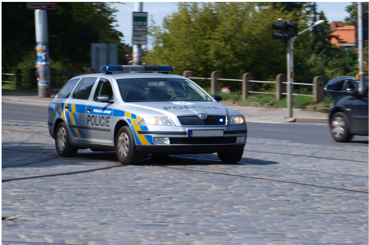
Obrázek č. 10. Každé náhlé úmrtí vyšetřuje policie, což obnáší delší konfrontaci s utrpením než je u hasičů a zdravotníků.