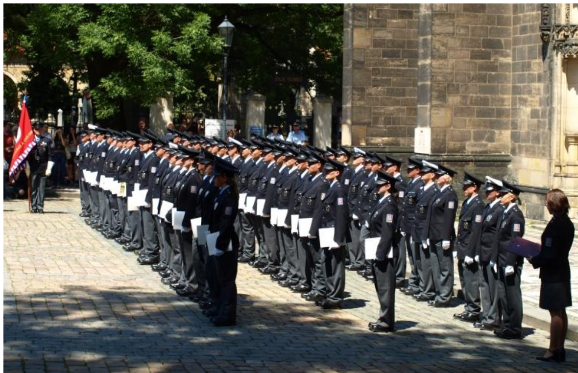
Obrázek č. 2. Policisté skládající služební slib.