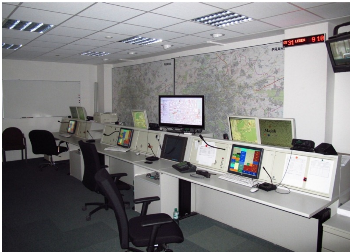
Obrázek č. 5. Dispečink IZS.