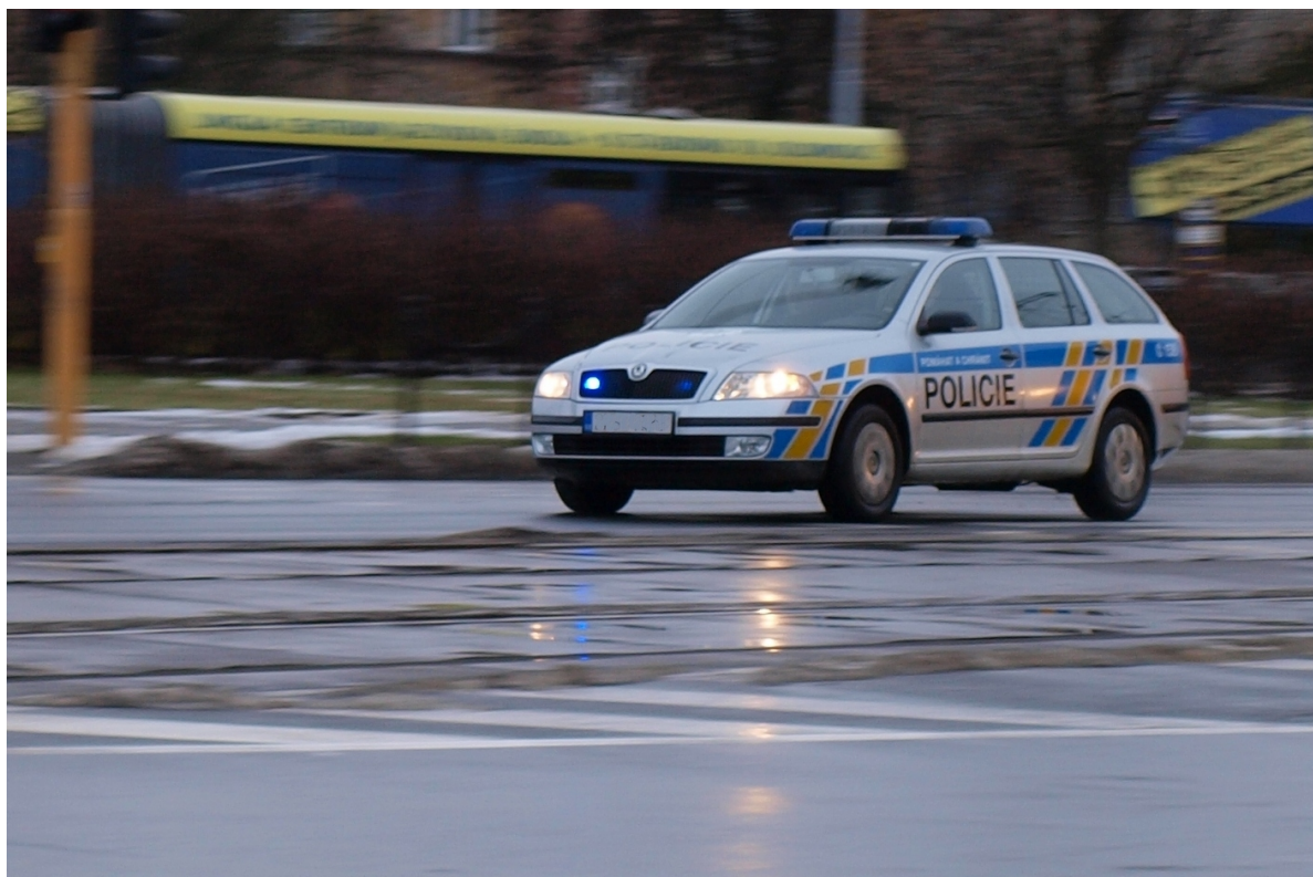
Obrázek č. 1. Při ohlášení události, nikdo z policistů neví co je přesně bude očekávat.