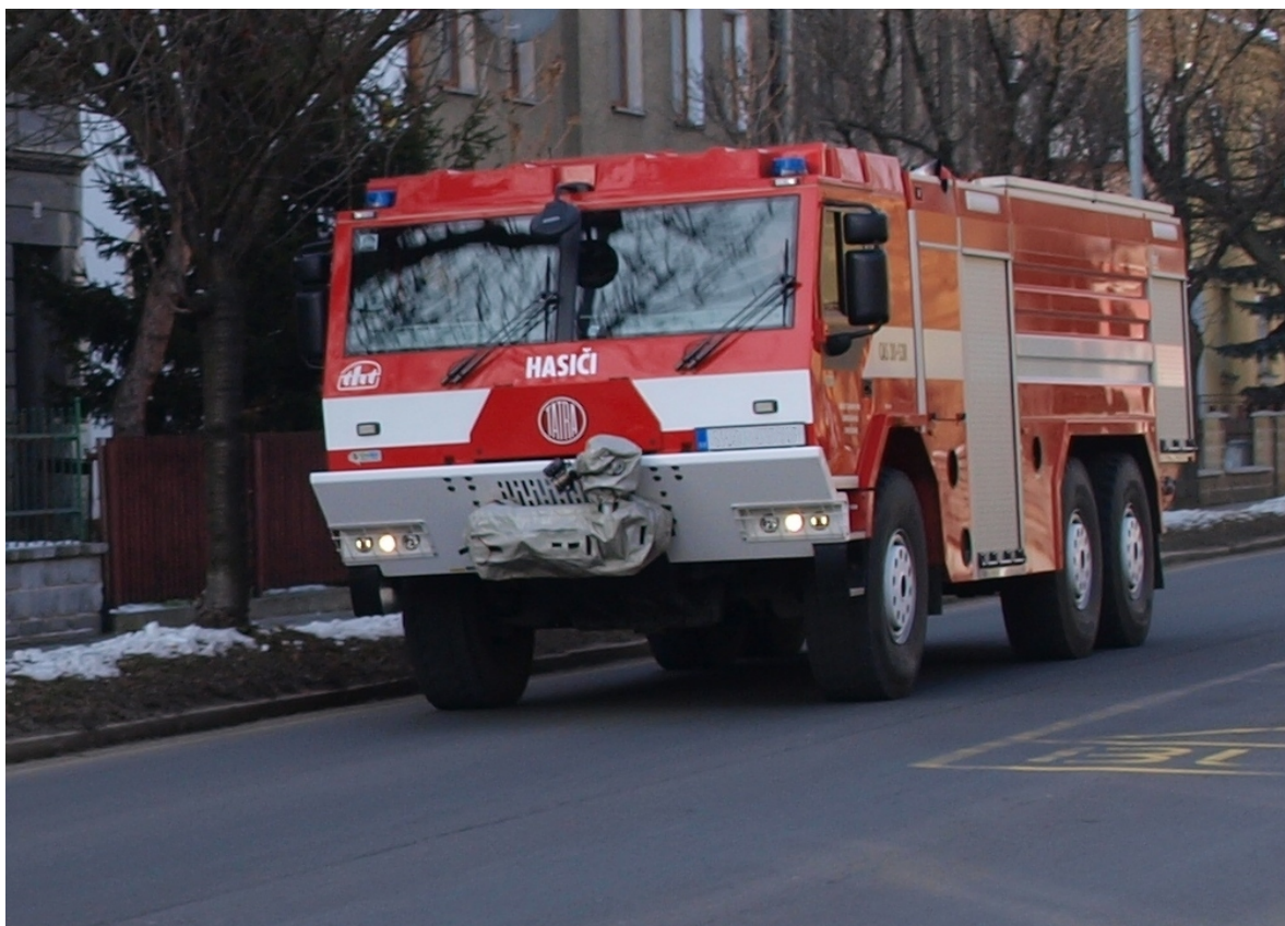
Obrázek č. 3. Technika a vybavenost je nutným předpokladem pro úspěšný zásah.