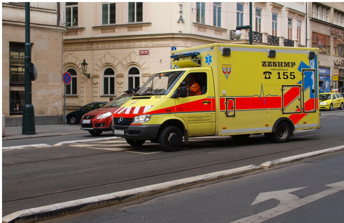
Obrázek č. 4. Převoz pacienta v době hustého provozu, vyžaduje velké zkušenosti řidiče.