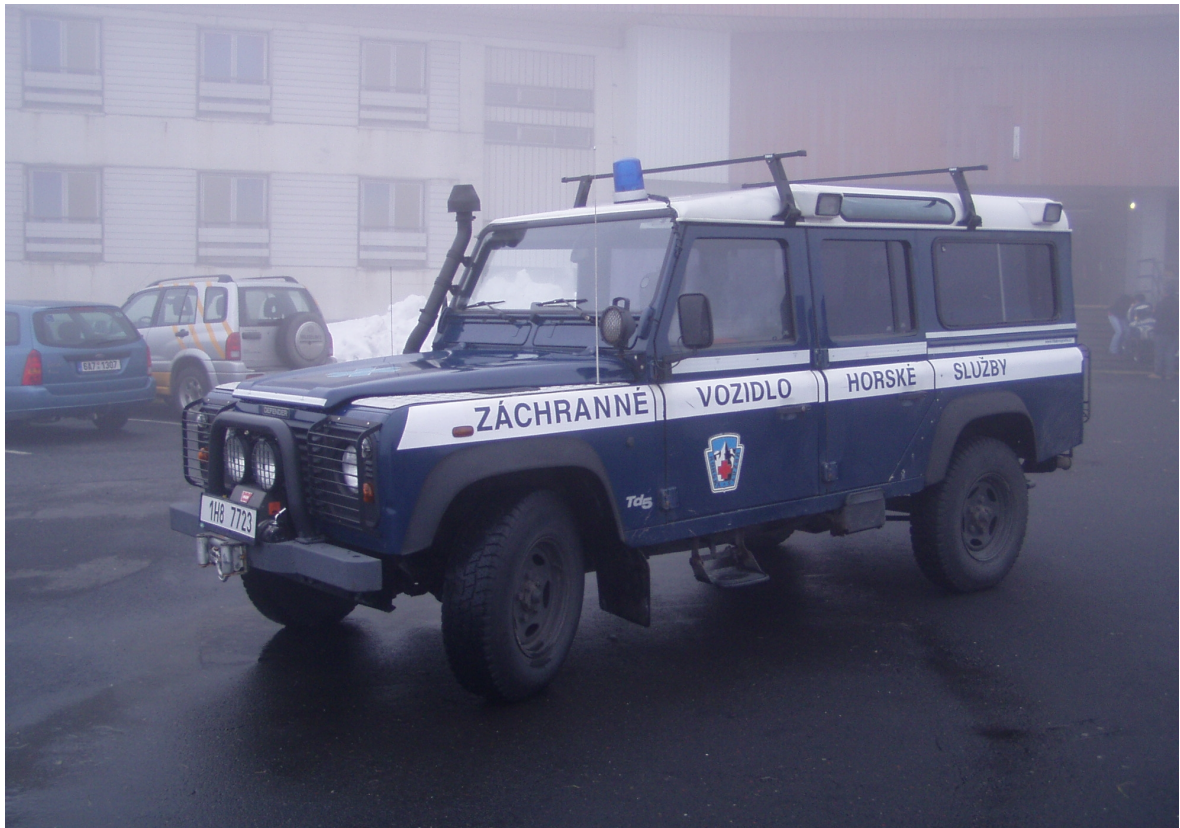
Obrázek č. 9. Každá náročnost v terénu, prověří schopnosti lidí i techniky.