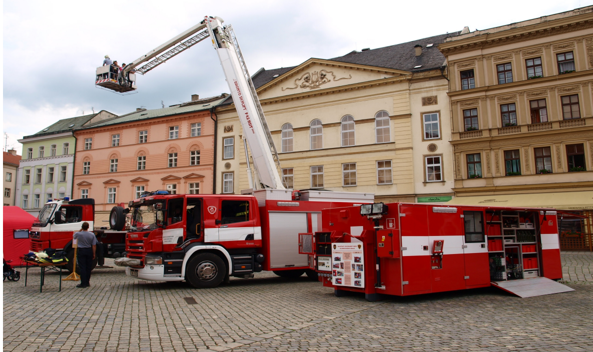
Obrázek č. 6. Ukázka nové techniky Horní nám. Olomouc.