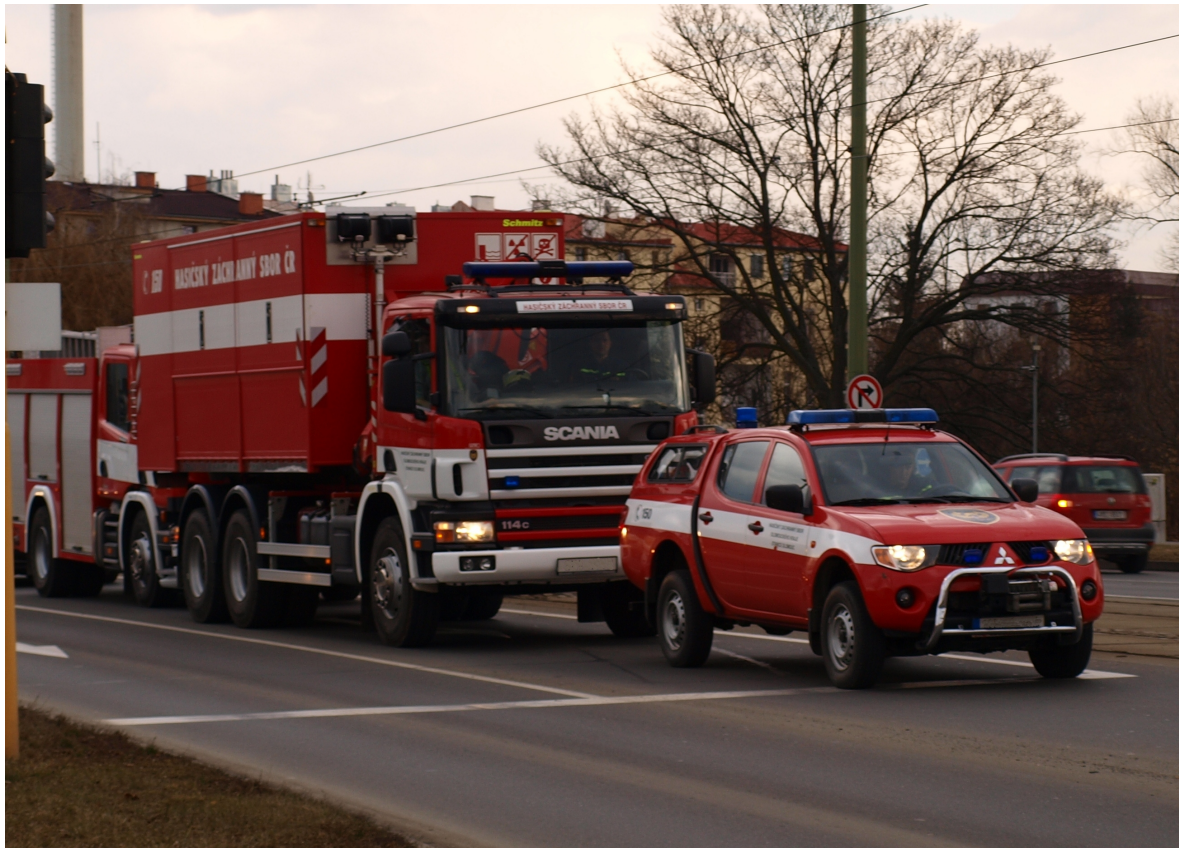
Obrázek č. 7. Návrat jednotek na základnu po složitém zásahu.