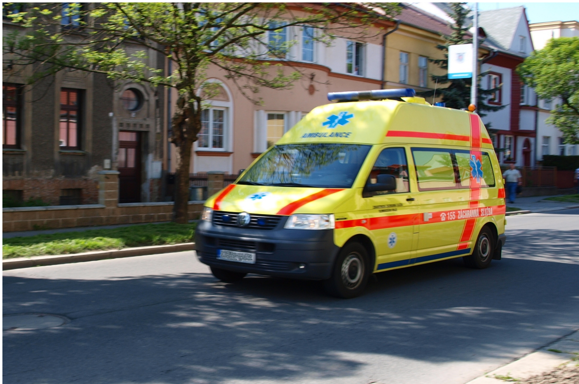
Obrázek č. 8. I přes veškerou snahu záchranářů pacient umírá při převozu.