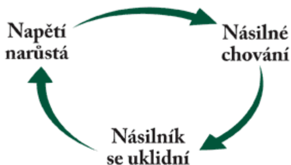
Obrázek 1: Cyklus domácího násilí

Lenore Walker, která poprvé v roce 1979 popsala psychologický profil oběti domácího násilí, vyslovila na základě svých studií týraných žen předpoklad, že k partnerskému násilí dochází v určitém cyklu. Tato teorie napomáhá vysvětlení, proč mnoho obětí zůstává v násilném vztahu po dlouhou dobu (někdy až několik desítek let):